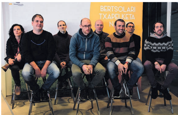
Zortzi finalistak atzoko aurkezpenean Barakaldoko BECen. XDZ

Bezperatik etorriko gara BECera. Bilbon badut beste zeregin txiki bat eta lasaiago ibiliko gara gaua bertan pasata. Jendeak gertu bizi du eta gertu sentitzen dugu guk ere jendea. Ikasleek, inguruko jendeak animoak eman dizkit egunotan. Azken batean, zabal-tzen da halako ilusio orokor bat final ona izan dadin, bakoitzak bere favoritoa izateaz gainera. Horrek eragiten du denak ere animatzea: guk elkar, guk gure burua eta inguruak gu denok.