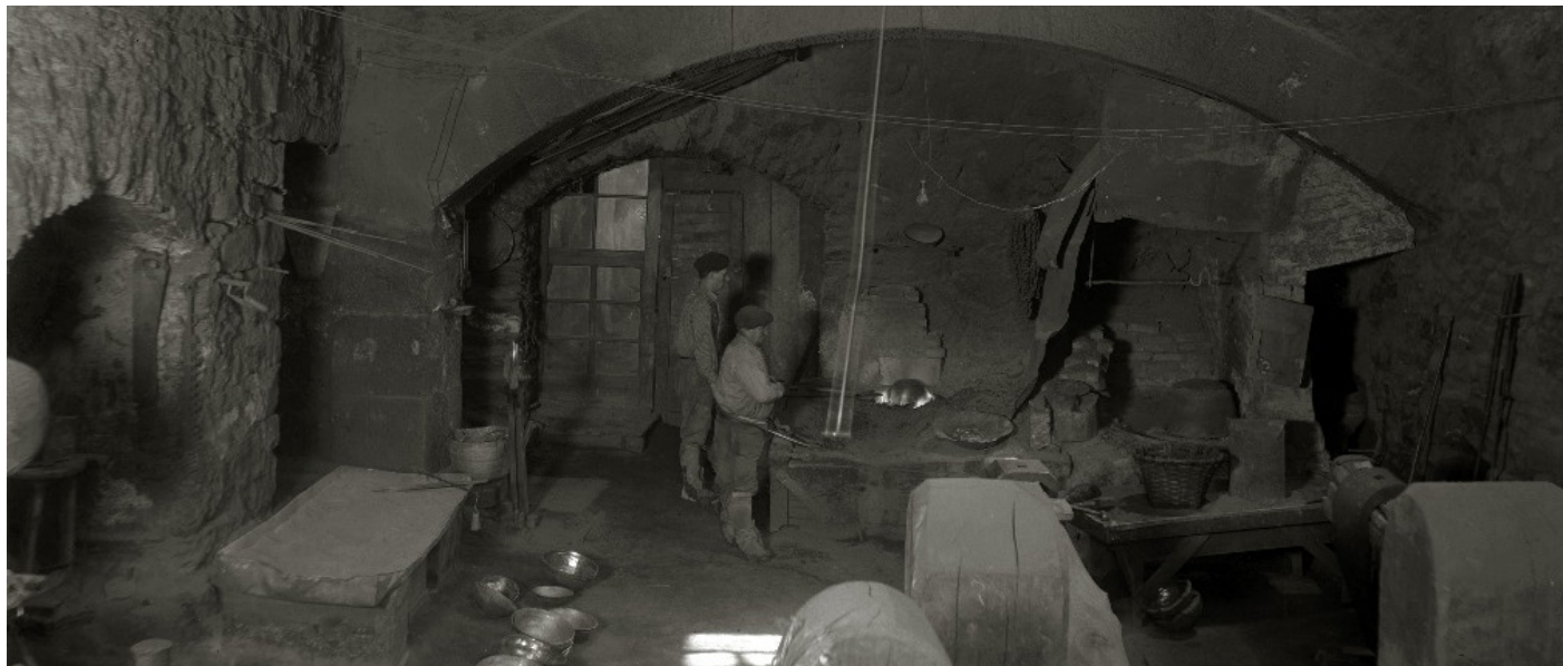
KUTXATEKA: Erref.: 80275343. Fondoa: Pascual Marin, 1917.