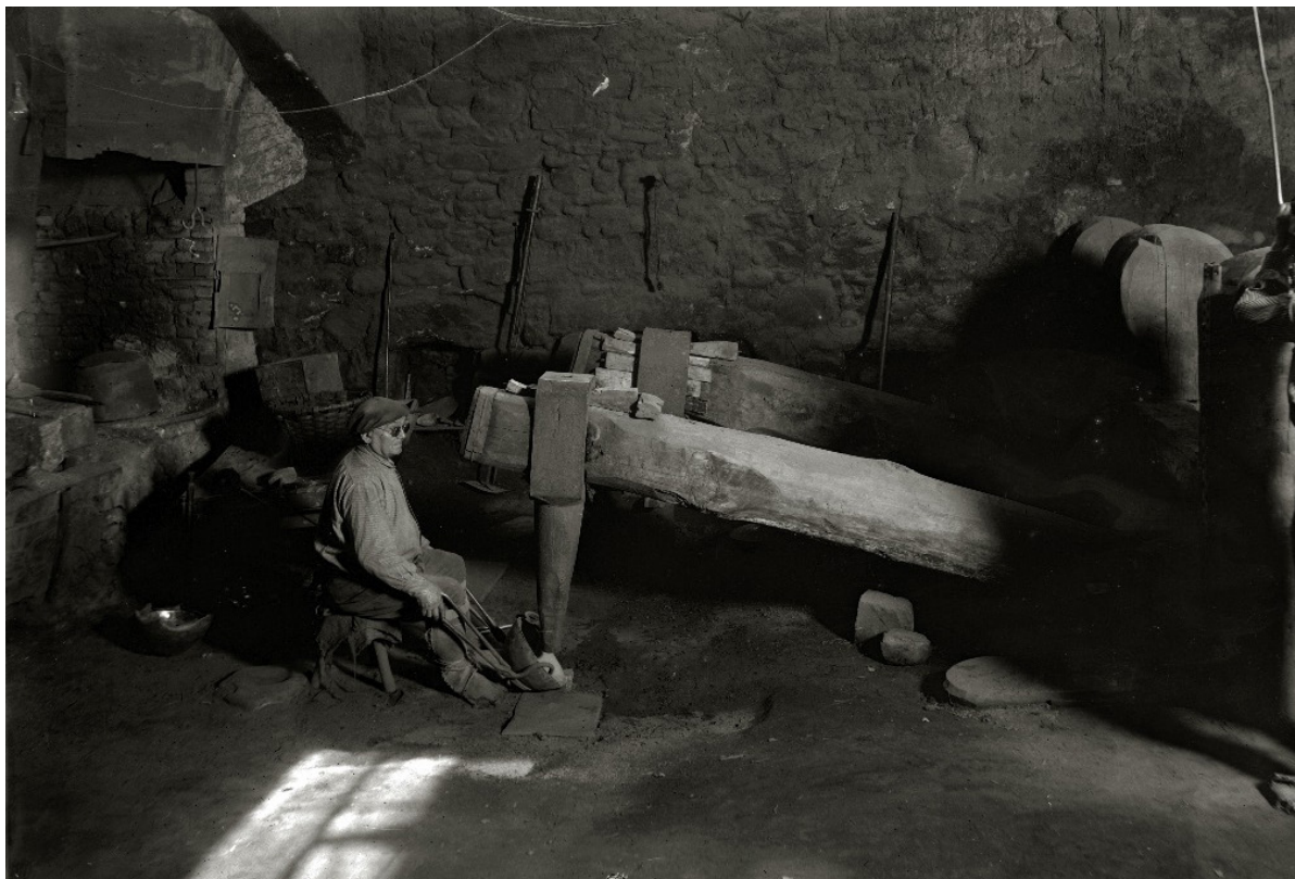
LINAZASORO, Iñaki: Ibarra, erabateko he- rria. Ibarra: Ibarra- Udala, 1997 GARMENDIA LARRAÑAGA, Juan: La ferrería Azkue la Nueva o Pertzola en la villa guipuzcoana de Ibarra: Estudio histórico etnológico. Donostia: Eusko Ikaskuntza, 2007