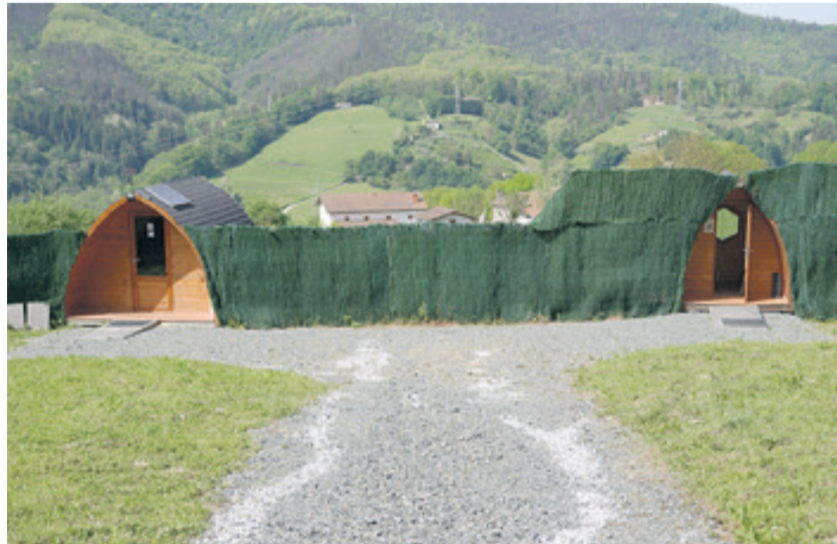
Ezkerrean erlauntzako airea arnasteko etxola; eskuinean, erleen sauna. ATARIA

Arduradunek azaldu dute hamar saio inguru behar izaten direla eragina nabaritzeko, baina soilik erreferentzia moduan erabiltzen dute kopuru hori. Hain zuzen, bonu bereziak ere eskaintzen dituzte, hamar saioak egitea eko-