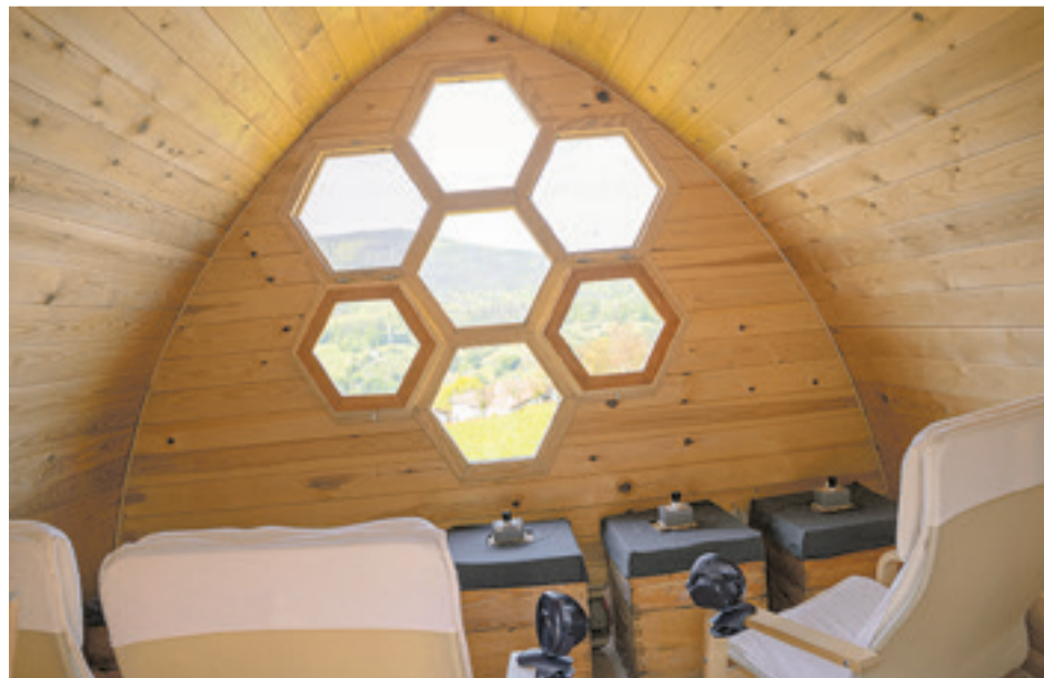
Erlauntzako airea arnasteko etxolaren barrualdea. ATARIA

Era berean, ageriko onura horiez gain, sistema immunologikoa indartzeko ere balio duela uste dute arduradunek. «Immunizazioa hobetzen dela ez gara berehalakoan ohartzeko; baina indartzeko da. Gaixotasun gutxiago izango ditu sistema immunologikoa indartsu