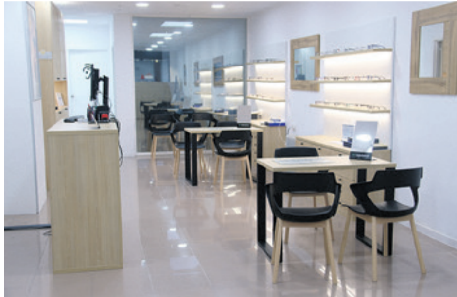
Tolosako Kale Nagusian dagoen optika eta audiologia zentroa barrutik. ATARIA

Garapen teknologikoa handia izan da arlo honetan. Gaur egun, audifono diskretuekin egiten da lan: ia ikusezinak izaten dira, soinu-kalitate handikoak eta erabiltzaile bakoitzari egokitutakoak. Badira ikusten ez diren audifonoak, ingurunearekin konektatzeko aukera ematen dutenak, eta protesia-