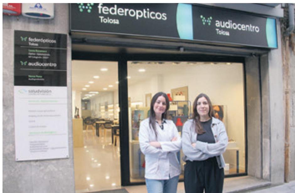
Tolosako establezimenduko arduradunak denda atarian. ATARIA

Urte hasieratik zentroak bere posizioa indartu du tokiko nortasuna galdu gabe, eta orain, lehen baino are gaitasun handiagoa du eskualdeko bezeroei zerbitzu integrala emateko.