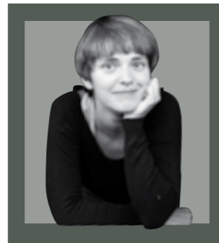
Eider Olazar Elduaie Tolosaldeko Bilgune Feminista

Martxoak 8, Emakumeon egunaren jiran, ohiko adierazpenak alde batera utzi eta proposamen zehatz batekin nator. Ez da denbora asko lñauteiak pasa zirela eta oraindik buruan daukat gure herriko festa kuttunei hasiera eman zitzaieneko unea, ostegun gizeneko txupinazoaz ari naiz. Irudi esanguratsua eta mediatikoa, herritarrak protagonista diren Tolosako jai nagusia lehertzen den unekoa; eskualdeko hedabide guztietan tarte nagusia hartu zuen irudia eta beste zenbait hedabideetan ere bere isla izan zuena. Ez zen plaza zaharreko bizilagunen dekorazio faltagatik izango baina argazki hari, beste behin ere, kolorea falta zitzaion. Emakume bat bera ere ez zen ageri udaletxeko balkoi nagusian, aurrez esan bezala, herritarrak protagonista diren Tolosako jai nagusiaren momentu sinboliko nagusian.