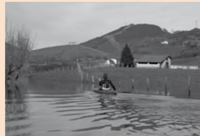
Lindozuloko uretan arraunean. Berastegiko San Sebastian ermita atzealdean

Prezipitazioak neurtzen diren-etik, aurtengo urtarilla inoizko euritsuena izateko bidean da gurean, 500 lm2 Añarbe urtegi inguruan, 500 mm edo metro erdiko altuera asko da, (urte hasieran belaunerainoko katiuskak jantzi izan bagenu eta igerileku huts batean geldi egon izan bagina Sansebastianetarako ura goialdetik sartzeko beste baten, hamar egun beranduago belauburitik gora, kalkulatu urte normal batean 1.700 mm inguru botatzen dituela gurean baina mar-txa honetan !!!).