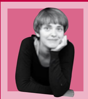
Eider Olazar Tolosaldeko Bilgune Feminista