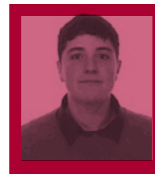
Iñigo Azkue Hirukide Ikastetxeko ikaslea

Beste ekintza asko aipatzeke utzi ditut (lehiaketak, eskola kanpainak, museoaren eguna...), lerro gutxi hauetan sartzen ez zirelako. Argi dago, nire uste apalean, kulturak herriak hezten dituela, herrien izena eta izana gordetzeko giltza dela. Horretan Topic-ek egiten dituen ahaleginak goraipatze-koak dira guztiz. Heziketa da aurrerabidearen oinarria, zutarria. Zabalduta egin behar