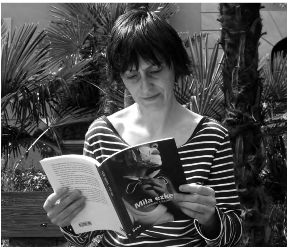
"Garbi daukat kirola esker hasi zirela ezkerrek libre izaten"

Batzuena bai. Askok dira eskuindua dituzten ezkerrek. Baina ezker edo eskuina izatea alde batera utzita, goa-