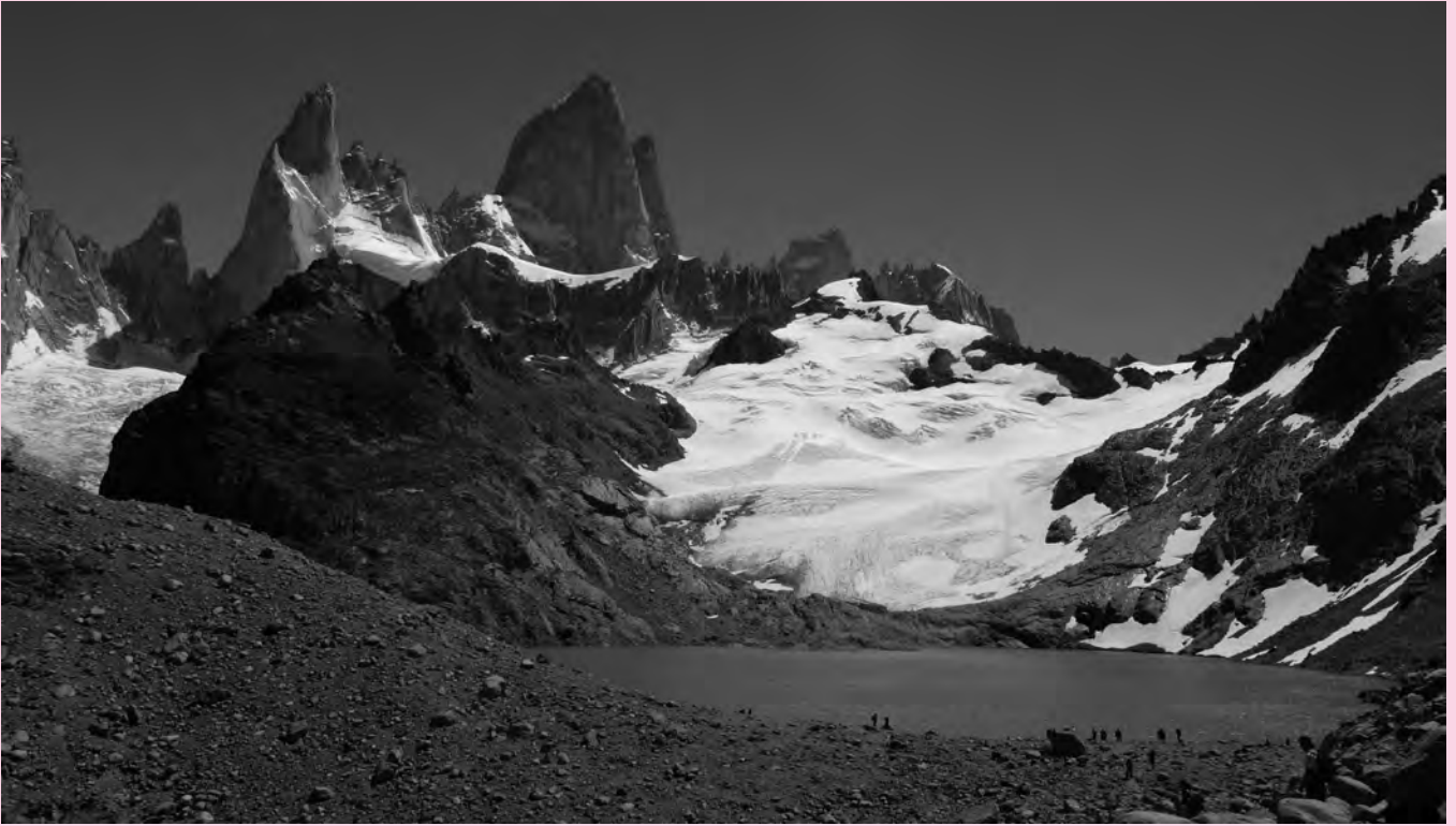
Patagonian Chalten herritik abiatuta egindako ibilbidearen saria. Fitz Roy eta Cerro Torre mendiak.