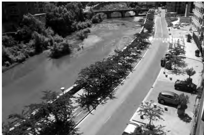
Azken urteetan doako 100 aparkaleku kendu dituzte Belaten.

Ez da Belate auzoan horrelako zerbait gertatzen den lehengo aldia. Duela urte bete bizilagun baten furgoneta kixkailita geratu zen norbaitek kontenedoreari su eman ondoren. Inor ez da ezbehar horren arduradun egin. “Udaletxeak esan zuen zaborra biltzen duen enpresaren ardura dela. Azken hauek ere eskuak garbitu zituzten, soilik zaborra biltzeaz arduratzen direla esanez”. Ezbehar horretan bertan kaltetuta geratu zen etxe-ko fatxada. Azken kalte hauek bai, aseguru etxeak beregain hartu zituen. “Maiz erretzen dituzte auzoko kontenedoreak; duela hilabete bat azkena”. Bizilagunak lasai bizi nahi dute ordea; hurrengo goizean autoa utzi bezala topatuko dutela pentsatuz lo egin.