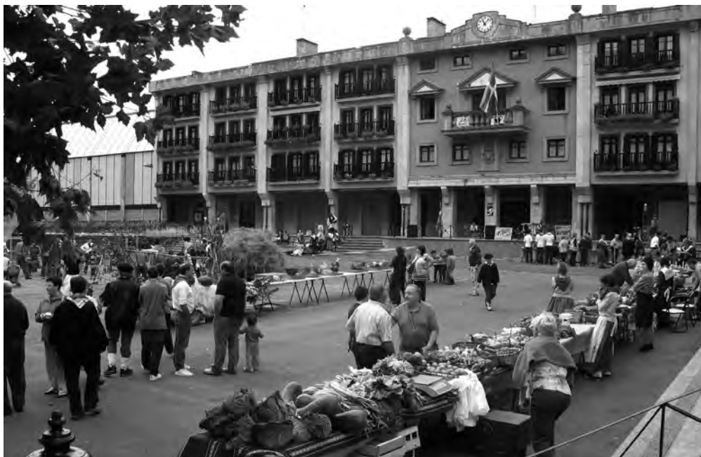
Azokan Anoetako baserritarrak izan ziren protagonista.