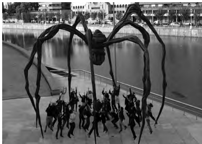
Mikrokosmos taldearen irudia.