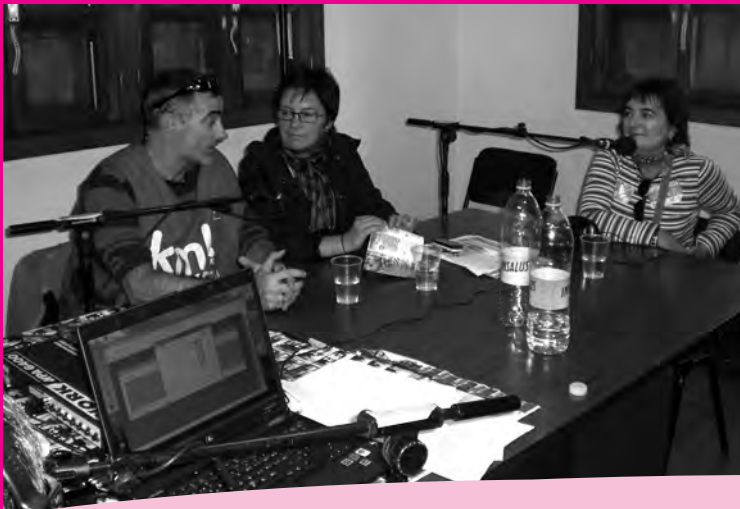
Txolarre irratia egin zuen eguneko megafonia gonbidatu ugariaren laguntzaz.