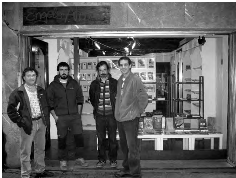
Ekimenaren bultzatzaileak Engels Ateneoaren atarian.

Marxismoaren liburuak aurkituko ditu batipat. Hala ere, baditugu bestelako liburu politiko, filosofiko eta historikoak ere. Helburua liburu marxista klasikoaren gehiengo eskaintzea da. Dударik gabe, hau ez genuke posible izango Federiko Engels Fundazioaren laguntza gabe. Lan garrantzitsua egiten ari dira iraultza betean dagoen Amerika Latina osoan zehar liburu marxistak zabaltzen, La Habanako liburu azoka famatuan ere parte hartuz. Bestetik, liburutegiaren aukera izango du nahi duenak, lehen genion bezala liburuak etxera eramateko aukera ere emanez. Ziur gaude gainera