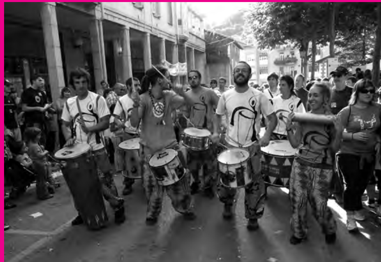
Guneetan ez ezik ibilbidean zehar ekintzak izan ziren, irudietan Mulambo.