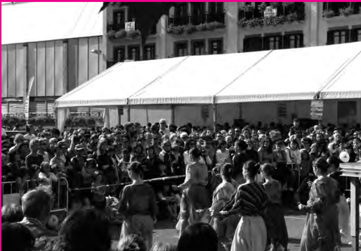
Anoetako plazan ere jende ugari ekintza ezberdinez gozatzen.