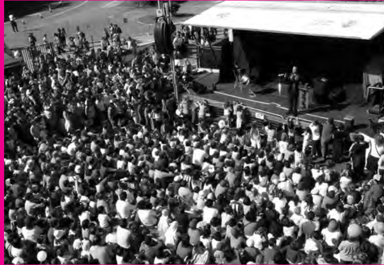
Irurako ikastolako gunea jendez lepo egon zen egun osoan.