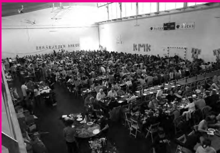
Anoetako kiroldegian 1.000 pertsonentzako lekua zegoen.