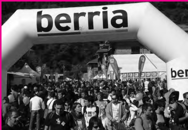
Jendetza Irurako herri gunean.