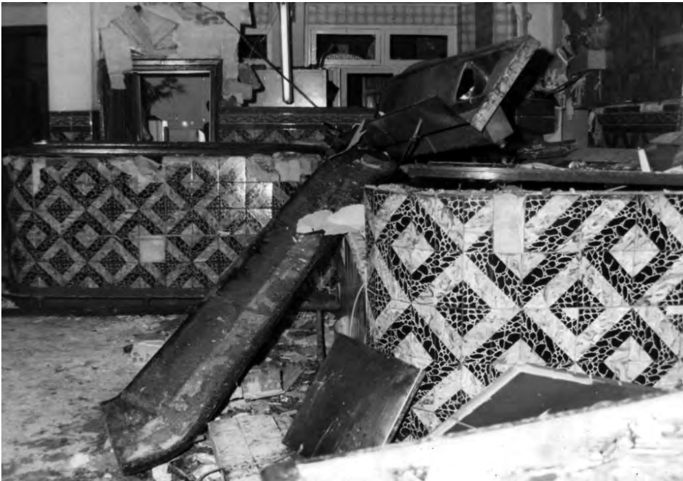
Shanti taberna honela geratu zen bonba lehertu eta gero.

ten zuena zein tontolaba zen esan zidanean, bertan zegoen tontolaba bakarra bera zela erantzun nion. Bestetik, bizibizi ditut oroimenean, Joxean Lasa eta Joxi Zabala, gogotik lan egiten zaborrak atera edo tabernaren muntaketan laguntzen.