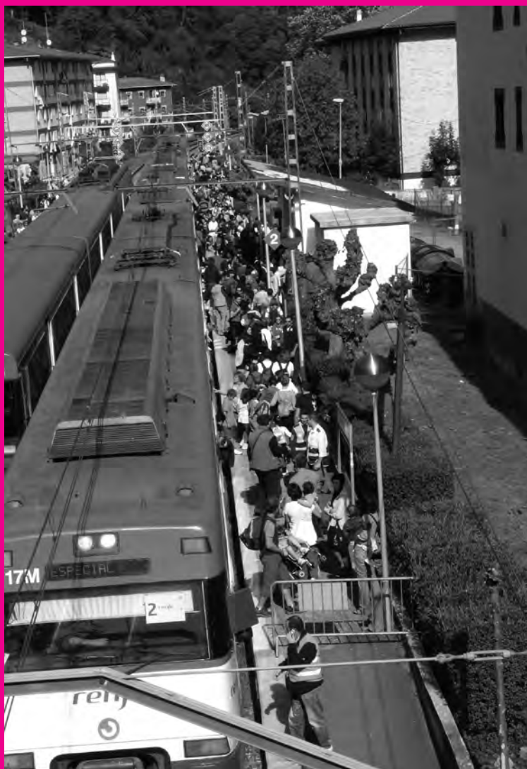
Jendea erruz etorri zen aldirietako trenetan.