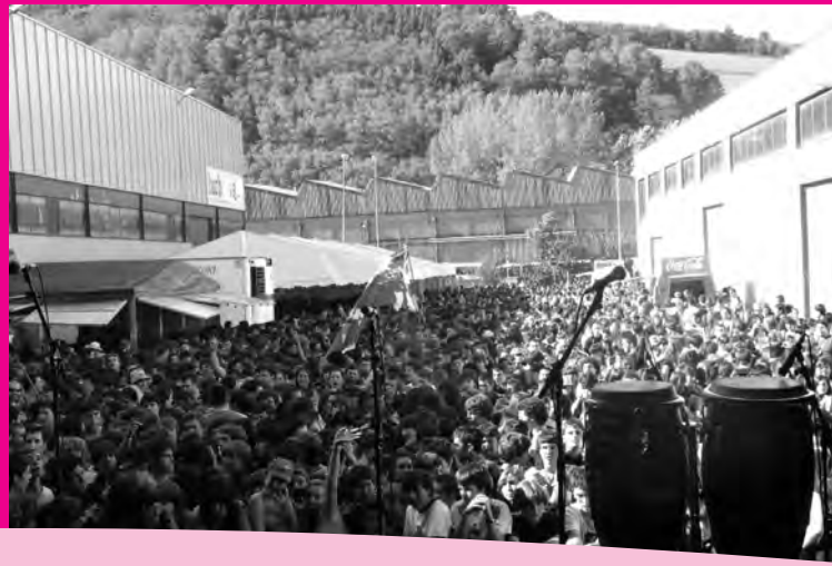
Katategin milaka gaztek gozatu zuten bertako musika eskaintzaz.