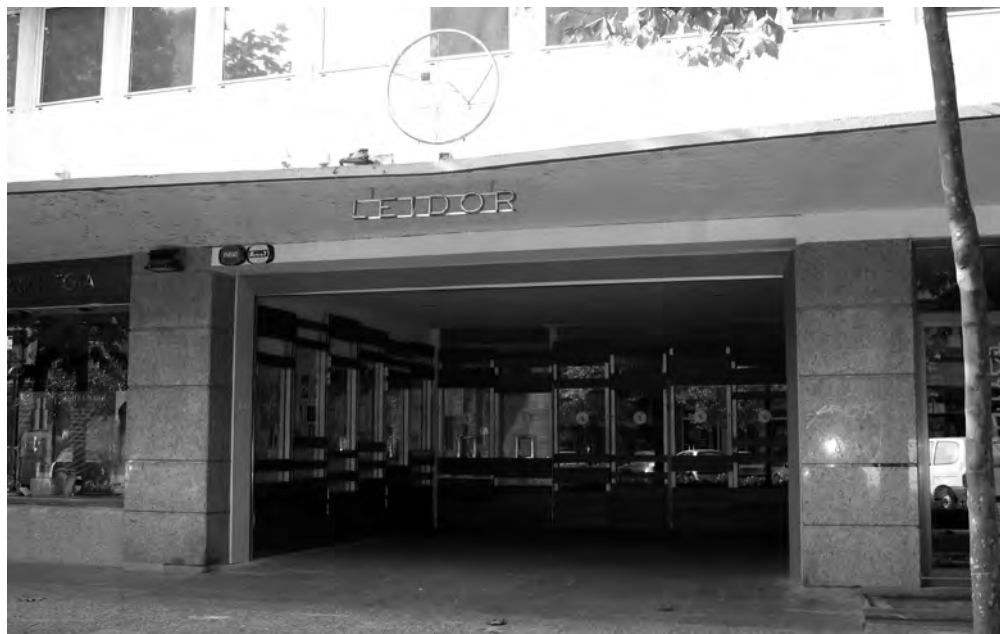
2009. urtean zineak tarte gehiago izango duela aurreikusten da.