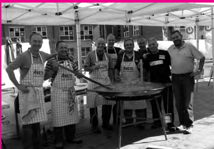
Laskorain ikastolakoek prestatu zuten paella ia 1.000 pertsonek dastatu zuten.