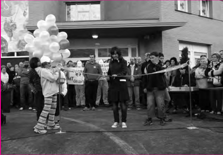
Ibilbidearen irekiera ekitaldiarekin hasi zen festa.