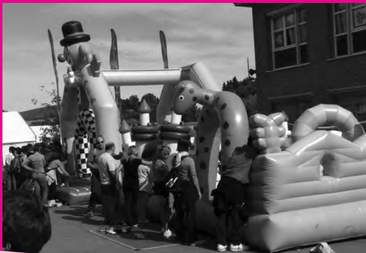
Anoetako ikastolan denetik egin ahal izan zen.