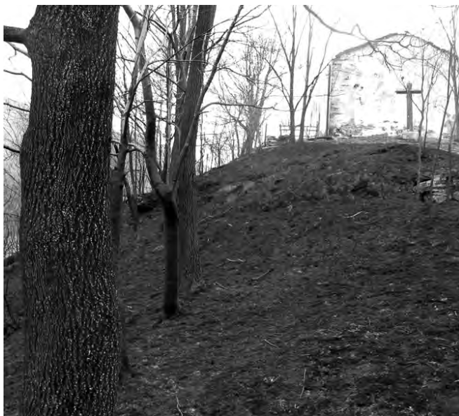
2005eko Elduaingo sutearen ondorioz era honetan geratu zen Santa Kruz basiliza.