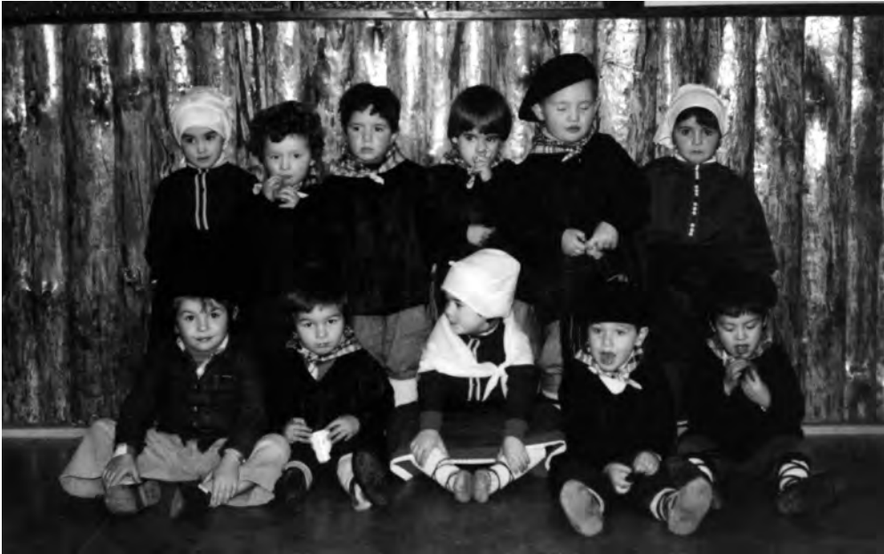
Irurako Ikastolako lehenengo ikasleak.

“Gurasoen artean kezka handia zegoen. Ikastolan, ordura arte ez bezala dena euskaraz irakasten zen eta pedagogia berritzailea erabiltzen zen”.