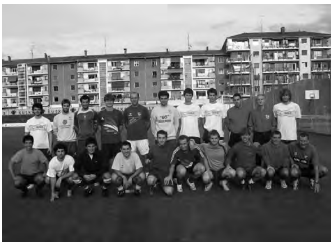
Tolosa CF futbol taldea.