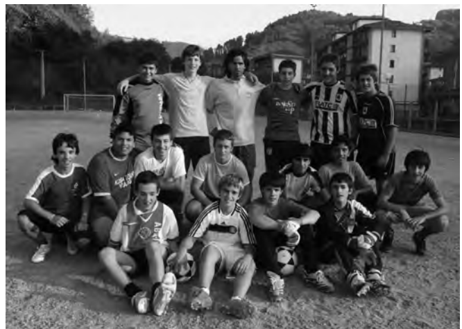
Alegiako Intxurreko kadeteak.