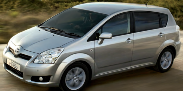
TOYOTA COROLLA VERSO DIESEL 136 CV LUNA