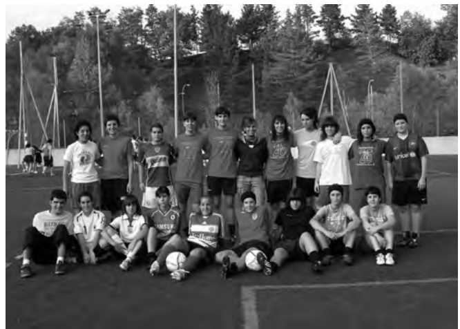
Tolosako nesken taldea.

Borroka. Hori egin behar dute Tolosaldeko futbol taldeek denboraldi berrian, erronka berrirei aurre egiteko. Hori bai: beti ere baloiaekin gozatuz. ■