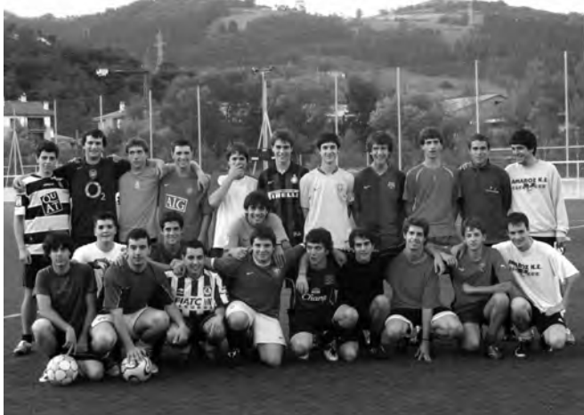
Amarozko jubenilen taldea.