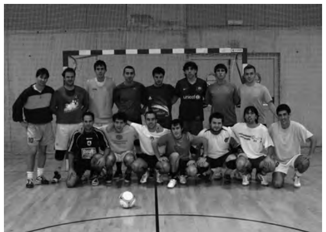
Laskorain areto futbol taldea.