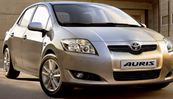
TOYOTA AURIS 1.4 97 CV 3P.