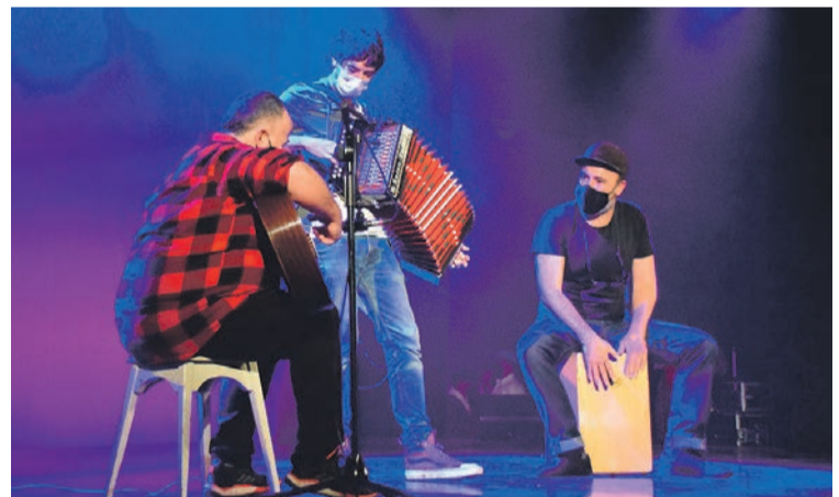
Musikaz gozatzeko aukera izan zen ekitaldian. I.S.A.