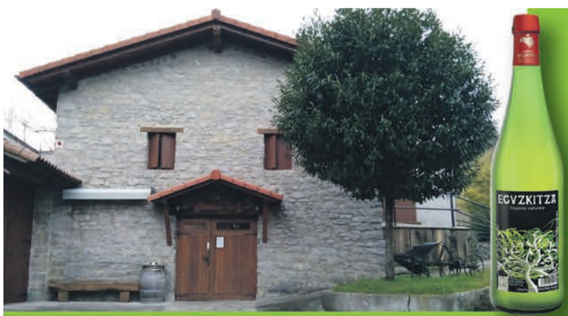
Usabal Auzoa, 25 TOLOSA

TOLOSALDEKO ATARIAK ez du bere gain hartzen egunkarian adierazitako esanenen eta iritzien erantzukizunik.