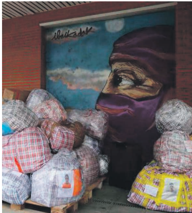
Pasa den ostiralean bildu zuten Tolosako elkarrekin zegoen materiala. L.CARRASCO

Eli Eizagirre elkarrekin kideak adierazi du pandemiaren ondorioz, azken bi udaratan Saharako haur eta gazteak ezin izan direla