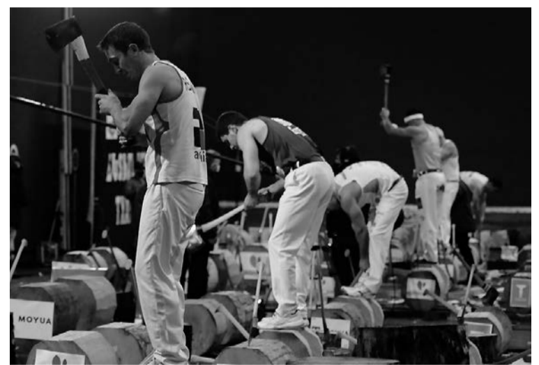
Sei finalistak esfortzu betean, Beotibar pilotalekuan. LEYRE CARRASCO

«Hunkituta» eta «ilusionatuta» bukatu zuela adierazi zuen irabazleak, bere lehen finala izan baitzen: «Nire lehenengo finala izan da, eta txikitatik amestu dudana, gainera. Mentalizatuta egon naiz, prestaketa onak egin da eta aizkorarekin gozatu dut». Arazo txikik ere izan zituen tartean; hala nola, aizkora puskatu edota adar pare bat tokatu zi-