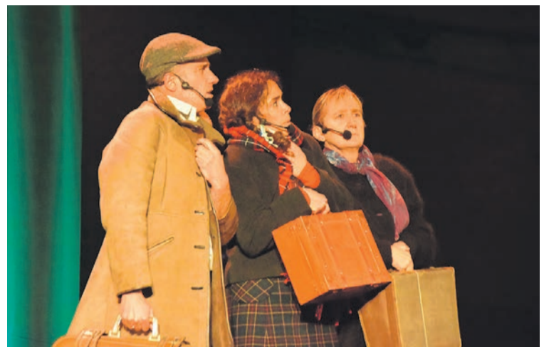
Antzerkia egin zuten Uzturpeko ikasle eta irakasleek. I.S.A.