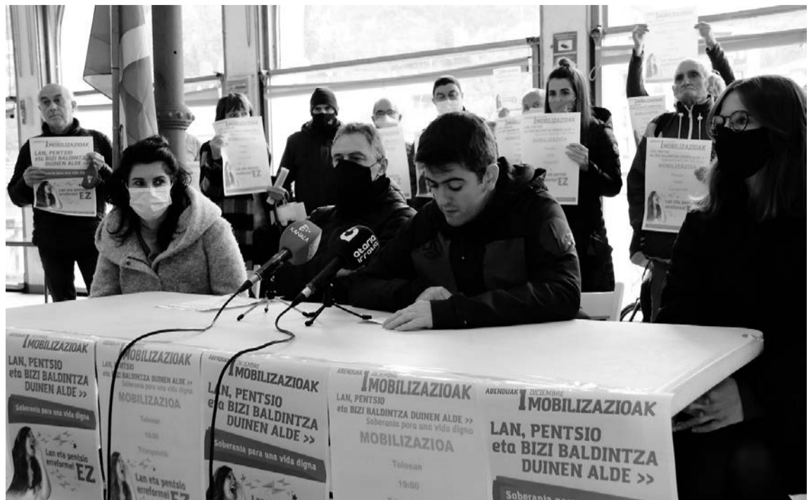
Joan den ostegunean Tolosako Zerkausion hainbat eragilek elkarrekin egin zuten agerraldia. I. T.

Eragile ezberdinekin harremanetan dago udala gertatzen ari dena aztertzeko. «Herri txikia gara, Zizurkilgo Udalak ez du bitartekorik larunbat gauetan gertatzen dena kontrolatzeko. Baina, herri txikia izateak ez du esan nahi edozer gauza onartu behar dugunik». Bandoan aipatu du ulertzen eta babesten duela elkartzeko eta ondo pasatzeko gogoia izatea, «baina inola ere ez bizilagunak jasaten ari direna eta txiki-zio ulertezin hau».