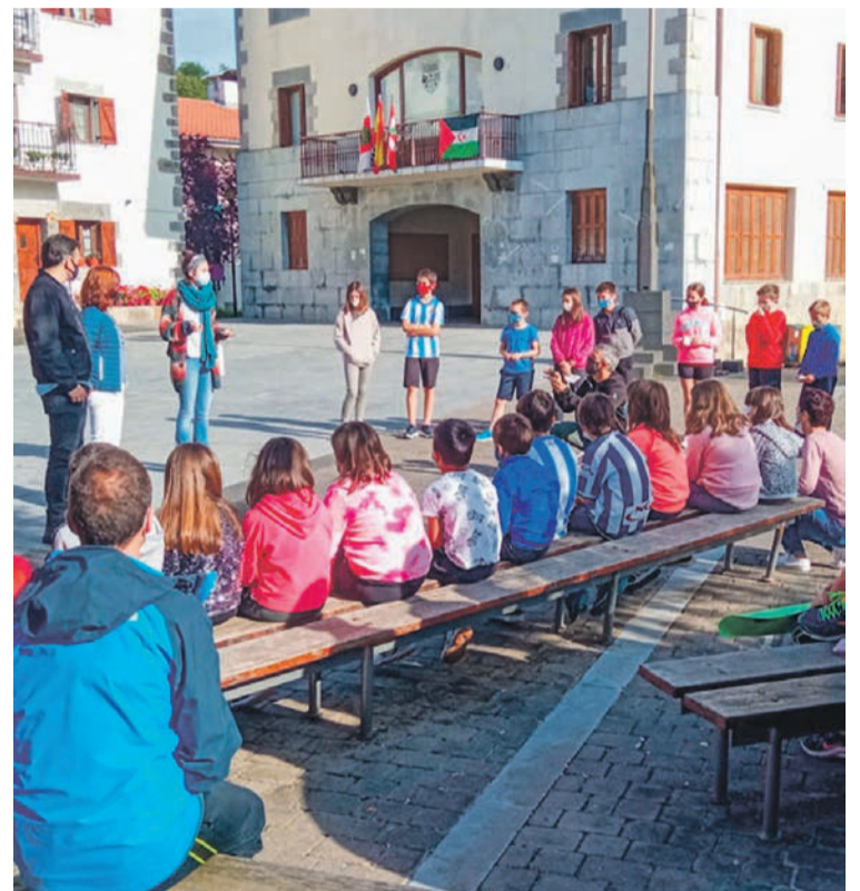
Gazteak Adunan, konpromiso eta proposamenen berri ematen. ATARIA

Ikastetxetako gazteek gain, Lanbide Heziketako beste 1.045 ikaslek hartu dute parte ekimenean. Don Bosco, Fraisoro Eskola, Tolosaldea LHI, Inmakulada Ikastola eta Peñascalen Baratzeko Eskola proiektua landu dute aur-