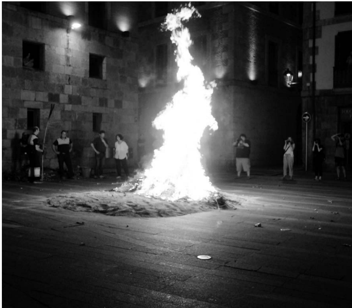
Iaz, gonbidatu gutxi batzuk soilik izan ziren Tolosan piztutako suan; aurtun, herritarrek ere bertaratu ahal izango dute. J.A.

Leabururen kasuan, udalarekin elkarlanean, kultur egitarau zabala antolatu du jai batzordeak. Ekintzetan parte hartzeko, ekainaren 24a baino lehen eman behar da izena, udaletxera deituz (943 675 931) edo WhatsApp mezua bidaliz (648 915 569). Ekitaldi guztietan herritarrek izango dute lehentasuna, eta frontoiko saioen kasuan, 80 laguneko izango da edukiera.