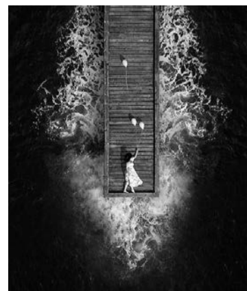
2019ko edizioko irudiak daude ikusgai erakusketan. MANU BARREIRO / JAVIER ZABALA

rria lehiaketako irabazlea. Bigarren saria, berriz, Manu Barreiro Rodrigezen Liberacion argaz-