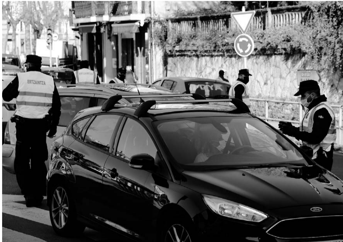
Tolosa eta Ibarra arteko mugan Ertzaintzak jarritako kontrola, atzo. J.ARTUTXA

Tolosaldean ere nabaritzen da gorakada orokorra. Azken asteko datuei erreparatuta, hau da, urtarrilaren 11tik 18ra bitarte, 154 positibo egon dira, gehienak Tolosan, 77. Atzetik du Amasa-Villabona 27 positiborekin eta Ibarra da hurrengoa, 13rekin. Zizurkil (10), Alegia (9) eta Irura (9) dira kopuru altuak ere dituzten hurrengo herriak. Horiekin batera Leaburu-Txarama (5), Berrobi (2), Hernialde (1) eta Amezketan (1) egon dira positiboak. Azken asteko datuak duela hilabetekekin alderatuz gero, kopurua ia laukoiztu egin dela ikusi daiteke. Izan ere, abenduaren 14tik 21ra 41 positibo egon ziren eskualde-