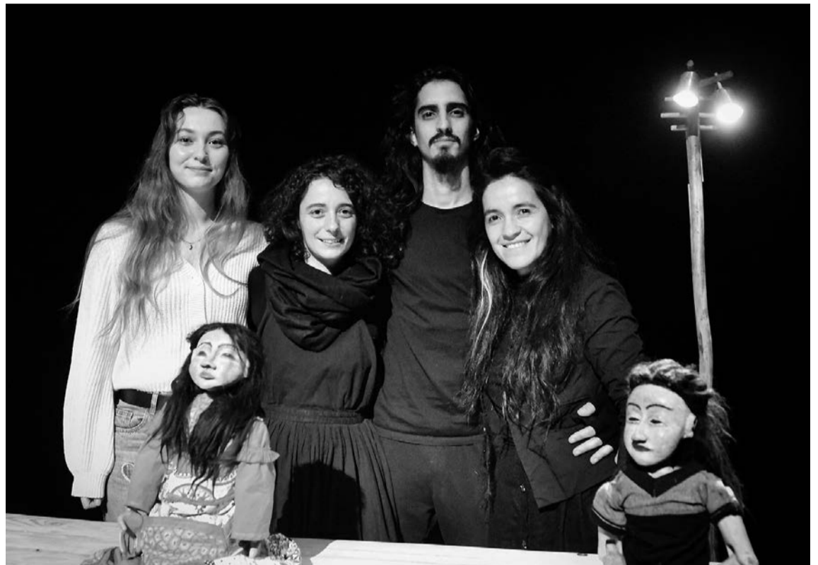
'DéraciNés' izeneko obraren eszena ezberdinak egonkortzen aritu ziren, Tolosan, Alas negras konpainiako kideak. TOPIC

Mahaiko eta itzalezko txotxongiloen lana da DéraciNés . «Herri autoktonoak deserrotzearen ondorio batzuk erakusten dizkigu istorio honek, batez ere