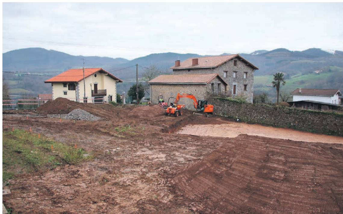
Uztartza atzealdeko eremuan hasi dira parke berria eraikitzeko lanak; uda aurretik amaituta egotea aurreikusten dute. J.M.

Adunako Udalak badu ingurumenarekiko konpromisoa, eta