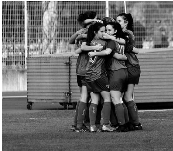
Ezkerrean, Tolosa CF-ko jokalariek Arratiaren aurkako gol bat ospatzen; eskuinean, partidaren une bat.