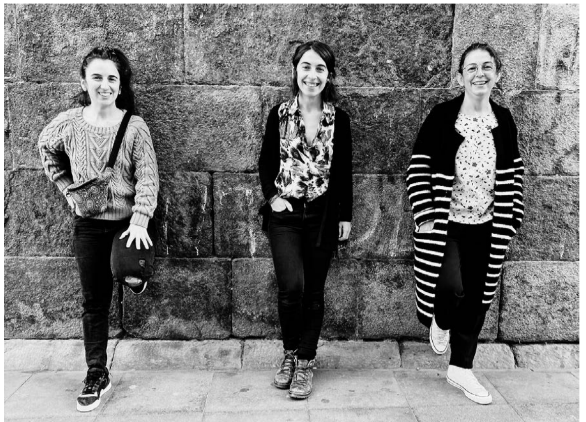
Kaori faktoriako, Amlu studioko eta Basajaun liburu dendako arduradunek bultzatu dute Taupacka. JON ANDER ARTOLA

Artisautza eta kulturaren arloan lan egiten duten Villabonako hiru saltokik eskaintza bateratua sortu dute, elkarren indarrak batuz