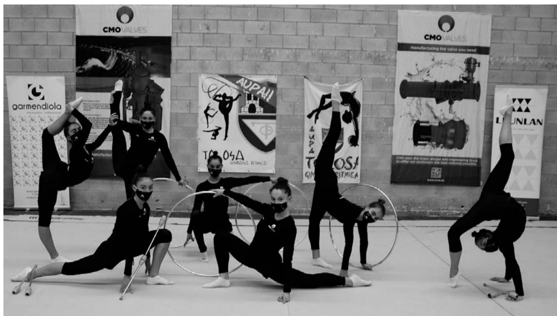
Tolosa CF-ko lehen mailako gimnastak, klubak Usabalen erabiltzen duen pabilioian. I.G.L.

Klubeko talde nagusiak, lehen mailan aritzen denak, bi txapelketa ditu urtarrilean, eta horretarako prestatzen ari dira, maila horretan jarraitzeko helburua baitute