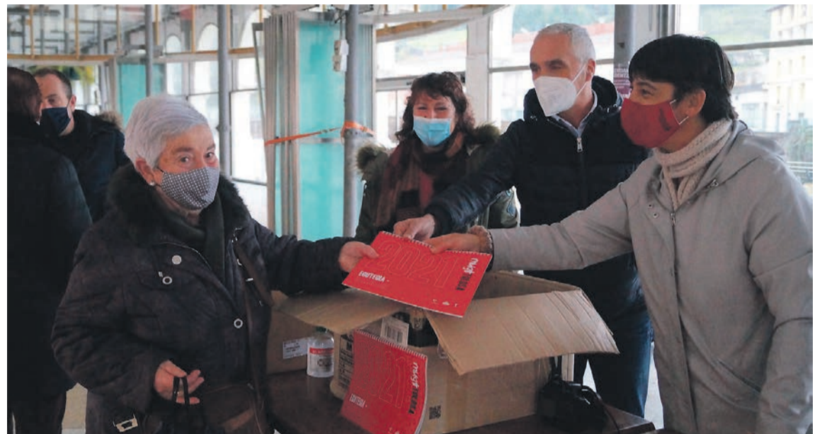
Zerkausian ari dira egutegia banatzen. Irudian, atzo, herritarrek Mugi egutegia jasotzen. JOSU ARTUTXA