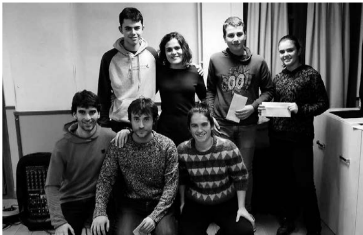
lazko irabazleen taldeko argazkia.

Bertsolari txapelketako sarrerak telefonoz erreserbatu daitezke edo Asteasun, Zizurkilen edo Villabonan erosi