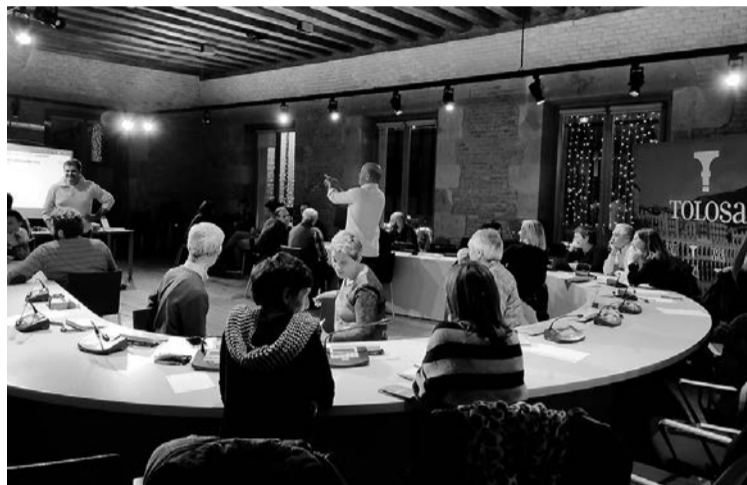
Abenduan sortu zuten Tolosatzen Eskola Irekiko talde motorra. TOLOSako UDALA

Maiatza bitarte iraungo du ikasturteak, eta ekainean balorazio bat egingo asmoa dute. Edo nola ere, aurtengo ikasturteari hasiera emateko, eta egitarauaren berri emateko, ekitaldi bere-