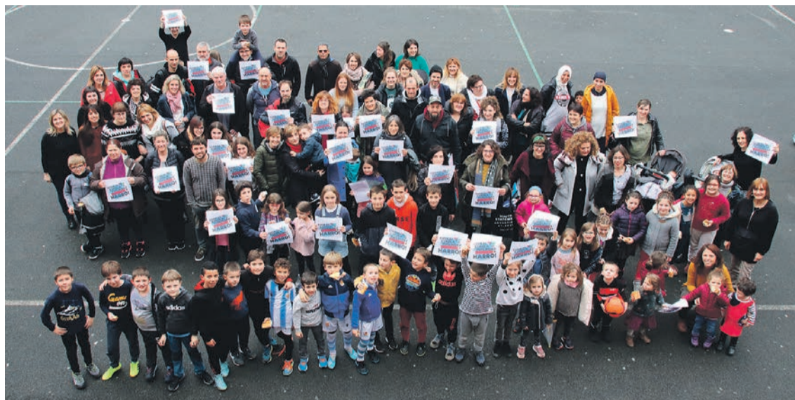
Alegiako Herri Eskolaren aurrean elkartu ziren argazkia ateratzeko. E. MAIZ

EAeko ikastetxe, eskola, Haurreskola eta laguntza zentro guztiekin jarri nahi dute harremanetan. «Hezkuntza publikoa, historian zehar irabazitako lorpenik handienetako bat da, eta bere garapena gizarte honetan bizi garenon berdintasun eta ongizate mailako adierazlerik onena», dela uste dute. «Hezkuntzarako eskubidea, beraz, Eskola Publikoan gauzatu da, denontzat erakia, denona delako eta guztiontzat. Zerbitzu publiko doakoa eta unibertsala eskaintzen duen bakarra», diote. Eta tinko sinesten