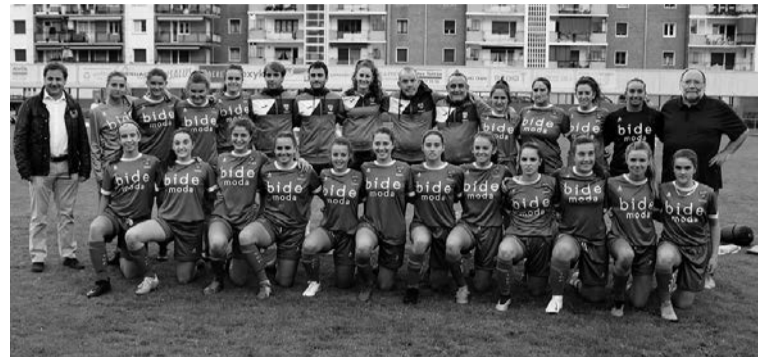
Tolosa CF-ko 1. Maila Nazionaleko taldea.