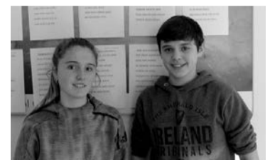
Ane Zubia eta Oibar Olan. ATARIA

matuan izango da, 20:00etan, eta afarirako txartelak salgai daude www.bertsosarrerak.eus web orrian, gaur eguerdira arte.