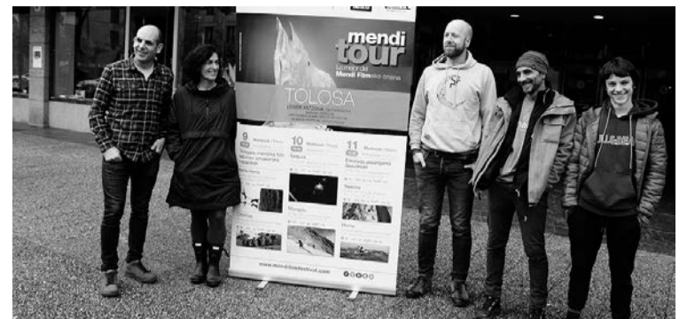
Atzo egin zuten Mendi Tour jaiadiaren aurkezpena, Leidorren. ASIERIMAZ

9:00-13:00. Denboraren kudeaketa eta konpromisoari buruzko saioa (gehienez, 20 lagun), kultur etxean.