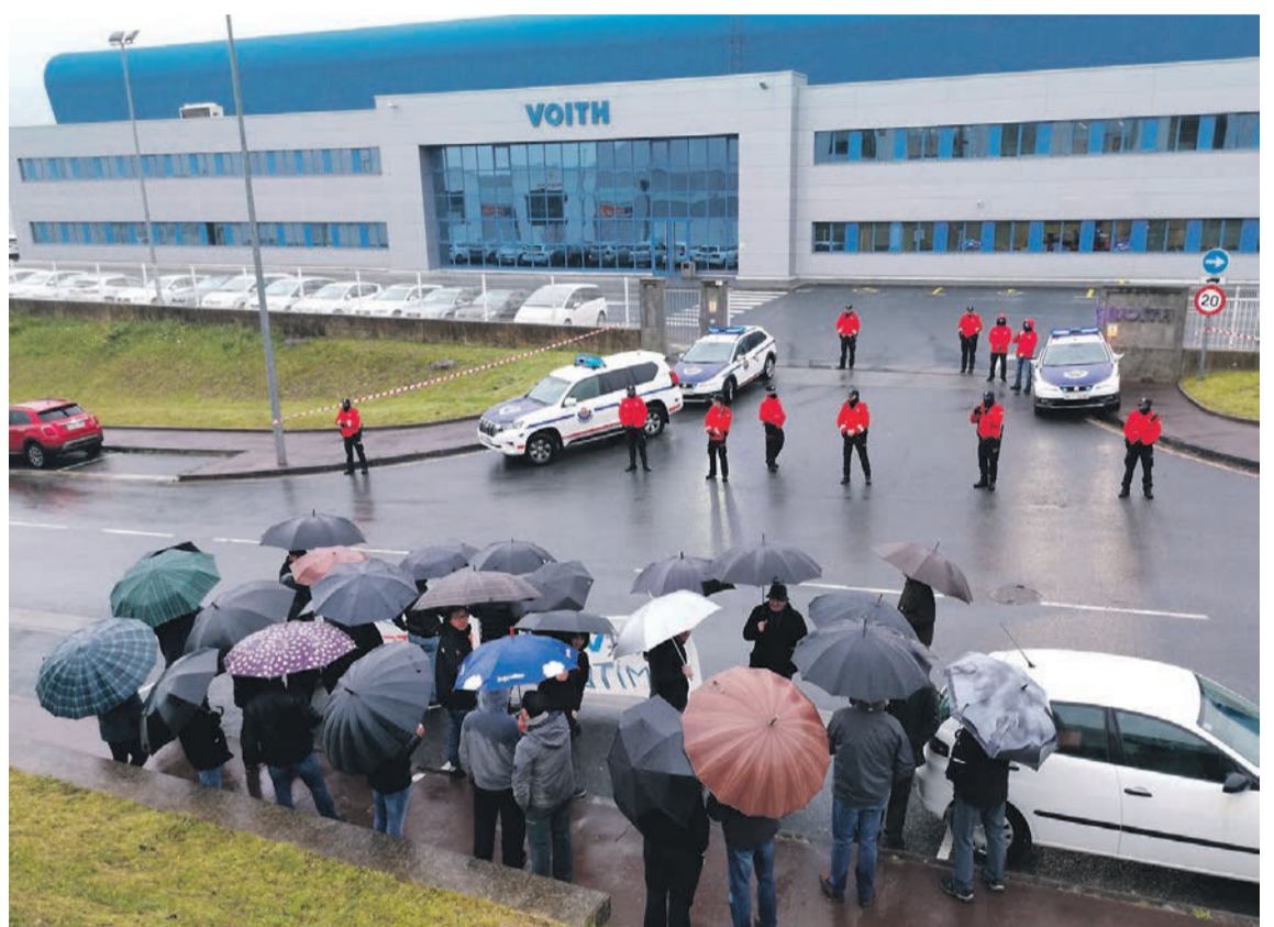
Ertzaintzaren presentziaren aurrean egin zuten elkarretaratzea Voith-eko langileek. ASIER IMAZ

‘Euskal Eskola Publikoaz harro!’ lelopean martxan jarri den kanpainarekin bat egin dute ikasle, guraso eta irakasleek // 5