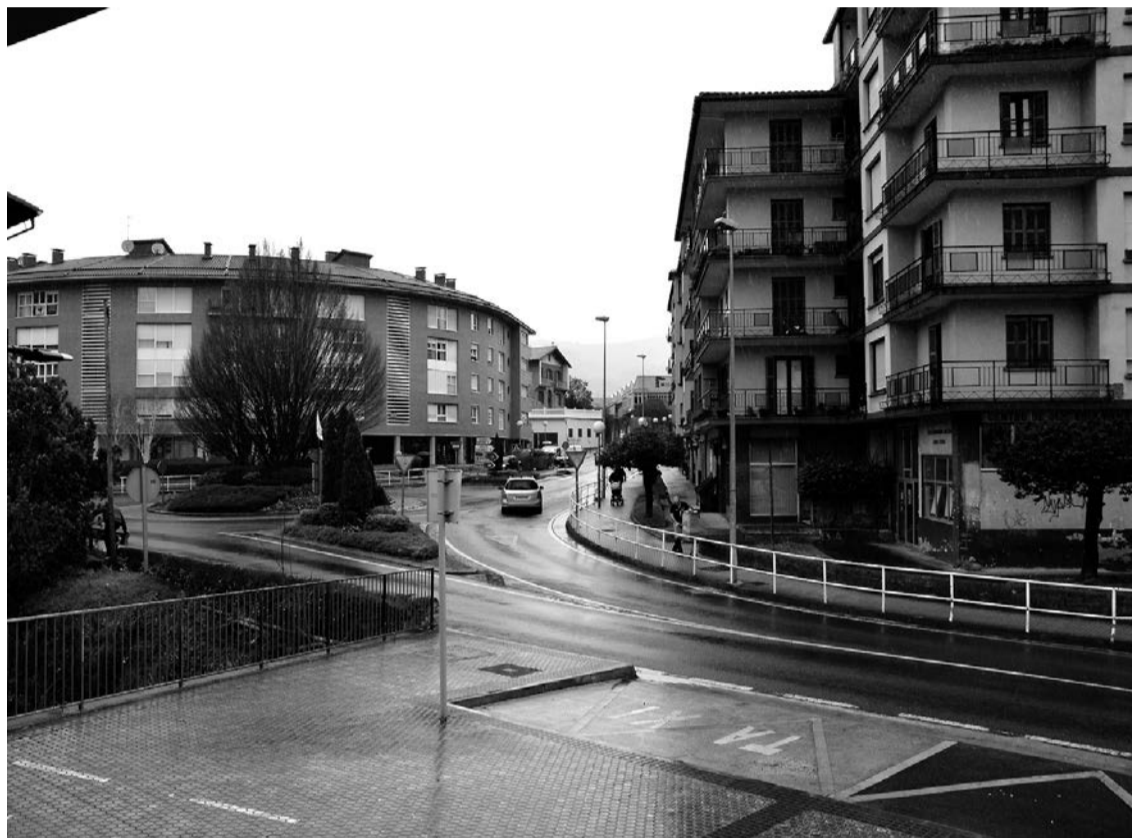
Joxe Arregi plaza paretik biribilguneko zebrabidera bitarteko gunean egingo dituzte lehen egokitzapen lanak. IRATI SAIZAR.

Otsailaren 10ean onartu zuen Zizurkilgo Udalak 2020ko aurrekontua, 3.372.370 eurokoa, EH Bildu, EAJ eta PSE-EEren aldeko