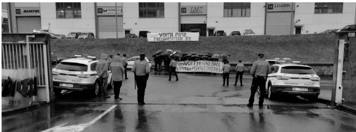
Grebalariaiek enpresaren atarian, atzo goizean, polizia parean dutela. A. IMAZ

Voith Paper SA enpresako langileek sei greba egun deitu zituzten, eta atzo egin zuten lehena; bihar bilera egiteko deia jaso dute langileek, zuzendaritzaren aldetik