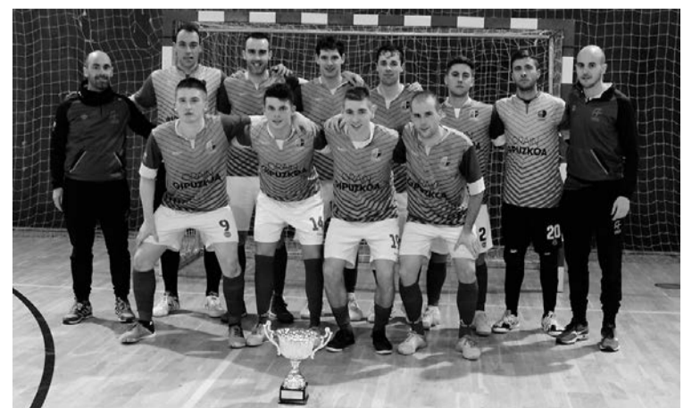
Lauburu KE Ibarra taldea, Gipuzkoako Koparekin. ATARIA

talde bat iritsi zen finalerdietara: Laskorain. Hauek, ordea, ezin izan zuten ezer egin, gerora txa-