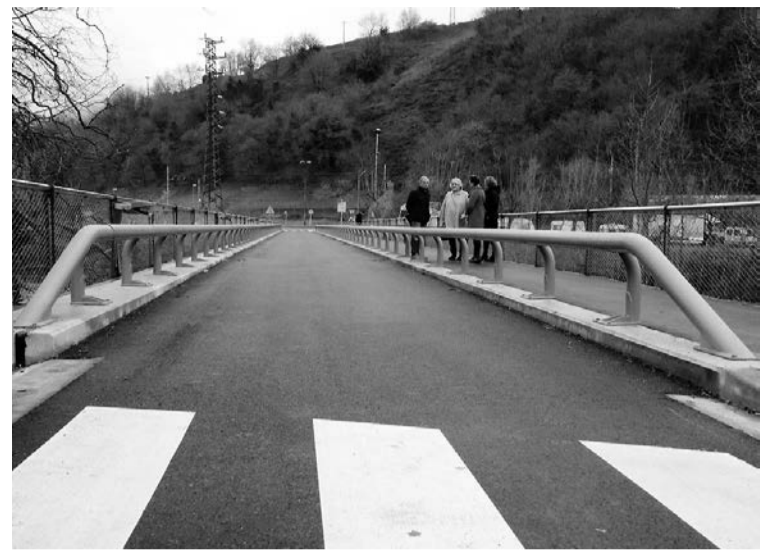
Abenduaren 20an zabaltzeko zuten maiatzetik itxita egon den zubia.

ZIZURKIL // Aurreko urteetan bezala, aparkaleku txartelaren tasa 40 eurokoa izango da. Tasa udal bulegoetan ordaindu ahal izango da, edo, bestela, Zizurkilgo Udalaren kontu-korrenteetako batean. Txartel berriak aurrekoa ordezkatu beharko du, eta ibilgailuan itsatsi beharko da urtarrilaren 31 baino lehen.