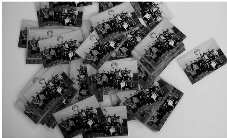
Alegiako Mendi Asanbladak egutegiak berrikuntzekin atera ditu. ATARIA

Kontu korronte zenbakia emanda duten bazkideen kasuan, lehenengo kuota urtarrilaren 15aren eta 18aren artean kargatuko zaie, helbideratuta duten kontu zenbakian. Bazkideetza urte osorako izango da, eta prezio publikoen ordenantza arautzailean jasotako tarifa aplikatuko dela ohartarazi dute. Bigarren kuota, urtean zehar kobratuko