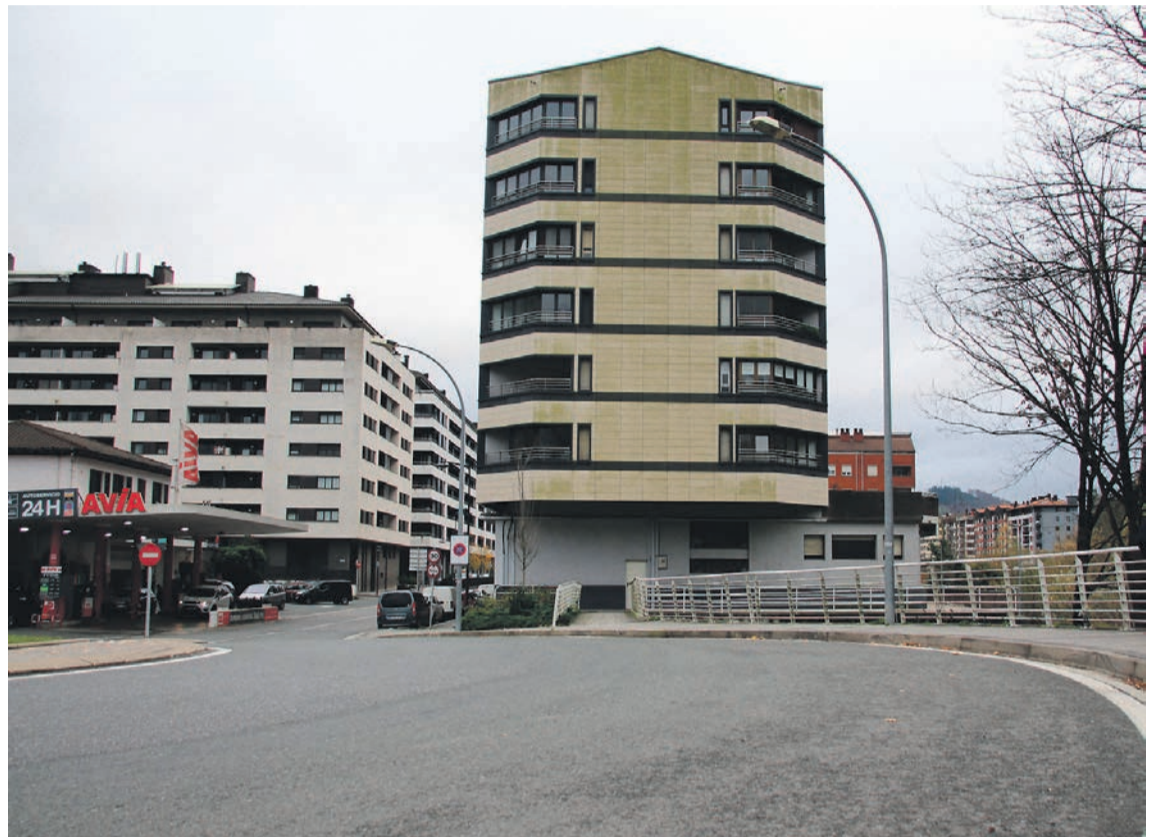
Badira aste batzuk, Tolosako Arriaran gasolindegiko langileak protestan hasi zirenetik. ITZEA URKIZU

Dena den, abiapuntua soldata igoeraren eskaria izanagatik, Arriaran gasolindegiko langileek helburu zehatz bat jarri diote, hasi berria duten borrokari: enpresako itun propioa lortzea. Momentuz, bi bilera egin dituzte gasolindegiko enpresaburuekin, eta haiek ez diete enpresa hitzarmena sortzeko aukera onartu: «Bigarren bileran beren proposamena jarri ziguten mahai gainean, ustez baldintzak hobetze-