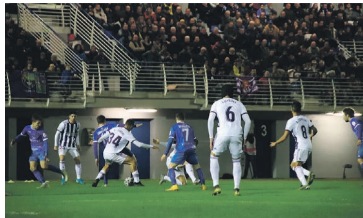
Ikusmina sortu zuen Tolosa CF eta Valladolid arteko partidak. I.G.L.