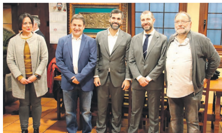
Bi taldeetako ordezkariak eta gonbidatuak, lurre elkartearen. I.G.L.