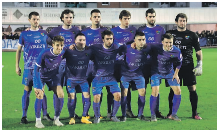
Partida hasi zuten Tolosa CF-ko taldekideak. I.G.L.

Atzoko partidaren aurretik, bi taldeetako ordezkariak eta hainbat gonbidatu, tartean Tolosa CF-ko lehendakari ohiak, elkartu ziren Iurre elkartearen, solasean aritu eta ondoren elkarrekin partidara joateko.