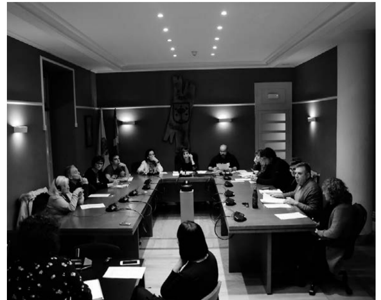
Asteartean egindako osoko bilkuran, udalbatzako kideak botoa ematen.