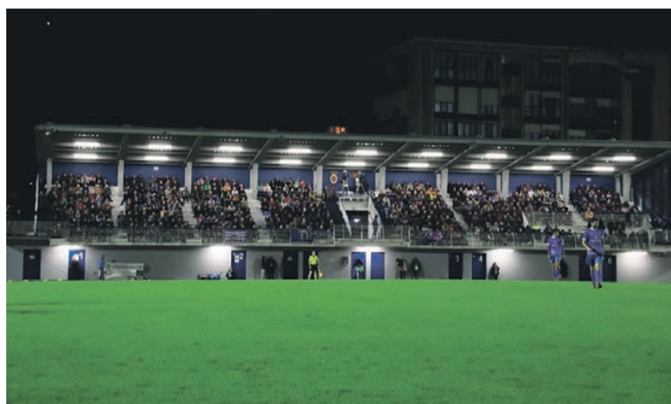
Harmaila nagusia beteta egon zen. I.G.L.