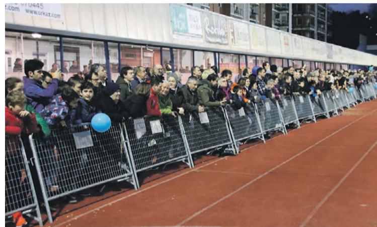
Jende ugari elkartu zen futbol zelaia inguruan. I.G.L.