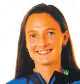
Aulkitik Ainhitze Aranalde Tolosa CF, 1. Maila Nazionala

Golge gogorra izan zen, azken asteotan ondo entrenatzen aritu gara eta emaitzak ekarri dizkigu, baina, hala ere, ez dugu lehen buelta jaitziera postuetatik kanpo bukatzea lortu. Orain ia hilabete dugu ligako hurrengo partidarako, gogor lan egingo dugu bigarren buelta honetan egurra emateko. Eutsi neskak!