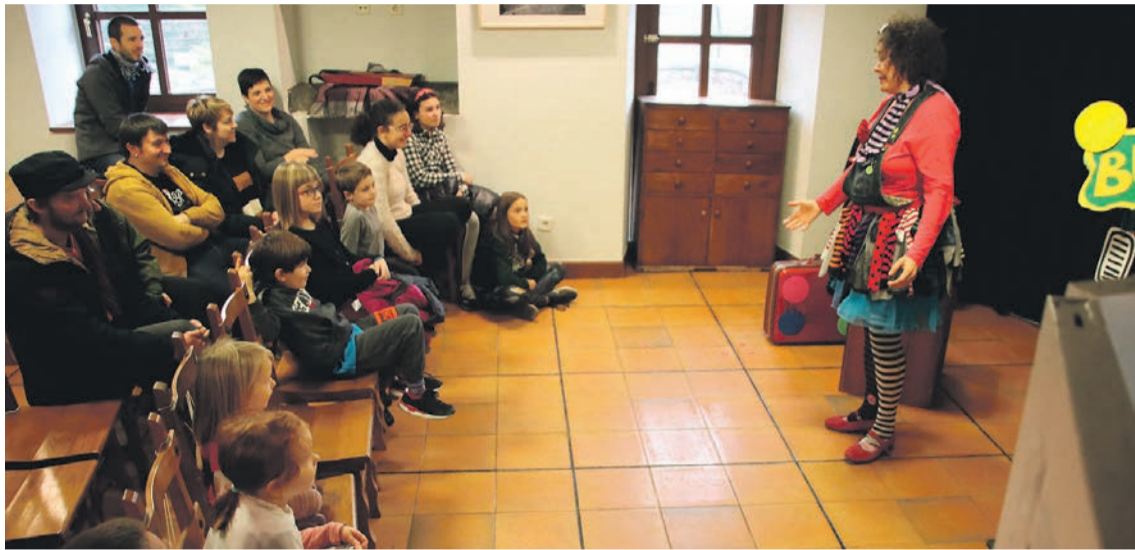
Sortutako hitzak nahiz lehen herrian entzuten zirenak bildu zituzten, Belauntzan, antzerkiaren aurretik. JOSU ARTUTXA

Euskararen Egunkak herrietara ekitaldi ezberdinak ekarri ditu, eta Belauntzan eta Ikaztegiatan, hitz eta pitz, hitzekin jolastu dute; Bidania-Goiatzen, besteak beste, kantuan alaitu dute herria