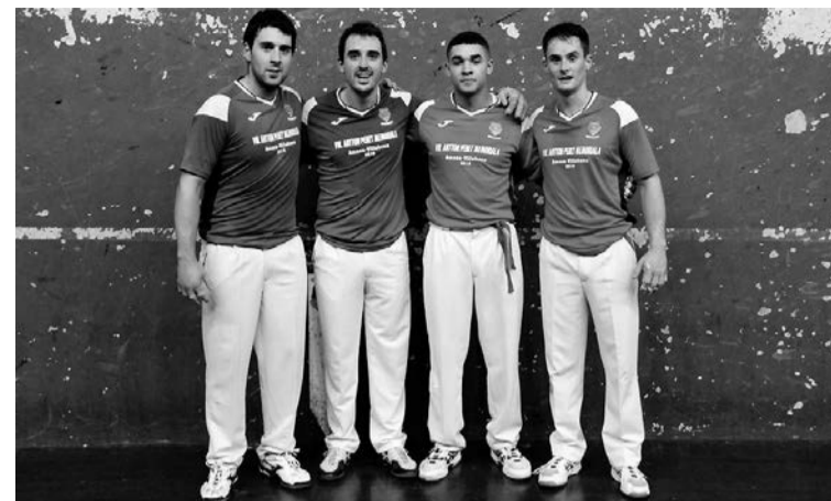
Urruzola, Azketa, Arbizu eta Labaka.

den Ski Tourra, Lenzerheiden (Suitza) eta Toblach-Dobiacon eta Val de Fiemmen (Italia).