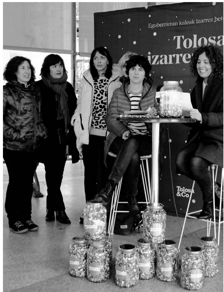
Gaur bertan hasiko dira gozokiak banatzen. I. URKIZU

Buruhandi eta erraldoiak benetako neurrian egingo dituzte ikastaroko lehen egunean, eta erraldoien dantza ikasiko dute bigarren saioan. Azkenik, erral-