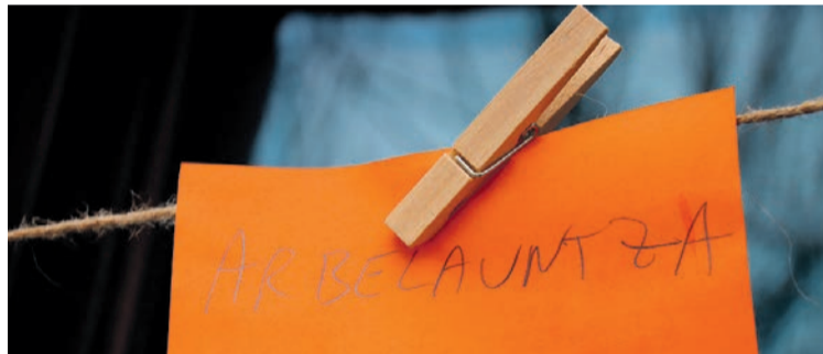
Hitzolariak ekimenarekin bat egin zuten, Belauntzan. J. ARTUTXA

Kantu Bira ospatu zuten, berriz, ostiralean Bidania-Goiatzen. Herritarrak Euskararen Astearen barruko ekimenean, herria euskal kantuz girotu eta alaitu zuten. Ostegun iluntzean, afari-meriendaren bueltan elkartu ziren ikaztegiatarrak Herriagintza elkartearen. Lehenik eta behin, hitz zaharrak edota herrian erabiltzen direnak bildu zituzten, berriak sortzen saiatuz. Behin hitzak zintzilikatuta, mahaiaren bueltan elkartu ziren, hitz eta pitz, jan-edanari ekiteko.