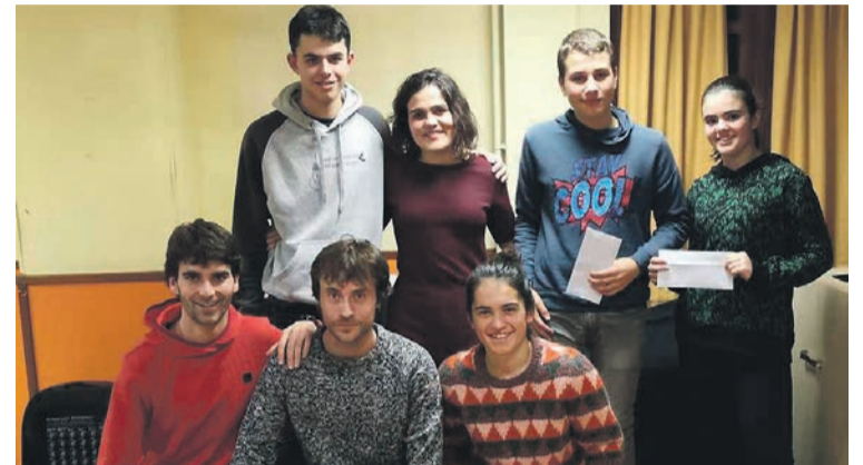
Aurtengo bertso paper lehiaketako saridunak. ATARIA

Epaimahaiak jasotako lanen «kalitatea» azpimarratu du, «bereziki, gaztetxo eta gazteen mailan»