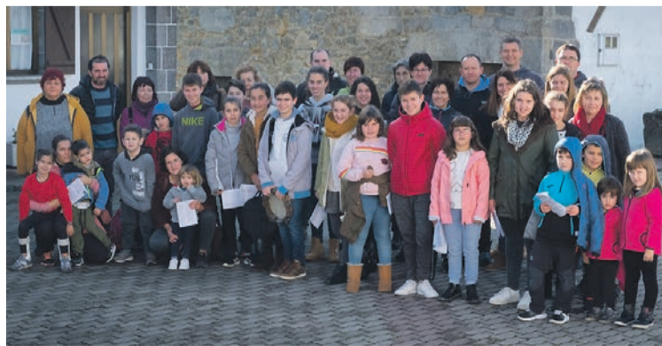
Kantu bira egin zuten, eztrariak berotuz eta herria girotuz. ATARIA