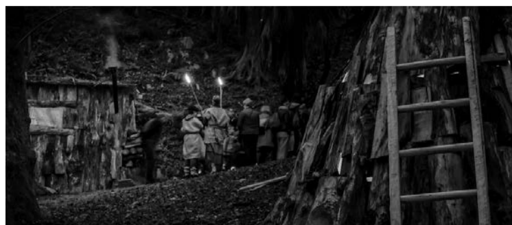
Datorren astelehenean hasiko dira Olentzaroren Basoko bisitak. ZUMARDIA

Olentzero bera goratu beharrean, naturari berari egin nahi diote gorazarre eta, horrekin,