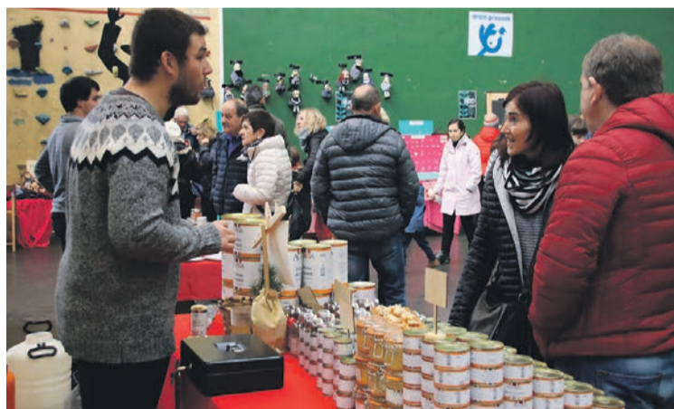
Adin guztietako herritarren gustuko produktuak bildu zituzten azokan. J. ARTUTXA