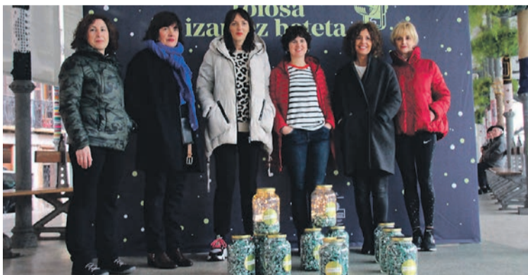
Atzo egin zuen Tolosa&Co elkarteak kanpainaren aurkezpena. ITZEA URKIZU

Ekitaldi ugari izango dira Gabonetan, erraldoien tailerra eta kontzertuak, kasu; Zumardia elkarteak antolatutako Olentzaroren Basoak abenduaren 16an irekiko ditu ateak // 3