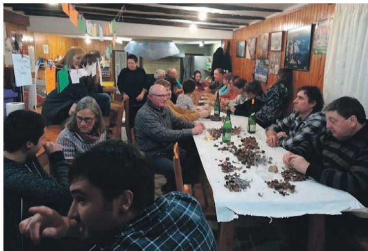
Hitz mordoak bildu zituzten ikaztegiatan, eta jarraian mahaian eseri ziren.