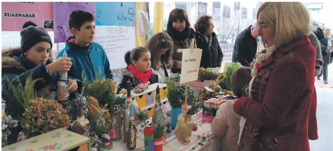
Postu ugari eta estilo askotakoak izan ziren eguraldi txarra dela eta, frontoian. J. ARTUTXA

Olentzerotan Jakin-Minez ekitaldiei hasiera indartsua eman diete, Alzonen; frontoia bete postuk jende asko bertaratu du azokara