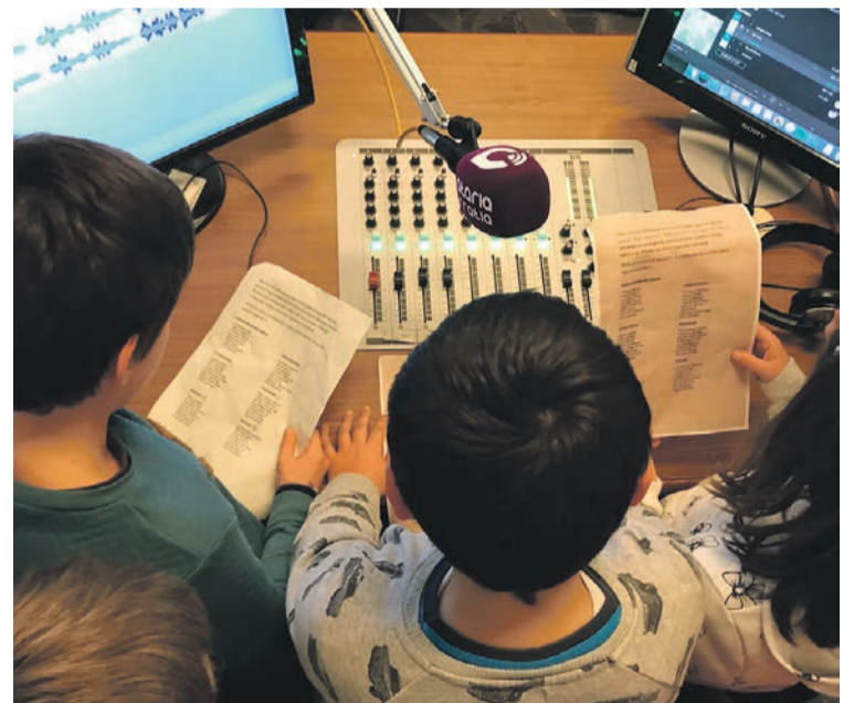
‘Ataria irratian’ gaztetxoak saioak grabatzen. ATARIA

Hain juxtu, egunerokotasunarekin lotutako edukiekin hasiko da Pasahitza magazina astelehenetik ostiralera, 09:00etatik aurrera. Goizeko lehen ordu horretan helduen eta gazteen solasaldiak eta solasaldi politikoak hartuko du lekukoa ostegunetan eta ostiraletan. 11:00ak bitarteko gainerako tarreak askotariko gaiekin osatuko dira. Astelehenetan, esaterako Postalak tarreakin munduan zehar bidaiatzen jarraituko dugu eskualdeko lagun bidaiarien laguntzarekin; astearteetan, arkeologia, komunikazio ez bortitza, telesailak eta zinema edota Tolosaldeko pertsonaiak jorratuko ditugu; asteazkenetan eskualdeko garapen agentziari eskainiko diogu tartea; ostegunetan, literatura jorratuko dugu Letren errepublika -n eta lehen sektorea Baserri -tik ataletan; eta, ostiraletan, kimika, azken ostirala, psikopedagogia, ekonomia edota erreze-