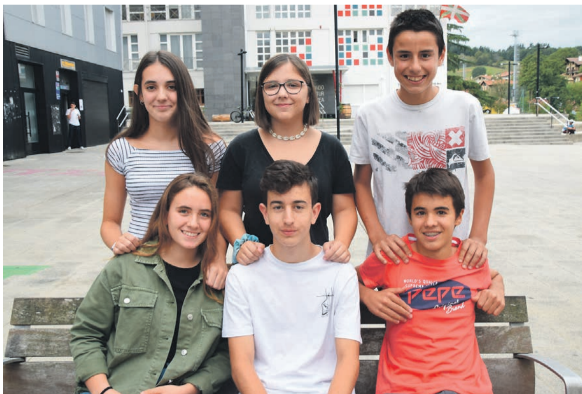
Egonaldietan parte hartuko dute Zizurkilgo zortzi gaztek; argazkian horietako sei. J.M.

943 67 47 33 kondeko@elduaien.com www.elduaien.com