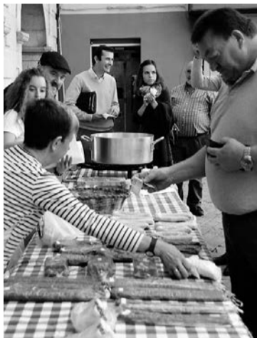
Jatekorik ez da faltako. J. ARTUTXA

Ohi bezala, askotarikoak izango dira postuak: barazkiak, fruituak, etxean egindako hainbat elikagai, bitxiak... Azokan zerbait erosten dutenek txartel batzuk jasoko dituzte zozketan par-