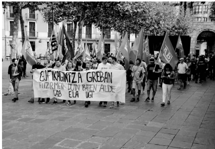
Trianguloan elkartu ziren langileak, manifestazioari ekin aurretik. J. ARTUTXA

Egun, sektoreak bizi duen egoera «ona» dela diote. «Enpresetako lan karga handia da, eta ondorioz, ulertezina eta onartezina egiten zaigu ADEGIren jarrera. Proposamena hobetzeko tartea handia da. Hala ere, soldata igoe-