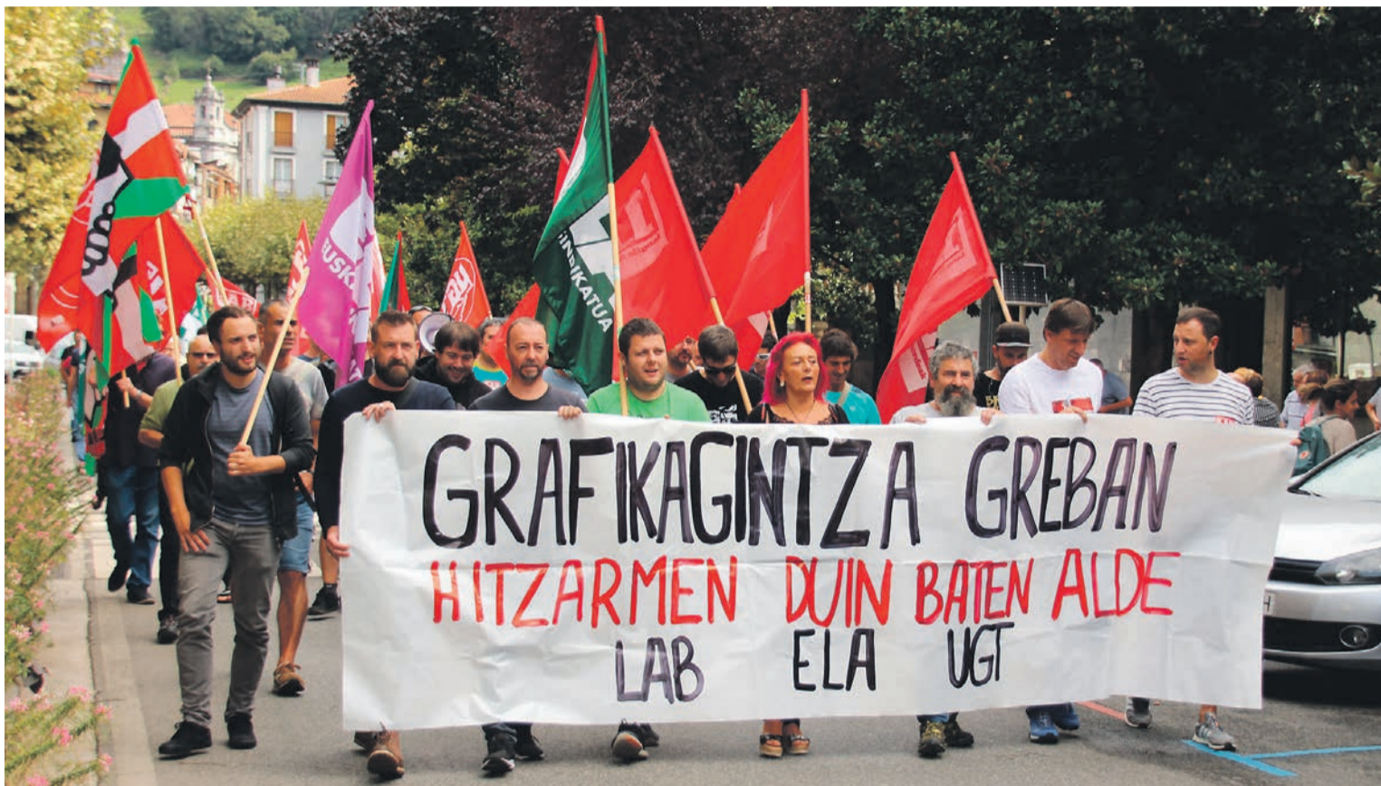
Manifestazioa egin zuten atzo eguerdian Tolosan grafikagintzako langileek.