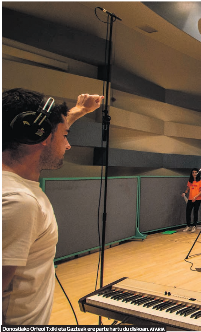
Donostiako Orfeoi Txikia eta Gazteak ere parte hartu du diskoan. ATARIA