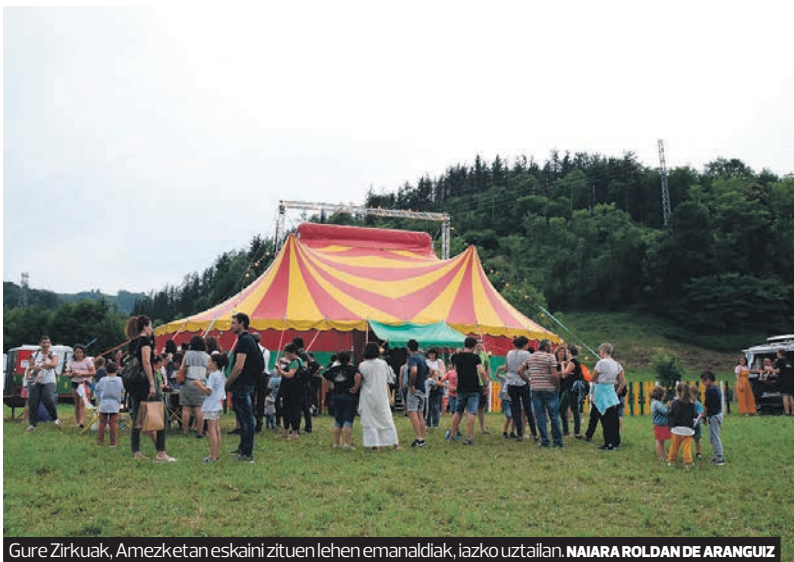
Gure Zirkuak, Amezketan eskaini zituen lehen emanaldiak, iazko uztaian. NAIARA ROLDAN DE ARANGUIZ

Trapezistek, magoak, malabaristak, musikariek, dantzariak eta akrobatek osatzen dute taldea. Astebururo sei bat emanaldi eskaintzen dituzte; ostegunean hasi eta asteburu osoan luzatzen dira. Hala ere, emanaldietan ez ezik, muntaia lanetan ere aritzen direla azpimarratu du Galartzak, lan horiek beste batzuek egiten dituztela uste baitu jende askok. «Jendea harritu egiten da artistak lan ezberdinetan aritzen direla ikustean. Guk, gainera, lanak banatzen ikasi dugu». Ondorioz, auzolanean sortutako egitasmoa izan dela dio. «Askotan esan izan dut: farandula eta brikolaje mundua gustuko duenak, hauxe du leku aproposena».