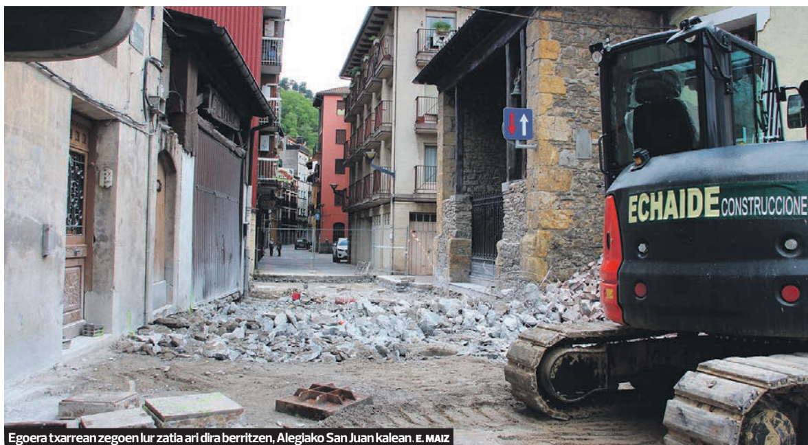
Egoera txarrean zegoen lur zatia ari dira berritzen, Alegiako San Juan kalean. E. MAIZ