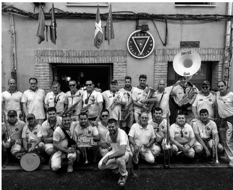
Familia argazkia atera zuten sanferminetan. ATARIA