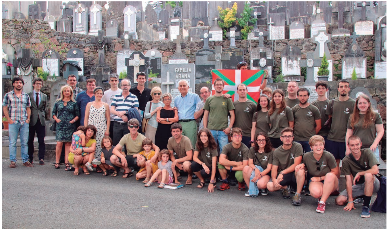
Talde argazkia atera zuten, Polloeko hilerrian, Aranaren senideek, ordezkari politikoek, Aranzadiko kideek eta auzolandegietako kideek. JON MIRANDA

Denboraldi bikaina biribildu du altzotarrak, mendi lasterketetan, hiru garaipen eta hainbat podium eskuratuta; atseden hartu nahi du orain, eta «presiorik gabe» ekingo dio datorren denboraldiari // 05