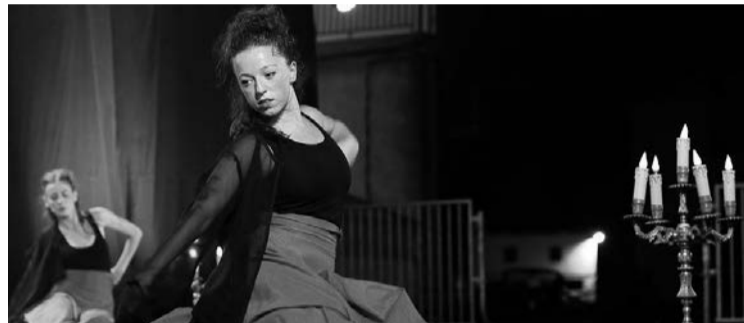
'Irradak' eskainiko dute, Olaztin, uztailearen 27an.