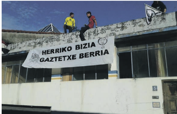
Fabrika hutsa okupatu berritan, pankartak jarri zituzten eraikinean. ATARIA

Duela urtebete jarri zuten Tolosako Gazte Asanblada martxan, Gazte Eguna antolatuz. Asanblada osatzen joateko denbora bat hartu ostean, gaztetxe baten beharra ikusi zuten eta horregatik erabaki zuten uztaileko okupazioa egitea. «Tolosako gazteon errealitatea aldatzen jarraitzeko indarrez jarraitu genuen gaztetxea ez lortu arren eta horren isla izan zen Gazteburua», azaldu dute asanbladatik. «Egun arrakastatsu hori igarota berriro ere gure artean biltzen hasi ginen gazteok jasaten