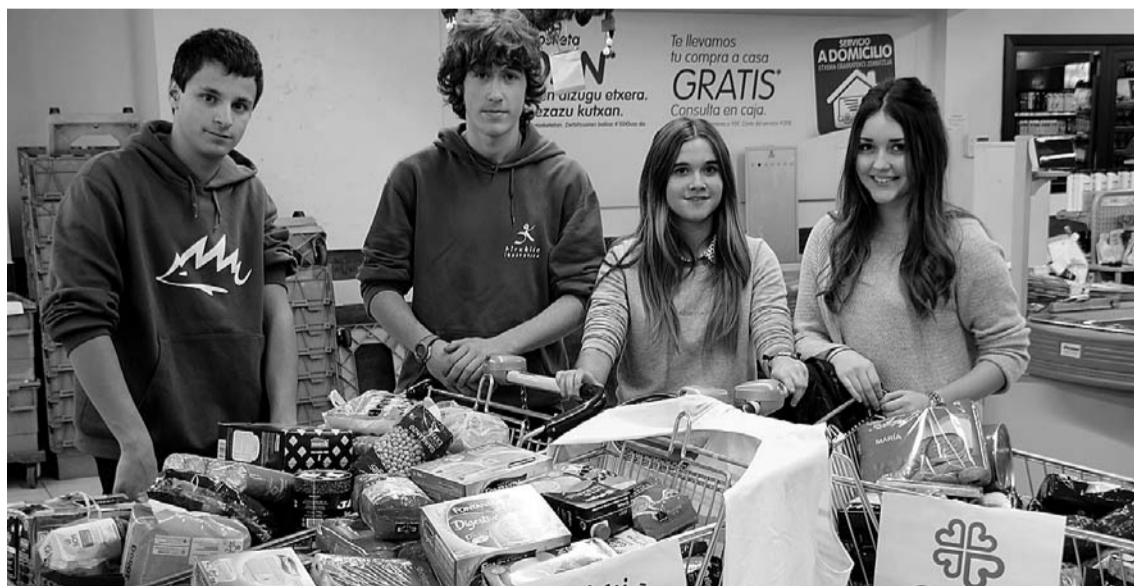
Hirukideko ikasleek larunbatean egin zuten bilketa Tolosako hainbat supermerkatuetan. M. IRAOLA

Urtero elkarlanean egin ohi duten Eguberri Kanpaina solidarioaren barruan kokatzen da janari bilketa hori. Makarroiak, kontserbak, lekale poteak, turroiak, polboroiak, txoko-