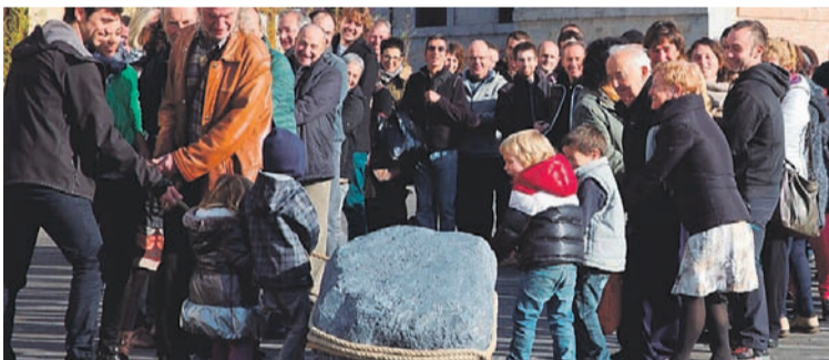
Mugi daitezten harriak kanpainarako erabili duten argazkia Tolosan. ATARIA

Urtezahar egunean preso eta iheslarien ekimen gehiago burutuko dira gure eskualdean. Besteak beste, 19:00etan Ibararako sarreratik autokarabana abiatuko da. Aiztondoko herriek elkarrekin Zizurkil eta Villabona artean manifestazioa egingo dute eta Altzon, 20:00etan plazan elkarretaratzea egingo dute.