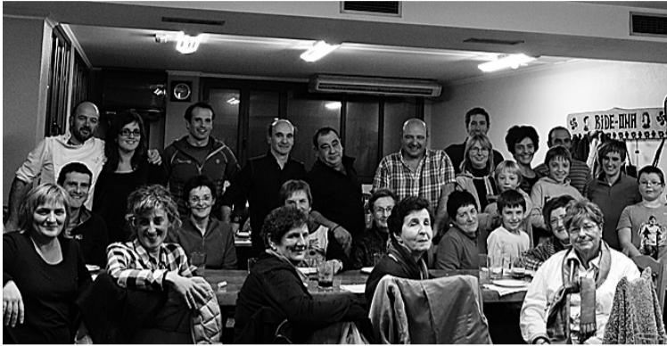
Sukaldaritza goxoa tailerrak arrakasta handia izan zuen herritarren artean. ATARIA