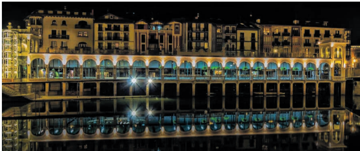
Tolosan eta Aiztondon Oria ibaira bideratuko dira piztutako kriseiluak, erabakitzekeo eskubidearen aldeko mezuekin. ATARIA

Abenduaren 26an eta abenduaren 31n egingo dira ekitaldiak eskualdeko herrietan