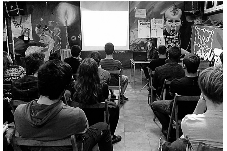
Herritar guztiak Gabon Autogestionatuaren parte hartzerara gonbidatu dituzte.