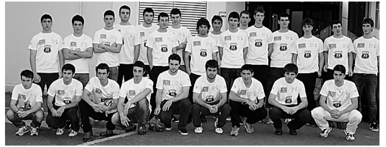
Aurkezpen ekitaldian pilotari ugari elkartu zen Alegian. A. I.

Afizionatuen mailako hiru esku pilota txapelketa jokatu dira asteburuan