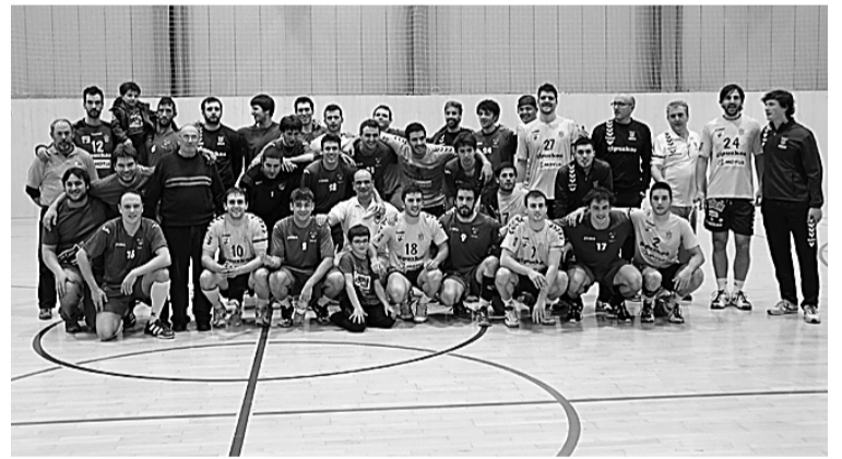
Partidaren amaieran talde bietako jokalariek argazkia atera zuten.

Emaitza gutxienezkoa izan zen Usabal kiroldegian festa itzela bizi izan baitzen. 600 pertsona inguru bildu ziren eta giro bikaina izan zen harmailetan. Zaleek txalo artean agurtu zituzten tolosarrak. Jokalariak eta entrenatzaileak ere gustura azaldu ziren: «Gaur gehienbat disfrutatzera etorri gara, eta disfrutatu dugu. Asobal liga-