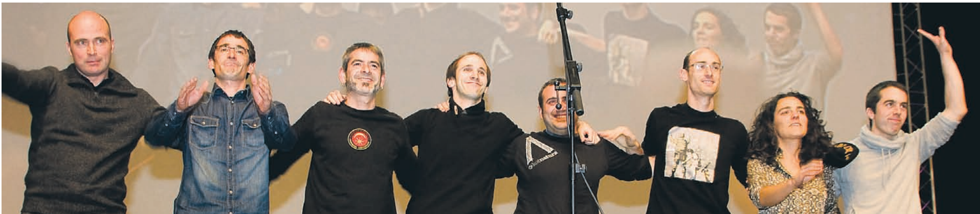
BECeko publikoaren harrera ezin hobea izan zen, eta txaloei txaloak itzuliz eskertu zuten bertsolariek.

Final paregabea osatuta laugarren postua eskuratu zuen Mendiluzek; beren belaunaldiaren finala izan zela dio