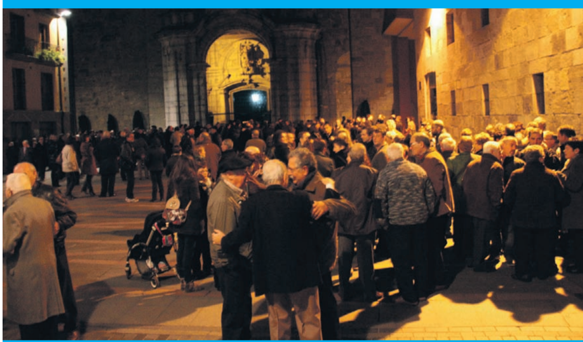
Tolosako Santa Maria parrokia txiki geratu zen Labaienen hileta elizkizunean. I. TERRADILLOS