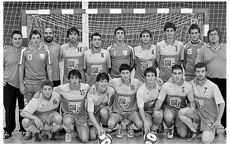
Laskoraingo taldea. ATARIA