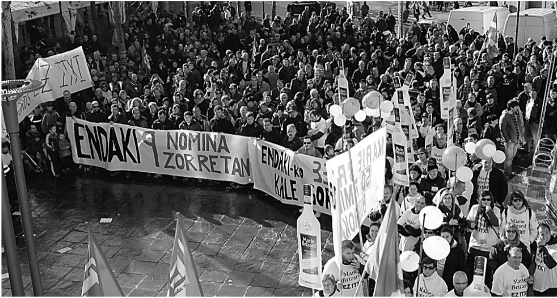
Ehunka lagunek zeharkatu zituzten Tolosako kaleak, lanpostuen defentsan. ASIER IMAZ