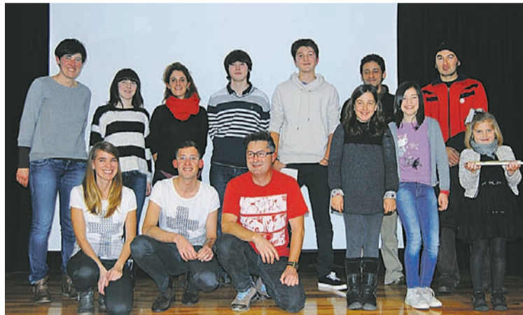
Galtzakomik lehiaketan sarituenak izan direnak. ATARIA