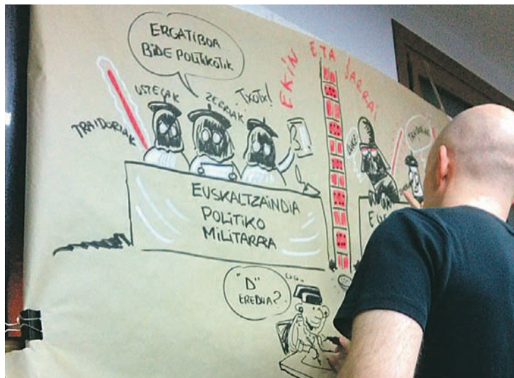
Afari-Txouan komikiak egiten. A. OIARTZABAL