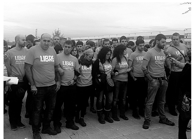
Auzipetuak, Madrilan, atzo.

2009ko azaroaren 24ko sarekadan atxilotu zituzten auzipetu gehienak, eta seina urteko espetxera zigortzeko eskatu du fiskalak, 2007an Segi «erakunde terrorista» izendatu zutela eta.