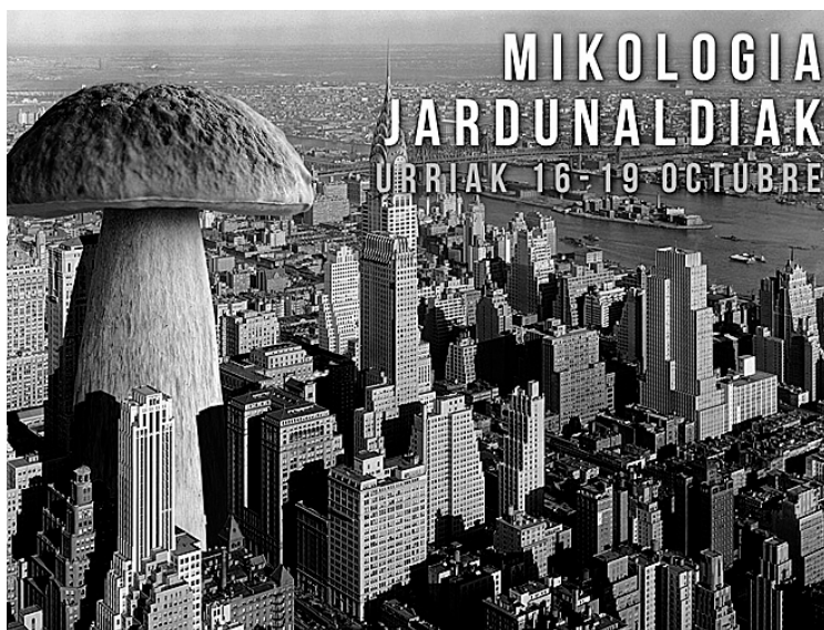
Mikologia Jardunaldiak laugarren urtez jarraian antolatu ditu, Casino elkartek.