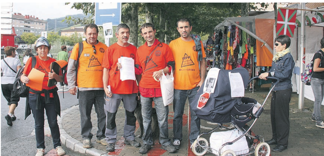
Jendetzaren olatuaren irudiez gain, gune txikietan erromeria eta bestelako musika taldeen eskaintza izan zen. Ibilbideari garrantzia eman nahian, txarangei jarraituz askok osatu zuten zirkuitua. Trenez 20.000 lagun inguru etorri ziren ikastolen festara, eta aldarrikapenerako gune ere bilakatu zen Kilometroak, IRPHren aurkakoena kasu. I. URKIZU / M. IRAOLA / A. OIARTZABAL