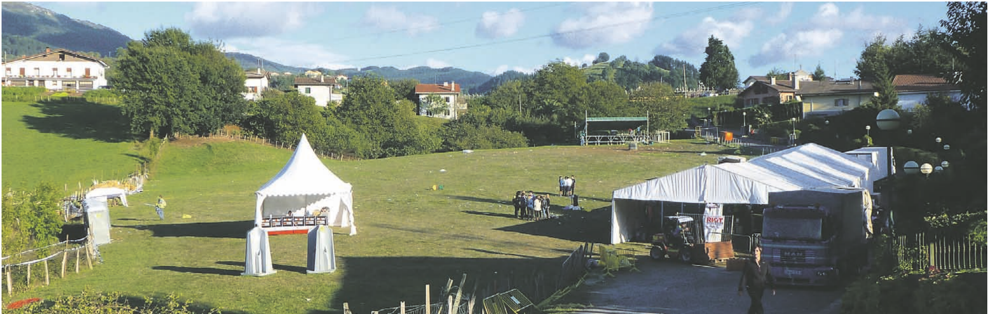
Garbiketa batzordea aritu zen guneetako hondakinak biltzen, eta baita Laskoraingo ikasleak ere. ATARIA