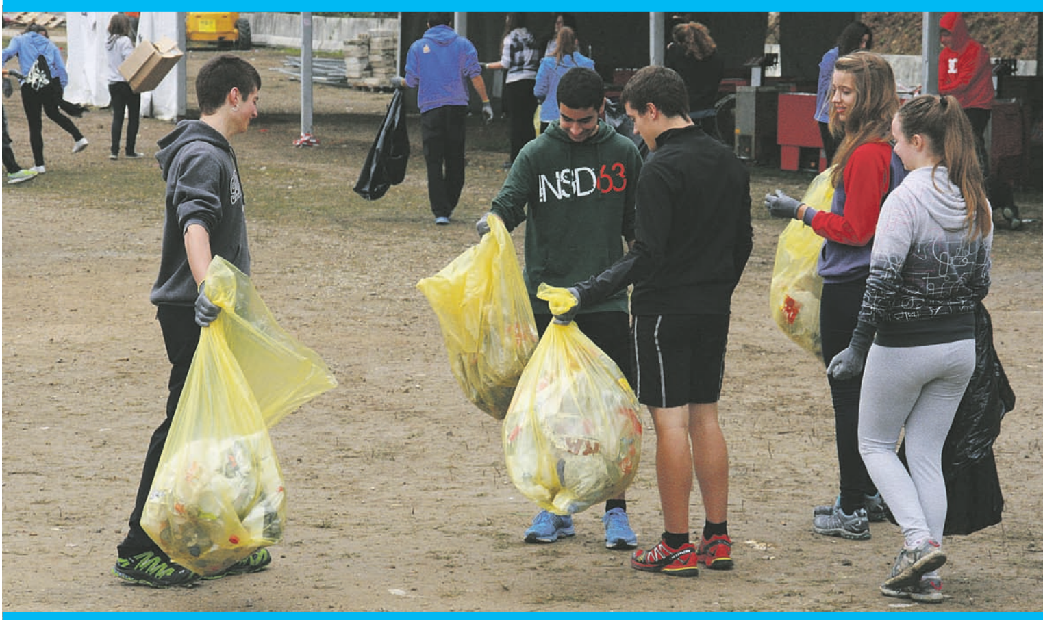
Atzo goizean garbitu zituzten Kilometroen ibilbideko gune guztiak Laskorain Ikastolako ikasle eta irakasleek elkarlanean.

Asteartea, 2013ko urriaren 8a. 1. urtea. 3. zenbakia. www.ataria.info