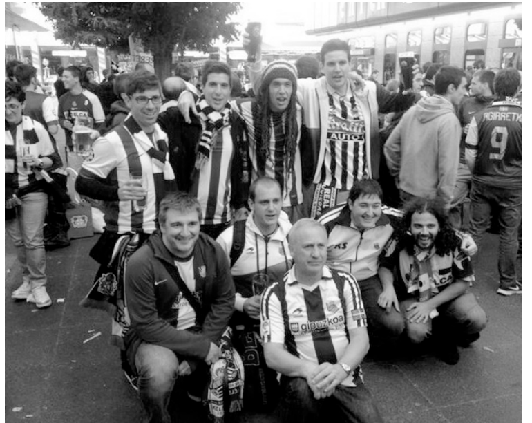
Billabonatar taldea, Alemanian. ATARIA

Europako beste hainbat herritan bezela, zaila egiten da horrelako egunetan, hain gurea den poteatzeko ohitura ez mantentzea. Taberna pare bat aurkitu eta han elkartzen joan ziren errealek gehienak. Taberna batean denbora dezente eman genuen eta bertan zegoen jende mordoarekin, edalontziak altxor bilakatu ziren: edalontziarekin joan behar tabernara, han zerbeza edo kalimotxo bat nahi izanez gero. Ongi irakurri duzue bai, kalimotxo zer den ere ikasi zuten, ondo, taber-