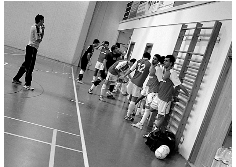
Lauburuko futbolariak, beroketa ariketak egiten, partida hasi aurretik. ATARIA

patzen ari ziren festan parte hartu, baina, kilometroei keinua eginez, Ahora! banderarekin eta ikurrinarekin helmugaratu zen.