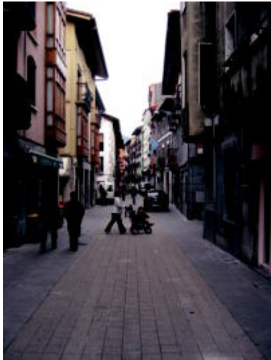
Kale Nagusia zeharkatuko du bidegorriak, eta zati hori mistoa izango da. 16.

Hirugarren zatia, Gaztelekutik hasi eta Errota auzoa zeharkatuz, Arroa auzoraino doana da. Lehen