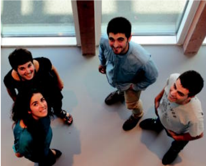
Haztegiatako lehen enpresa egitasmoak egiten ari diren lau ekintzaileak. ITZEA URKIZU

Ostirala, 2013ko irailaren 13a. IX. urtea. 2.643. zenbakia. tolosaldea.hitza.info