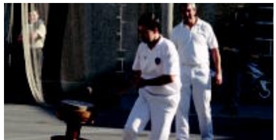
Errebotearen inguruko argazkiak bidali beharko dira. LURRUTIA

Lehiaketan parte hartu nahi dutenek, beharzana@gmail.com helbidera euren datuak bidali beharko dituzte. Beharrezko datu horiek, izen-abizenak, nortasun agiria eta telefono zenbakia dira. Ondoren, lehiaketako oina-