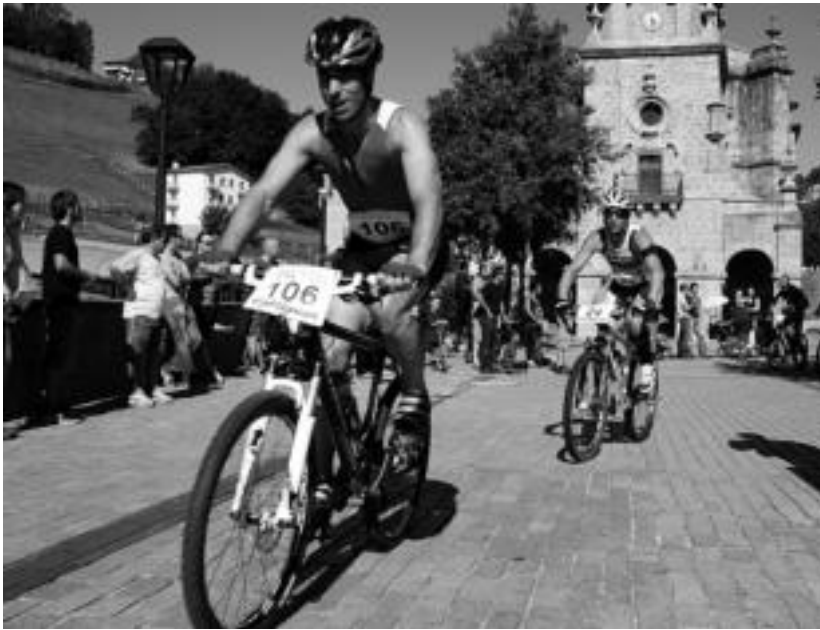
Pasa den urteko duatloi probako une bat, Ibarrako plazan. I.T.