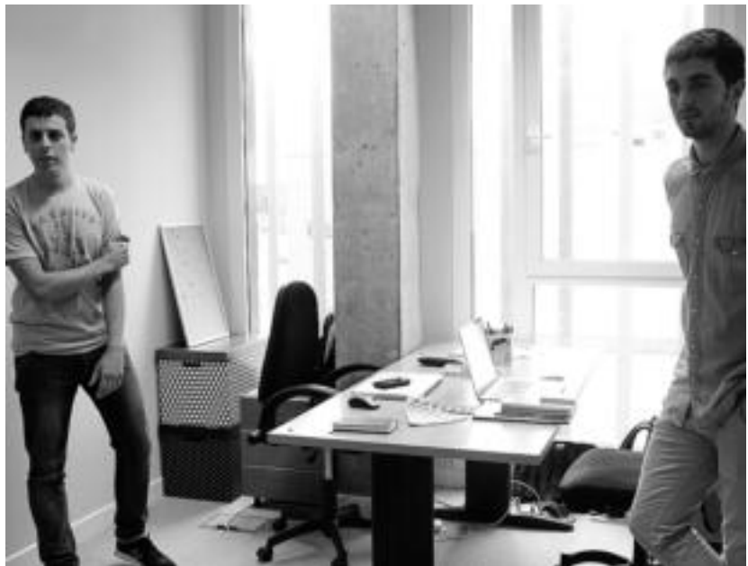
Bulegoetan oinarritzko hornidura eskaintzen die ekintzaileei, Lehiberri zentroak. | URKIZU

Horren harira, haztegiak badiutuzte zenbait helburu zehatz: enpresa berriak sortu eta finkatzea nahi dute, batetik, eta horrekin batera lanpostu berriak sortzea; azpiegitura fisikoa eskaintzea, gainera, enpresaren leihakortasun aukera handiagotzea da jomuga