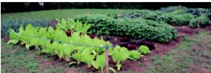
Tolosako Iurreamendiko baratzeak barazki ederrez beteta daude. HITZA

Bi hilabete bete dira Iurreamendin baratzeak martxan jarri zirenetik; erabiltzaileak nahiz sustatzaileak gustura daude egitasmoarekin ◯2