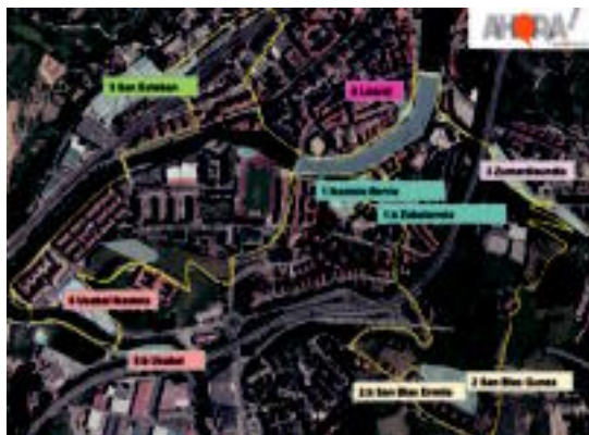
Urriaren 6an, Kilometroak 13k izango duen ibilbidea. HITZA

Kultur eskaintzaz gain, aukera gastronomikoa ere «ikaragarria» izango dela adierazi dute. Bi jantoki handik, zirkuituan zeharreko label produktuen aukerak, eta ohiko ogitarteko eta mokaduen eskaintzak osatuko dute. Honekin guztiarekin, denen gustuak asetu eta denen gogoia asetuko