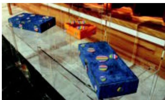
Askotariko lanak egin dituzte, kolore biziekin. I.T.

liebean egin dituzte, kareetak landu dituzte eta collage-ak egiten ikasi dute, besteak beste». Era berean, «koloreekiko edo pinturarekiko duten zaletasuna eta jakin-mina» azpimarratu du.