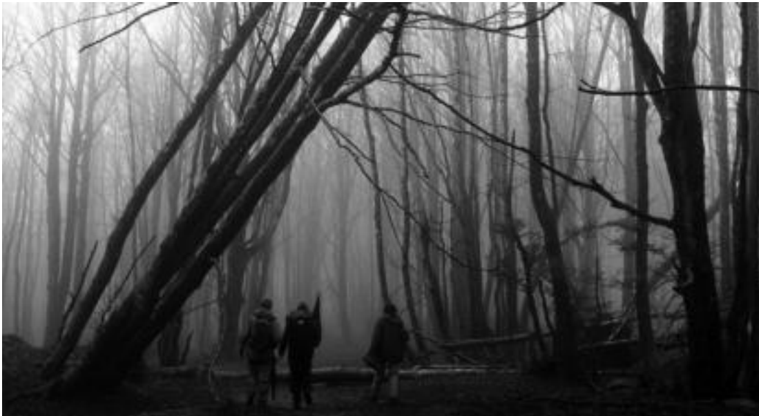
Mendizaleak arduratuta daude motozaleek mendietan egiten dituzten txikizioekin.

Inguruko mendietan modu egokian ibiltzen ez diren motozaleen jarrera salatu dute eskualdeko mendizaleek. Arrazoa, kezagarria da: pixkanaka ingurunea hondatzen ari da.