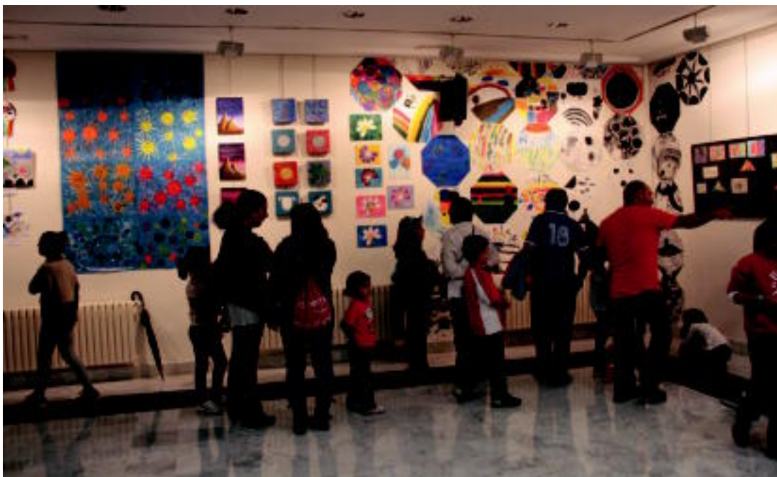
Jende ugari izan zen herenegun egin zen erakusketaren inaugurazioan, Ibarako kultur etxean. I.T.