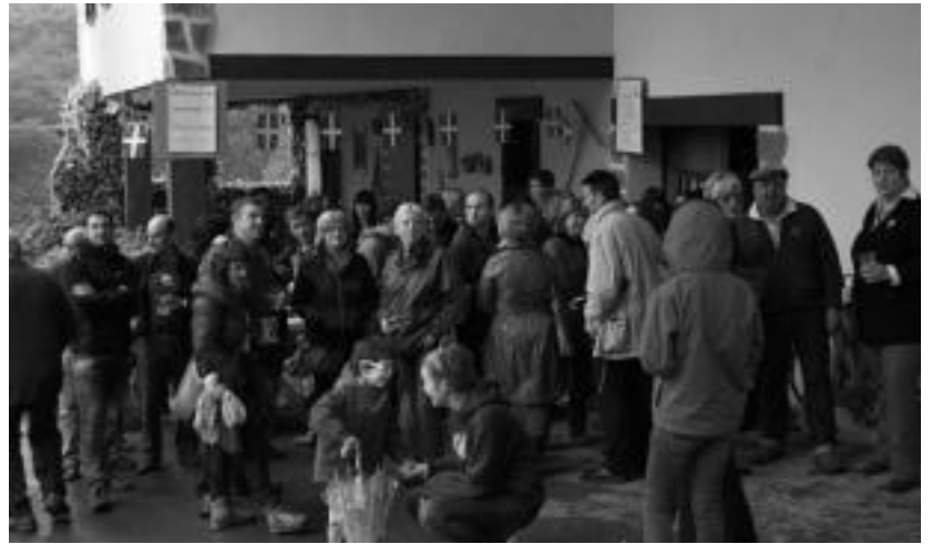
luz, aurtun bezala, Tolosako Ugano auzoan bertsolariek saioa eskaini zuten. INIGO TERRADILLOS

Alegiako Kalebehera auzoan ostiralean hasi eta igandean amaituko dira jaiak. Hiru eguneko egitarauari suziriekin eta buruhandiek emango die hasiera alegiarrek. Ondoren, tortilla txapelketaren txanda izango da, eta eguna amaitzeko, Alegian hain ohikoa den zahagiardoa egingo dute, trikitilarien emanaldiaren aurretik. Aipatu, herri bazkaria jaien azken egunean egingo dute-la, hau da, igandean. Kalebeherako jaien antolatzaileen esanetan, aurtengo menua paella izango da.