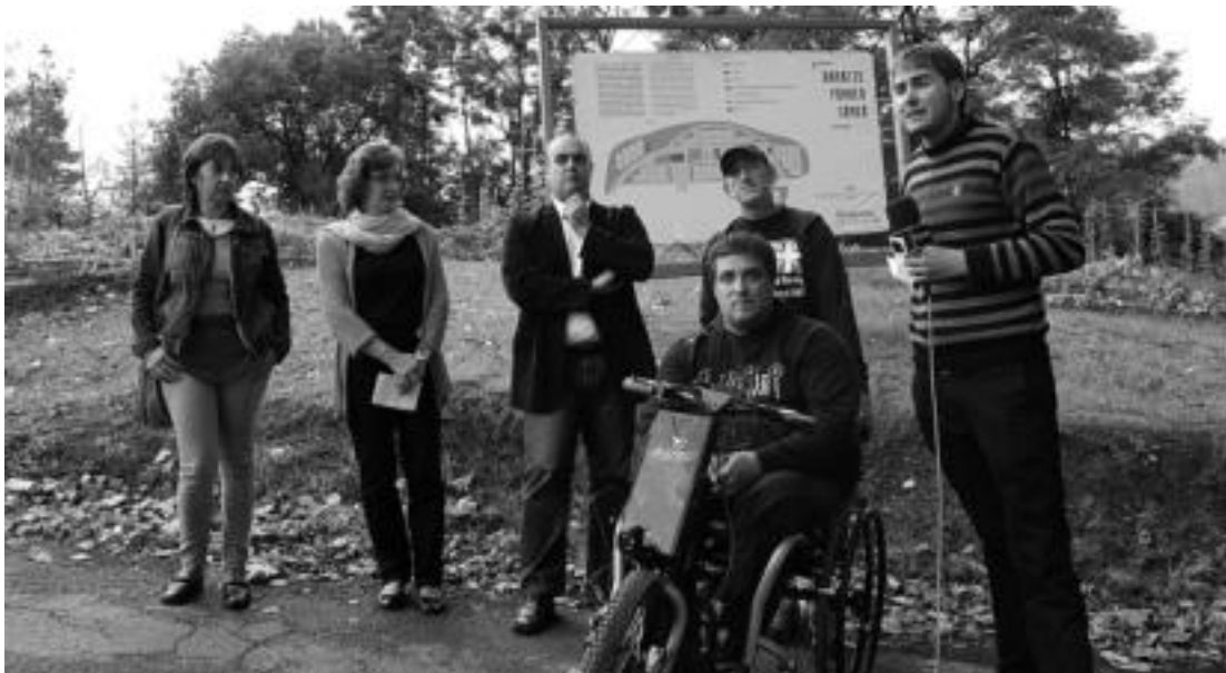
Erabiltzaile nahiz egitasmoa sustatzaile guztiak gustura agertu dira baratzeen funtzionamenduarekin. I. URKIZU

Baratzeak erabiltzen hasi aurreko ikastaroarekin, eta bi hilabetean lurra emandako esperientziarekin, nekazaritza ekologikoak Iurreamendin hartu duen garrantzia ere aipatu nahi izan dute udaleko nahiz Kutxa Ekoguneko arduradunek. Izan ere, «ingurugiroarekiko eta osasunarekiko errespetua baratze hauen helburuetako bat izan da hasieratik». Iurreamendin ereindako produktu guztiak, horrela, garaian garaikoak izango dira, eta Iriartek azaldu duen bezala, «nekazarien lana baloratzeko balioko du honek: baratze batek zenbaterainoko lana dakarren, zer eskaintzen duen, aisirako zein aukera ematen dituen...».