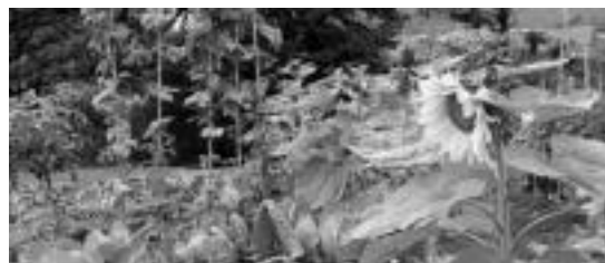
Garaian garaiko produktuak eraitzen dituzte baratzezainek. I. URKIZU

Etxeko lanak. 08:00etatik 14:00etara etxeko lanak egin edota haurrak zaintzeko, esperientzia handia duen emakume euskaldunak bere burua eskaintzen du. Kotxea ere badauka, gainera. Interesa duen edonork dei dezala ondorengo bi telefono zenbakietako batera: 943 69 68 82 edo 606 52 19 92.