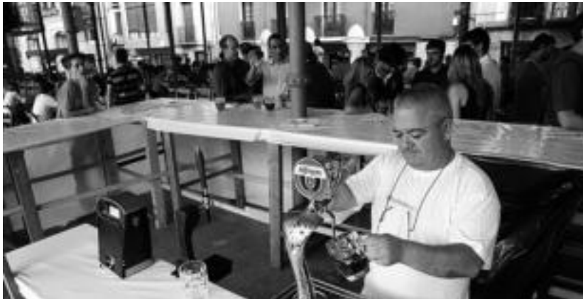
Hamabostgarrenez ospatuko da Garagardo Festa, eta igandera arte luzatuko da. KLUK

Aurtengo berrikuntza nagusia, mahai tresna eta platerak material konpostagarriz eginak claudela izango da