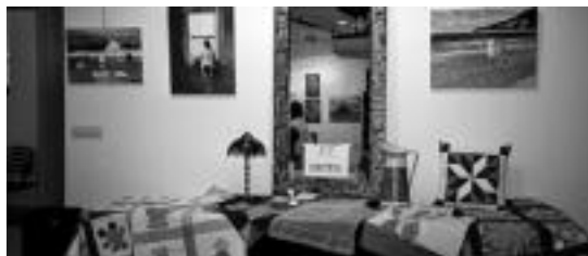
Iragan ikasturteko lantegietan eginiko lanen erakusketa. HITZA

riak, altzariak zaharberritzea eta konpontzea, pintura, eskulanak eta josketa eta arropa konponketa tailerrak egongo dira aukeran. Sabel dantza ostegunetan emango dute, egur taila astearte eta ostegunetan, ehoziari lantegia astearteetan, altzarien zaharberritze eta konpontzea astelehen eta asteazkenetan, pintura astearte eta ostegunetan, eskulan tailerra astelehen eta asteazkenetan eta josketa eta arropa konponketa asteazken eta ostiraletan. Urritik ekainera bitarte emango dituzte kultur lantegiak. Sabel dantza eta ehoziariak 136,78 euroko prezioa dute, eta gainerakoek 170,16 eurokoa. Gazte txartela dutenek %10eko hobaria izango dute prezioen gainean, eta familia ugaria direnek %50ekoa.