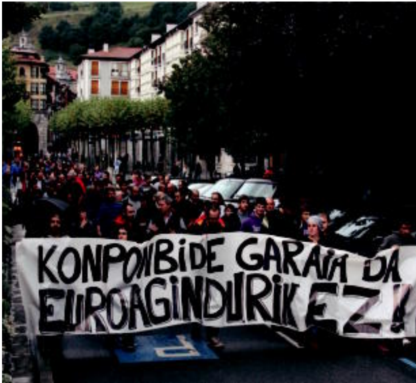
Tolosako Triangulotik hasi eta Ibarra plaza baino bidea egin zuen, atzo, manifestazioak. I. TERRADILLOS

Asteazkena, 2013ko irailaren 11. IX. urtea. 2.641. zenbakia. tolosaldea.hitza.info