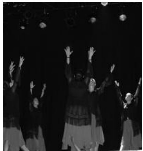
Alurr dantza taldeko kideak Lekeition Soinaz ikuskizunarekin. HITZA