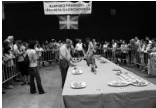
Pasa den urteko lehiaketako une bat. I.T.

Ibarrako Xepla elkarteak antolatzen duen lehiaketa hori Euskal Herri mailakoa da. Datorren astelehena, irailaren 16ra arte eman ahalko da izena, eta antolatzaileek lehenbailehen egitea gomendatu dute, sukaldeak izen emate hurrenkeraren arabera esleituko baitituzte. Antolatzaileek sukaldia, gasa, piper gorriak, piper berdeak, tipulinak eta gainerako osa-