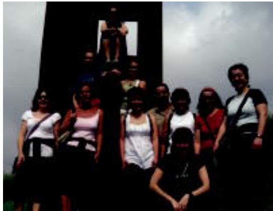
Villabona eta Zizurkilgo pasa den urteko ikasleak txango batean. PHITZA

Euskalduntze maila guztiak eskaintzen ditu AEKk. Lehen, bigarren eta hirugarren mailako hizkuntza eskakizunak prestatzeko