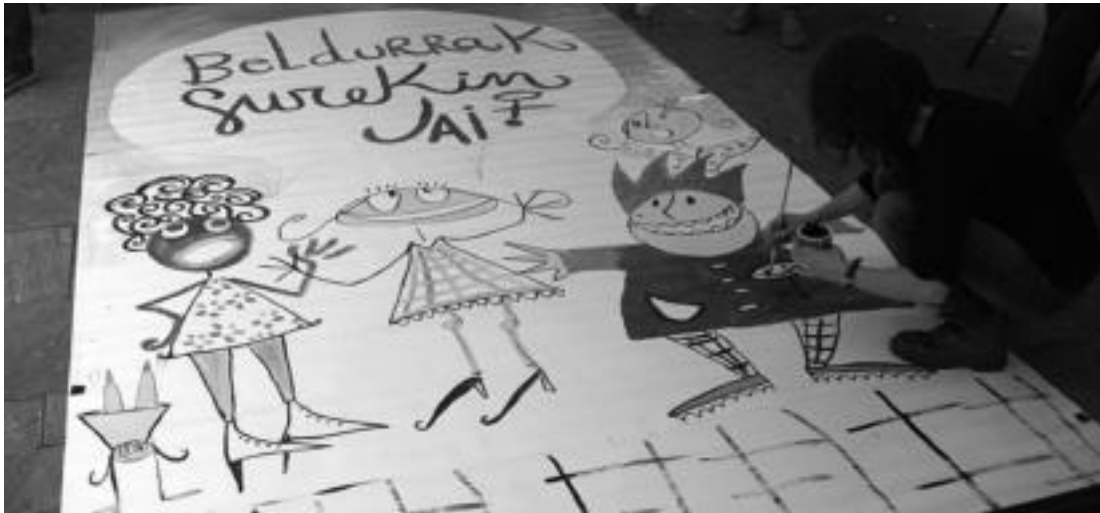
Joan den urtean Tolosako denbora bankuko kideek antolaturiko topaketan, murala margotzen.