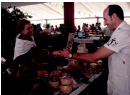
Orotariko produktu artisauroak topatu daitezke azokan. ITERRADILLOS

Orotariko produktuak ikusi eta erosteko aukera izango da bertan, jakiak (barazki, hestebete, konterberba, esneki eta gozoak), eta artisauro produktuak bereziki. Pin-