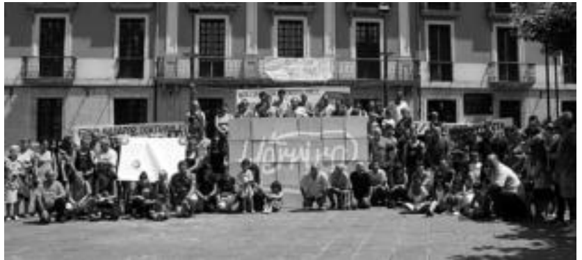
Tolosaldeko Herrira-k 'Herritarron epaia'-ren harira Tolosan egindako ekimena, uztailaren 14an.

rron epaia , eta 80 herri inguru igaroko ondoren, tardean Tolosa, hilaren 14an iritsiko da Iruñera. Euskal Herriko herri ezberdinetan bildutako epai guztiak aztertu ondoren, larunbatean plazaratuko dute euskal herritarren epaia zein izan den. Ekitaldia 18:00etan hasiko da, eta Herrira-tik eskualdeko herritar guztiak gonbidatu dituzte bertara.