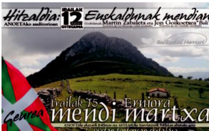
Tolosaldeko Bai Euskal Herriari herri mugimenduaren deialdiak iragartzen dituen kartela. HITZA

tuzte. Lehen deialdia hilaren 12an izango da, hau da, ostegunean. Anoetako auditoriumean Euskaldunak mendian gaiaren inguru-