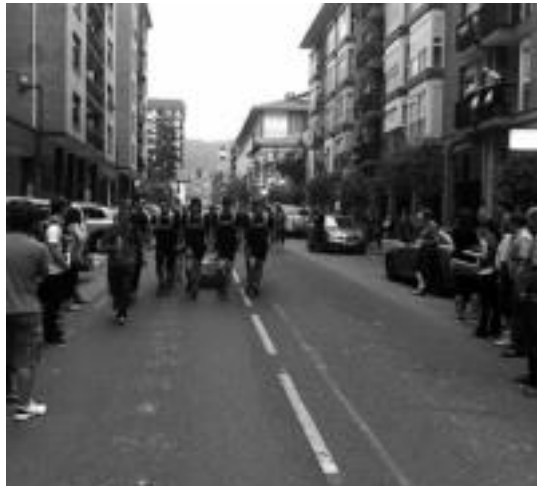
Ibarako jaien barruan, giza proba saioa izan zen Euskal Herria kalean. IT.

■ Hungariako folklore jaialdian izan dira dantzari tolosarrak. Udaberri taldea Hungarian barrera ibili da abuztuaren, eta herrialde hartan hainbat emanaldi eskaintzeko aukera izan du. Folklore jaialdiak bost egun iraun