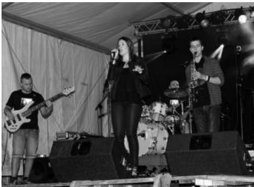
Tolosa ◉ Barrua Truk musika taldearen kontzertuarekin amaitu zen, ostiralean, Gau Giro 2013. I. URKIZU