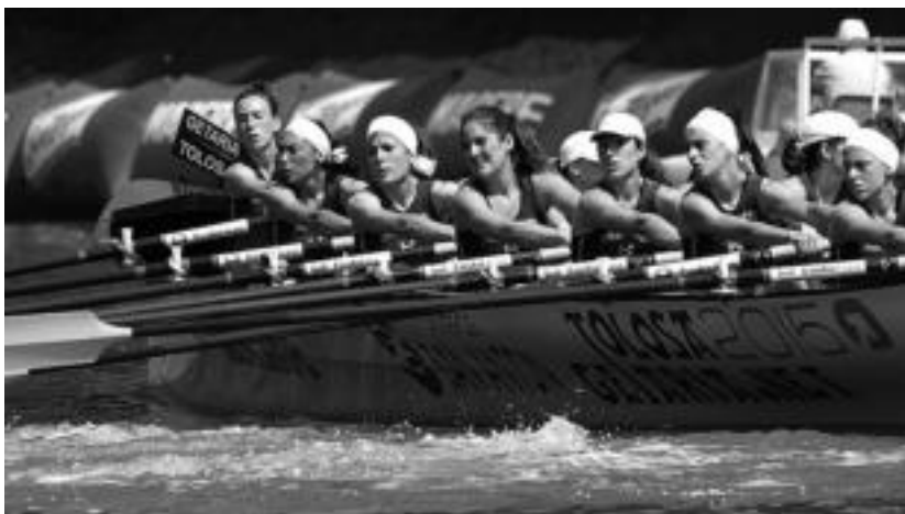
Aurten, lehen aldiz, ez du lehiatu Getaria-Tolosak. Tolosarrak beste talde batzuetan ari dira arraunean. HITZA