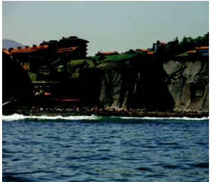
Hossegorren ateratako ilunabarreko argazkia bidali du Mirari Izagirrek, eta Zumaian ateratakoa, berriz, Ainhoa Kalongek.