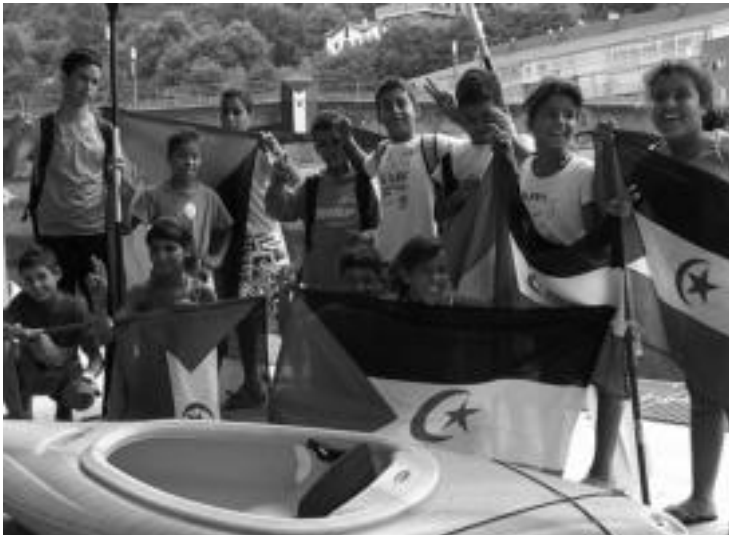
22 hour saharar izan dira Tolosaldean, uda honetan. HITZA