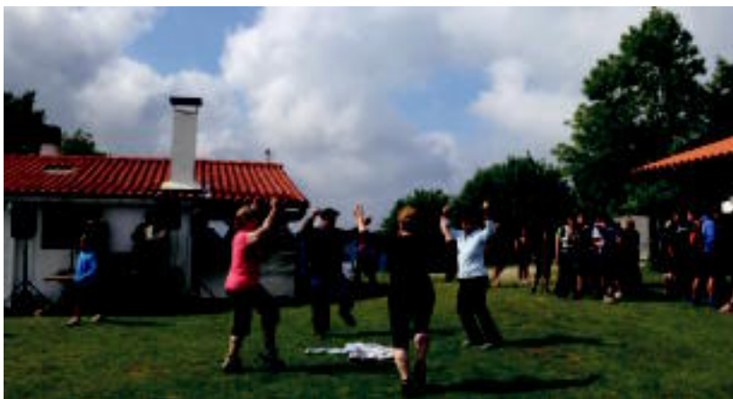
Jatekoa eta edatekoa izaten da Zelatunen, eta ohikoa da Zelatunera igo eta trikiti doinuekin dantzan egitea. HITZA

San Joan Txiki eguzek ematen zaio hasiera, eta ondorengo igandeetan izaten da erromeria Zelatunen. Gehienek Hernio tontorretik egiten dute itzulia, eta asko eta asko dira tontorrerako bidean dauden burdinazko uztaiek gorpuzta zeharkatzen dutenak. Ohiturak dioenez, uztaiek hezurretako gaixotasunak sendatzen dituzte. Hernioko erromeria eza-gutzen ez dutenek badute horretarako aukera. Azken igandea izan ohi da jendetsuena.