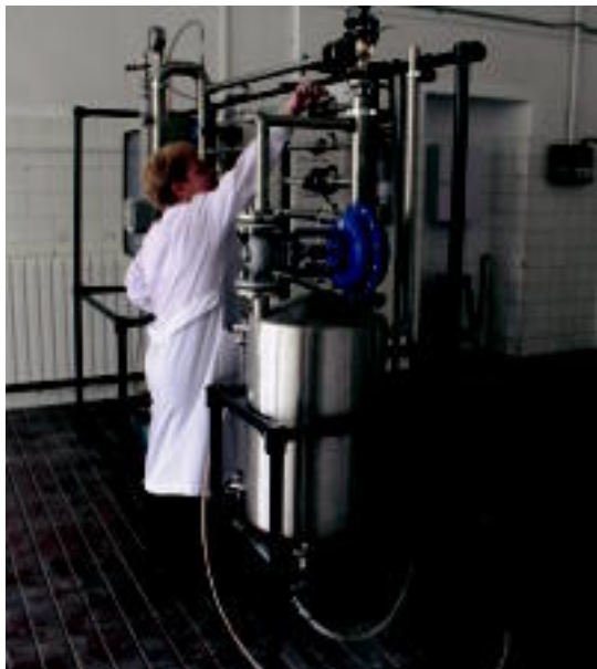
Erdi mailako eta goi mailako ziklo bana hasiko dira irailan. HITZA

Kimikagintzako bi modulo eskainiko dituzte ostiral honetatik aurrera, Tolosan