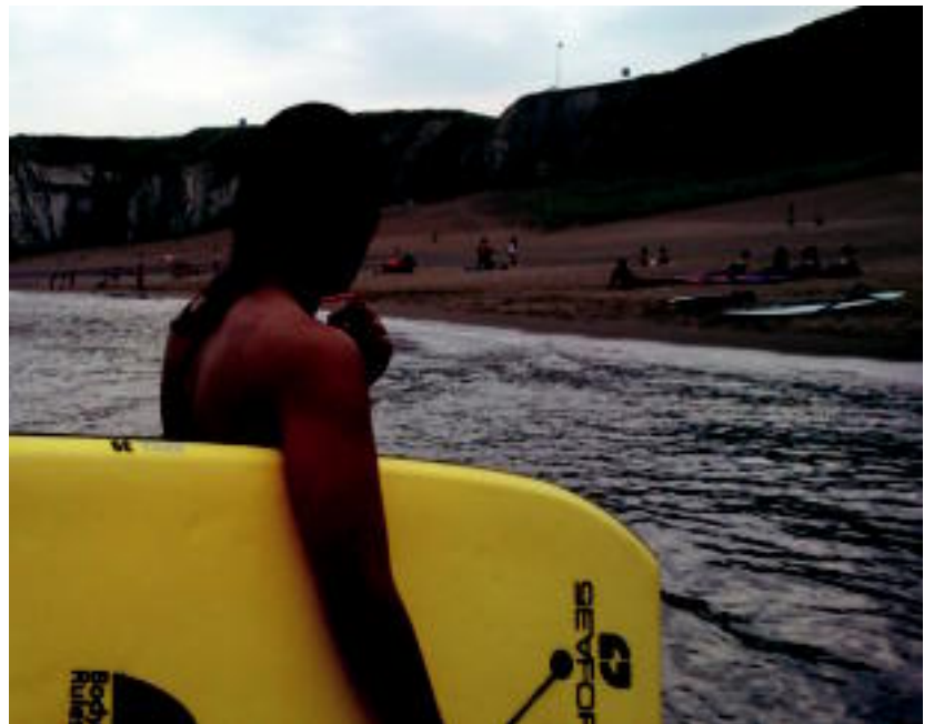
Sopelako hondartzan ateratako argazkia da bodyboard egitera joanda, udako goiz batean. JONE EZKURDIA

dunek bakarrik aukeratu ahal izango dute, eta horretarako thargazkiak@hitza.info helbidean harpidedun kodea, eta gehien gustatu zaien irudiaren zenbakia eman beharko dute urriak 2 baino lehen. 943 65 56 95 telefonora deituta ere bozka eman ahal izango da. Bozka eman duten harpidedun guztien artean, HITZAKo produktuen sorta zozkatuko da. Argazki guztiak tolosaldea.hitza.info webgunean izango dira ikusgai. Argazki irabazleak zein boto emaile aritu den harpidedun saritua urriaren 3an argitaratuko dira.