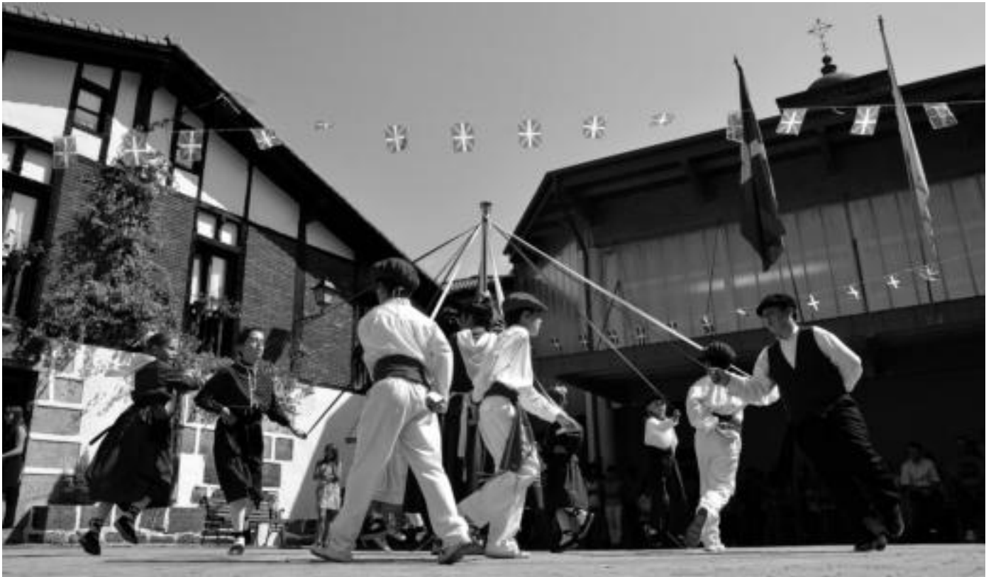
Goiatzko jaien barruan herriko dantzariak eginiko dantza saioa, auzoko plazan.