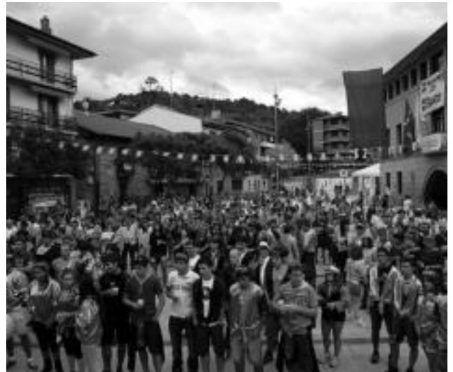
Ibarrako jaietan izandako eraso sexista salatzeako elkarretaratzea egin zuten. HITZA

reanean ihesi joan zen erasotzailerak. Ibarrako Udalak eta jai batzordeak gogor salatu dute erasoak: «Jai gunea, jaiak, emakumeek aske eta lasai bizitzeko lekuak direla eta emakumeek espazio publikoa lasai erabili dezaketela uste dugu, eta horrela izateko lanean jarraitzeko konpromisoa berresten dugu. Eraso hau ez da kasu isolatua, jaietan eta jaietatik ari erasoen berri izaten baitugu ia egunero Euskal Herrian. Matxismoa da erasoaren atzean dagoena, jendarte patriarkala, jendarte kapitalista. Eta indarkeria sexistarekin bukatzeko kapitalismo patriarkalarekin bukatzea beste biderik ez dago; hamaika neurri hartu ditzakegu erasoaren aurka, baina jatorriarekin bukatu arte ez dugu indarkeria sexistarekin bukatuko», adierazi dute.