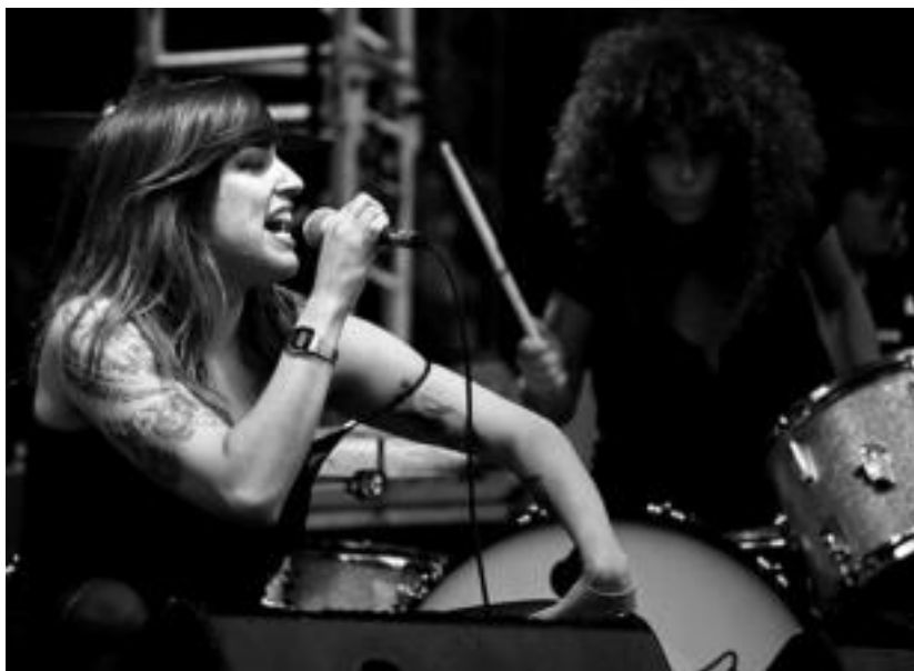
Tolosa ◉ Bonberenea Sutan musika jaialdian 700 lagun inguru elkartu ziren. Irudian Zuloak taldea. MIKEL IRAOLA

Amezketan, bestalde, Ikurrinaren Festa ospatu zuten larunbatean. Egun guztiko egitarauan ikurrinaren dantza, txakolina eta pintxoak, eta zahagi afaria egin zituzten, besteak beste, udalaren laguntzarekin.