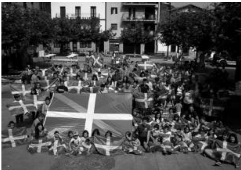
Amezketan ◉ Ikurrinaren Festa ospatu zuten larunbatean, egun guztiko jaiarekin. HITZA