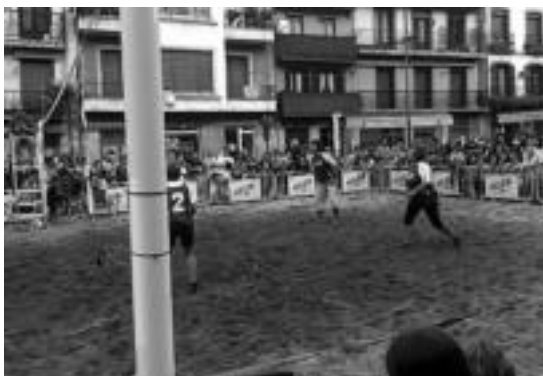
Tolosa ◉ Jende ugari jarraitu du IV. Boleibol Txapelketa. I. TERRADILLOS