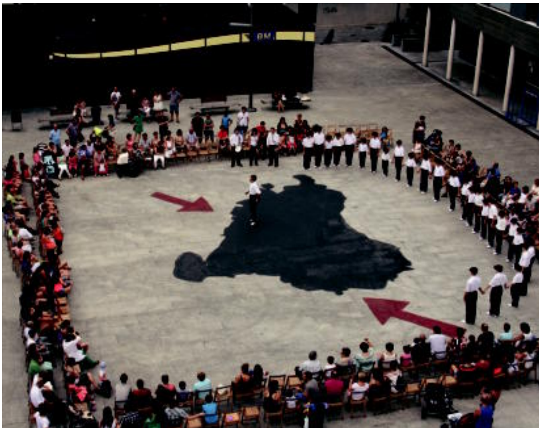
Villabonako Malkar plazan, Oinkari dantza taldekoek soka dantza ikuskizuna eskaini dute.

Ostirala, 2013ko uztailaren 26a. IX. urtea. 2.635. zenbakia. tolosaldea.hitza.info