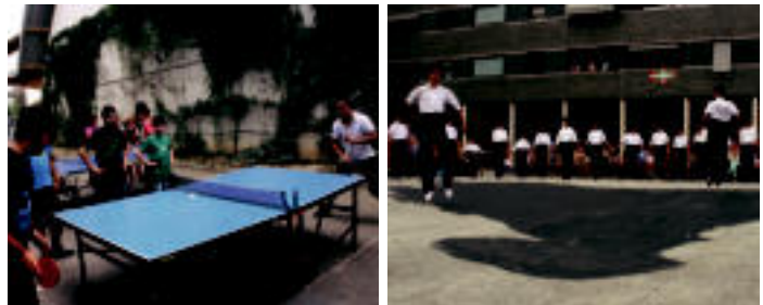
Kiroleunean, besteak beste, gastetxoak ping-pong-ean aritu ziren. Ondoren, Malkar plazan, Oinikari dantza taldekoek soka dantza ikuskizuna eskaini zuten. L. IZURZUOLU