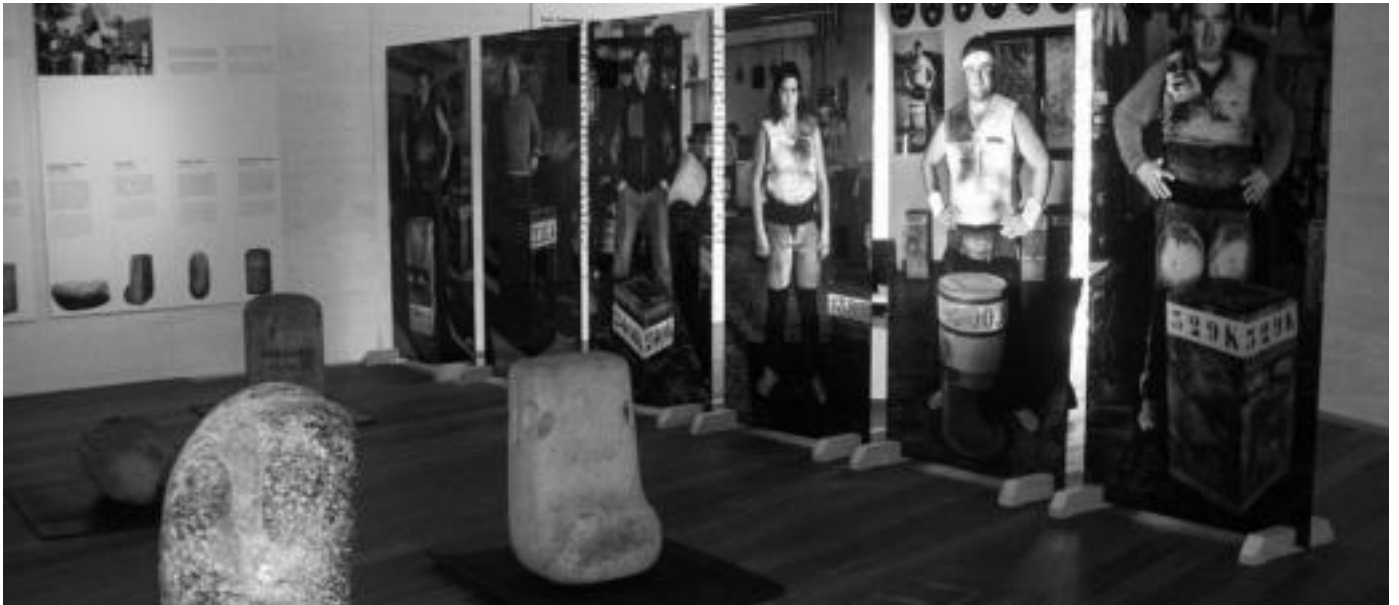
Donostiako San Telmo museoan Harri-jasotzaile. Harriaren indarra erakusketa ikusi daiteke irailaren 8 bitarte. J. SAIZAR

Harri-jasotzea berriro plazara atera nahi du Harria-Herria taldeak, eta bide horretan lan egiten ari da. San Telmo museoan jarritako erakusketa da horren adibide.