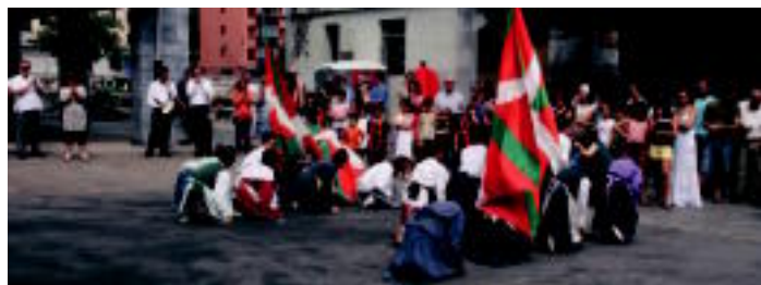
Villabonako Santio jaien bigarren egunean ikurriaren jipera ekitaldia egin zuten. Udai ordokariekin batera, herriko dantzariak ikurriaren dantza eskaini zuten. A. MAZ