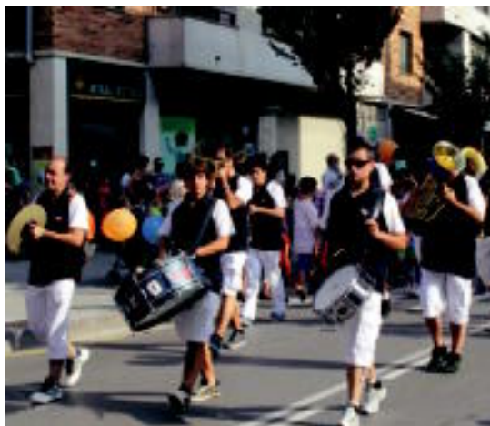
Iraunkorrek txarangak alaitu zuen giroa.