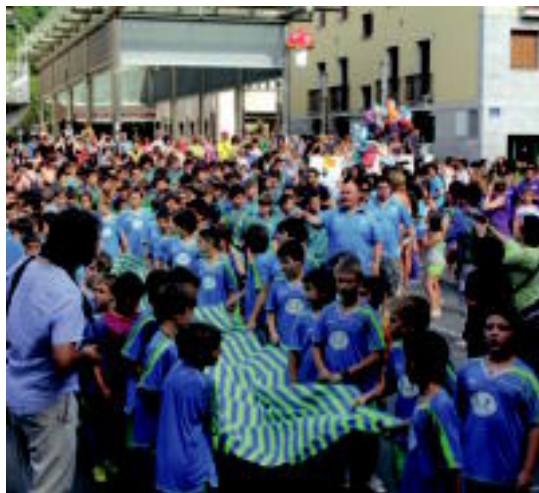
Billabona kirol elkarteko kideek kalejira egin zuten. M. IRAOLA

Dantzak ere izango du bere tartea. Arratsaldeko seietan, soka dantza egingo da Malkar plazan. Eta 22:00etan, Olaederra kiroldegian Oinkari Dantza Eskolako txikiak emanaldi berri bat estreinatuko dute, Poxpolo eta Konpainia pailazoekin elkarlanean egin dena. Guztira 250 haur inguruk hartuko dute parte.