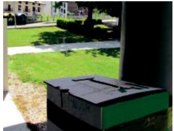
Udaletxeko poste batean jarri dute gutunontziak bat. E. MAIZ

Herriko istorio zahar eta berriak biltzeko, herriko udaletxean eta Ostatu, Toki-Alai eta Zubiaurre tabernetan, gutunontzi bana jarri dute.