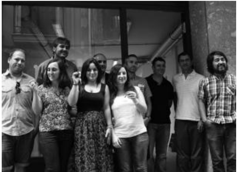
Datozen hilabeteetan zabalduko dituzte beren komertzioak, lau gazte ekintzaileek. ITZEA URKIZU

Bi lehiaketa publiko egin dituzte honetarako. Lehena proiekturako lokalak aukeratzeko izan