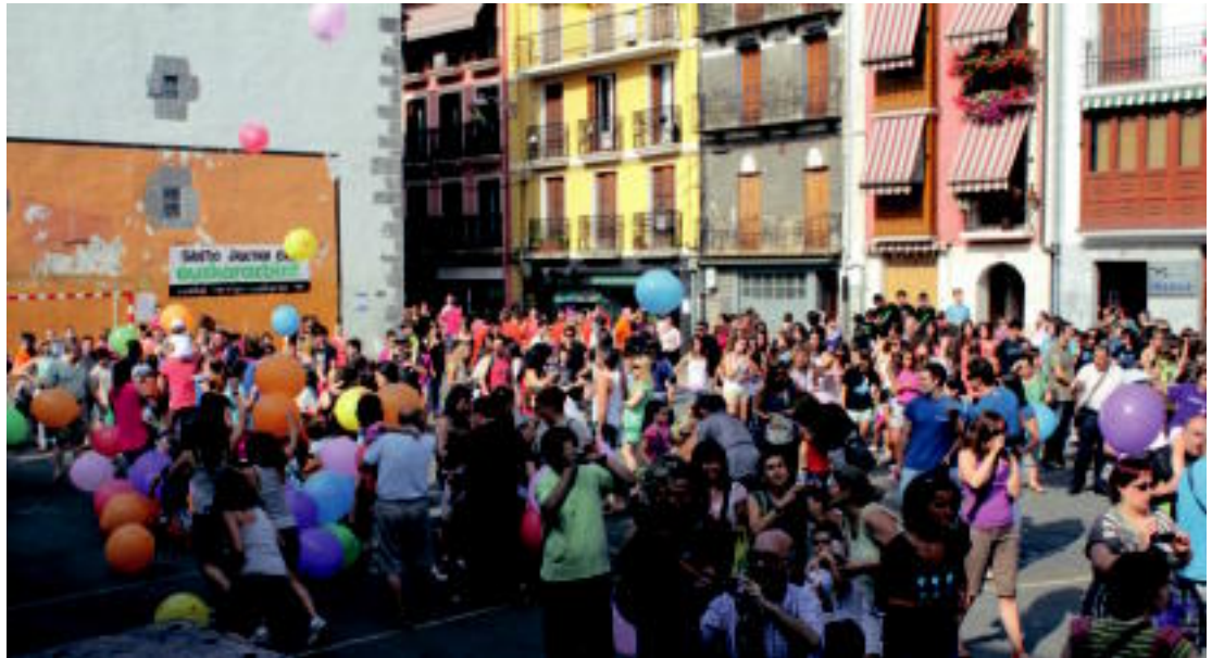
Plaza jendez eta kolore biziz bete zen jaiari hasiera emateko.

Zunbeltz elkarteak 33. aldiz antolatu duen Herri Krosak ehunka korrikalari bilduko ditu goizeko 10:30etatik aurrera. Benjaminak izango dira irteten lehenak, eta elkartearen inguruan buelta txiki bat eman beharko dute. Bi itzuli egingo dizkiote alebinek. Infantil eta kadeteek, 2,5 kilometroko ibilbide nagusiari buelta bat emango diote. Juniorrek, bi bira egin be-