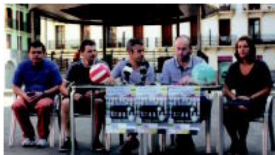
'Udako azken festa' egitasmoaren aurkezpena. ITZEA URKIZU

Adunako Udalak Belkoain mendiko 1936ko gerraren aztarnen berreskuratzea bultzatu du; Aranzadi zientzia elkarte ari da lanean ◊6