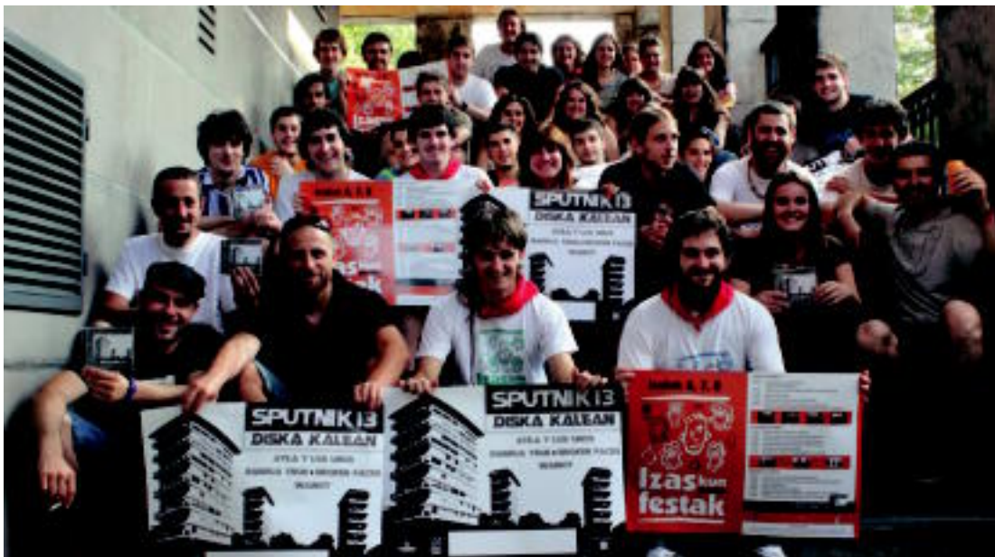
Izaskun auzoko festa batzordeko kideak eta 'Sputnik 13' bildumako zenbait musikari, agerraldian. ITZEA URKIZU

Asteazkena, 2013ko uztailaren 24a. IX. urtea. 2.633. zenbakia. tolosaldea.hitza.info