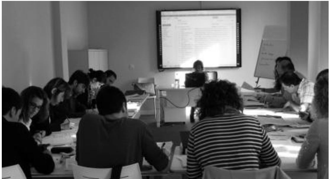
Apirilean eduki teorikoekin eta hizkuntzekin hasitako masterra, eskualdeko enpresetako proiektuarekin amaitu beharko dute ikasleek. HITZA

Nazioartera begira jartze horretan, hiru zati nagusi izan ditu prestakuntza honek. Batetik, merkatuen inguruko informazioa, aduanak, negoziazioetarako gakoak eta antzeko gaiak izan dituzte hizpide, eta masterraren nazioartekotasuna medio, bigarren zatia hizkuntzei begirakoa izan da; horrela, ingeles eta frantses komertziala landu dituzte, maila