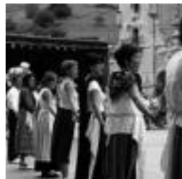
Soka dantzako une bat. HITZA

Abuztuaren 21etik 25ra ospatuko dituzte San Bartolome jaiak ibaritarrek. Bada, jaien barruan, abuztuaren 23an, ostiralez, sokadantza dantzatzeko dute herriko koardiletako kideek, arratsaldean. Hala, bertan parte hartzera animatu dituzte herritarrek, eta horretarako entsegura joateko deia egin dute.