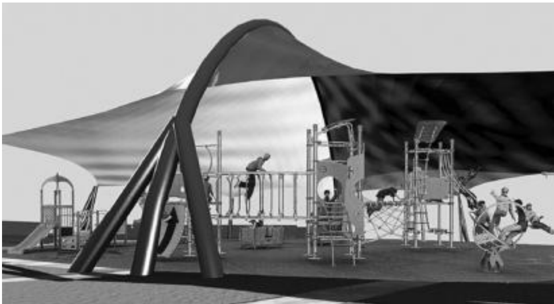
Horrelaxe geratuko da plazako jolastokia: 250 metro karratu ditu eta guztiz estaliko dute. TOLOSAKO UDALA