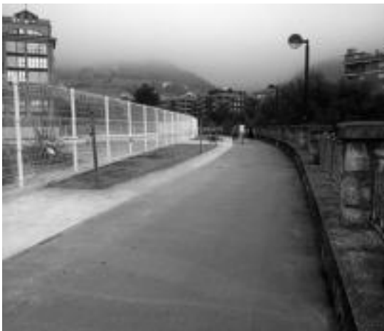
Handiagoa da orain ibaiaren ondoko pasealekua. HITZA