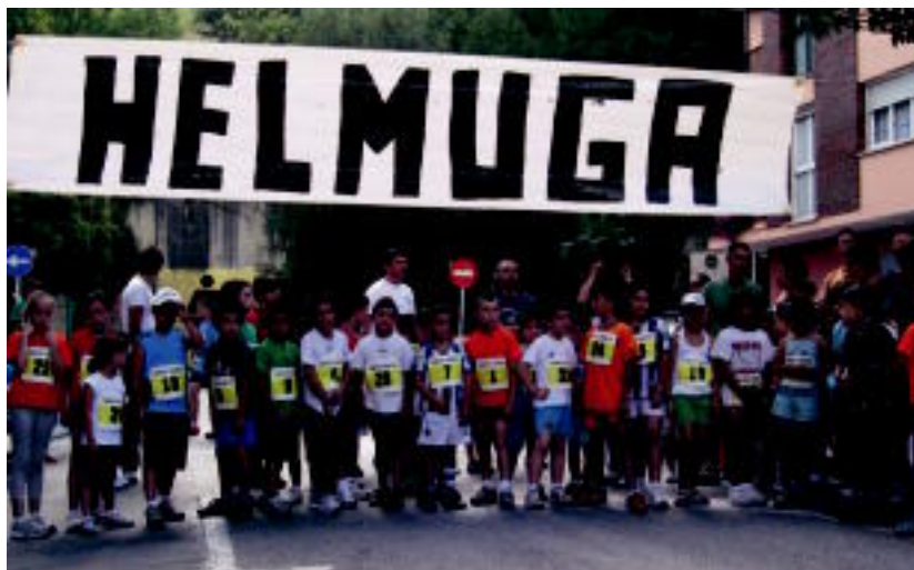
Santio Kros herrikoia XXXIII. edizioa jokatuko da aurtengo Villabonako Jailetan. HITZA

izango dira ikusgai Maiatzaren Lehena plazan. Lehenik, emakumezkoek osatutako Ibarrako eta Orioko taldeek erakustaldia eskainiko dute 15 minutuz, 550 kilogramoko harriari tirakoa. Ondoren, gizonezkoen txanda izango da. Loatzo eta Aiztondo-Oarso taldeak nor baino nor ariko dira