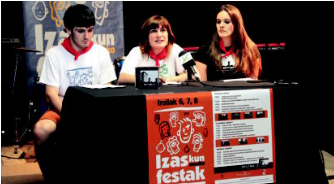
Tolosako Izaskun auzoko jaien aurkezpena egin berri dute; irudian, agerraldiaren une bat. ITZEA URKIZU