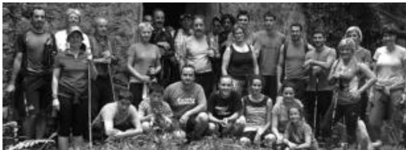
Aldabako Auzo Elkarteak antolatuta, iaz ere, mendi buelta egin zuten auzotarrek. HITZA

Elkarteko kideek mendira errekin joan nahi duen oro gonbidatu dute irteerara.