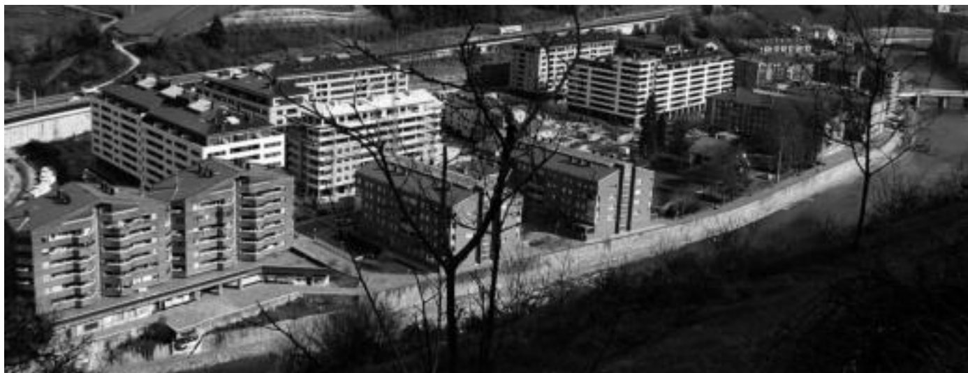
Stop Kaleratzeak plataformak adierazi dutenez, «etxebizitzaren salerosketa unerik gorenean zegoenean Kutxarekin eginiko ia hipoteka guztiak dute IRPH indizea». HITZA