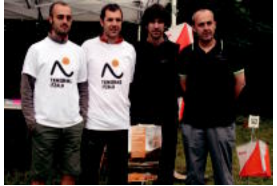
Antolatzaileak I. Rogainea orientazio probaren aurkezpenean. JONE AMONARRIZ

Izena emateko edo informazio gehiagorako blog bat ireki dute: http://orientimos.blogspot.com.es . ● tolosaldean@hitza.info