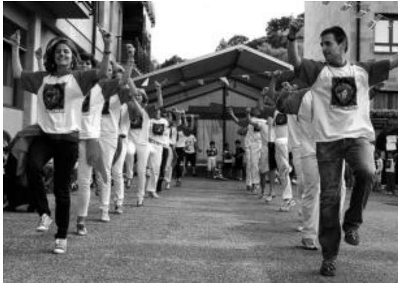
Iurreamendi auzoko jaietan iaiz egin zuten, lehenengoz, Larrain dantza.

Azkenik, Amarotz auzoan bihar botako dute jaiak abiarazteko Suziria, eta mozorro gaua izango da lehen eguneko jarduera nabarmena. Asteburu osoan luzatuko dira, ordea, jaiak, eta besteak beste, larunbatean Wainot, Rei Kimera eta Atila y los Unos taldeen emanaldiak izango dira. Igandean, berriz, aurrekua dantzatuko dute auzotarrek.