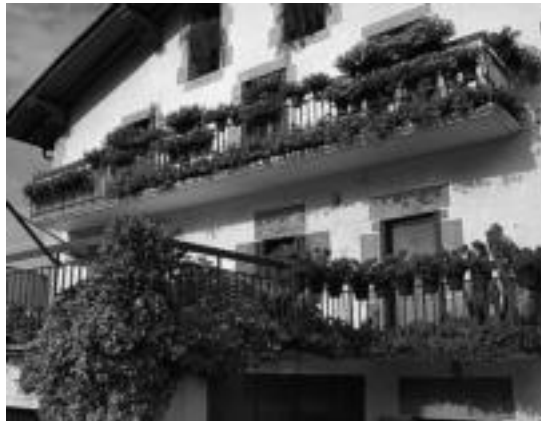
Berastegin ikus daitekeen balkoi ederretako bat. HITZA

Izen ematea bukatu ondoren, goizean batzordekideak eta lorezaintza teknikaria etxex ibiliko dira puntuaketa egiten. Baratzeen kasuan, abuztu bukaeran edo irailaren hasieran barazki-