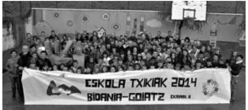
Gipuzkoako Eskola Txikien festa, 2014an, Bidania-Goiatzen egingo da. HITZA

Urratsez urrats eta burokraziaren epeak betez, Bidania-Goiatzera iristen ari da udala: «Apirilaren 24ean hartu zuen udalbatzak izena aldatzeko erabakia. Gipuz-