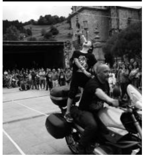
Pasa den urtean Ibarren egindako festaren une bat. IT.

Leihio, Balkoi eta Terraza Lehiaketa eta Lorategi Lehiaketa bosgarren urtez egingo dute aurreko, eta Baratze Lehiaketa, laugarrenez.