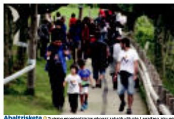
Abaltzisketa | Turismo esperientzia iraukerak zabaldi dituzte. Larraitzan, Hiru egunetan, ekitaldi ugari izan dira haur, gazte eta helduak zuzenduz.