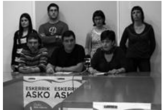
Zizurkilgo udal ordezkariak prentsaurrekoa eskaini zuten atzo. A. IMAZ

Amasa-Villabonan, azkenik, uztailearen 7an jarriko dute atez ateko sistema «mixtoa». Organikoa, ontzi arinak eta errefusa bilduko dira soilik atez ate; beira, papera eta kartoia, pilak eta arropa, berriz, orain artean bezala, edukiontzien bitartez.