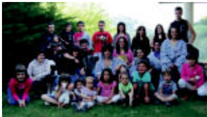
Areso | San Pedro egunez, herritar talde bat baserri baserri eskean ibili zen.