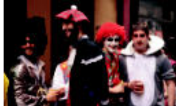
Tolosa | Inauterietan ez bezala, eguraldi lagun izan zuten Mozorro Egunean.