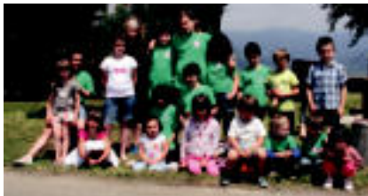
Urkizu | Urkizu auzoko festetan, San Pedro egunean, hauek bazkaria izan zuten.