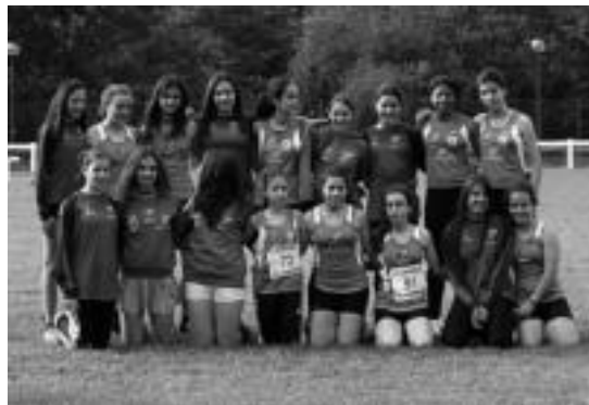
Txapelketan parte hartu duen nesken taldea.