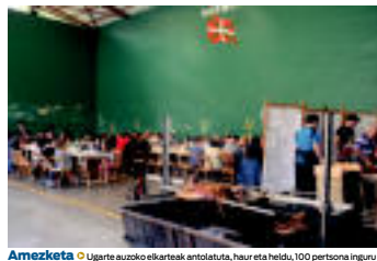
Amezketako | Ugarte auzoko elkarteak antolatuta, haur eta heldu, 100 pertsona inguru elkartu ziren betizua jateko auzoko pilotalekuan.