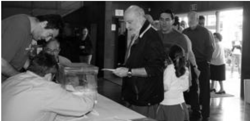
Villabonan kazetariak arazoak izan zituzten antolatzaileekin galdeketak irudiak hartzeko.

Anoeta, Irura eta Amasa-Villabonan %35-40 bitarteko partaidetza zenbatu du Tolosaldea Txukunek