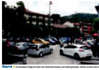
Ibarra | Autozaleen bilgune izan zen Ibarsko plaza, larunbat goizean. Mota, kolore eta tamaina guztiakoko autoak ikusi ahal izan ziren eta jende ugari gerturatu zen.