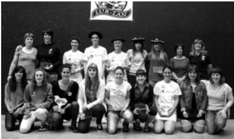
Igdandean jokotutako Su-Berri paleta txapelketako finalista.