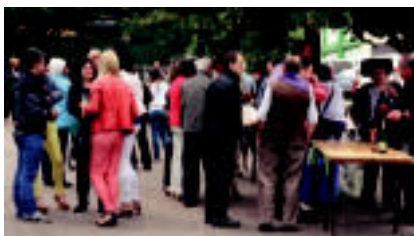
Leaburu | Txindokiko dastaketa egin zuten pintxo eta guzi, Leaburuko jailetan.

Albiste guztiak argazkiak edota bideoak sarean daude ikusgai: tolosaldea.hitza.info