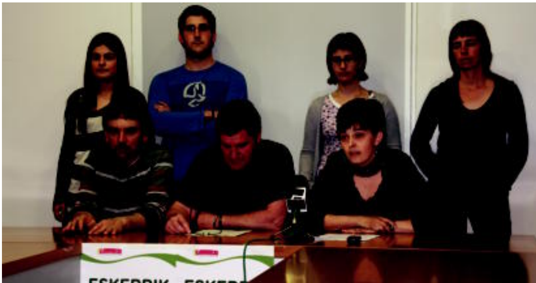
Zizurkilgo Bilduko hautetsiek prentsaurrekoa eskaini zuten, atzo. ASIER IMAZ

Tolosaldea Txukunek Anoetan, Iruran eta Amasa-Villabonan eginiko galdeketetan %35-40 bitarteko partaidetza zenbatu du o 2-3