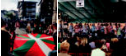
Asteasu | Baurinaren aldeko ekitaldia, eta herriko txistularien saioa, musika jaialdiaren barruan.