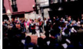
Tolosa | Bost urte bete ditu kanutu jira taldeak, eta urteurrena kantuan ospatu zuten.