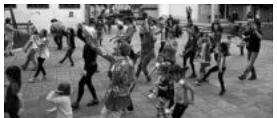
Goian, Amasa-Villabonako ekitaldia, eta behean, Lizartzan dantzan. HITZA

tu dena, eta lehen aldia da, alkate bati gure iritzia aurrez aurre eman ahal izan dioguna». Birziklapenari aukera bat emateko eskatuz, Amasa-Villabonako Zero Zabor taldeak manifestua kalera-