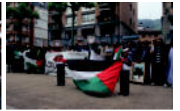
Tolosa ◉ Jerusalemen atzetik askatasuna eskatu zuten Libanarri elkarteak. it WWW