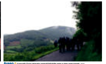
Areso ◉ Aresotik Goizetarako mendit ibilaldia egin zuten aresoarrak. it