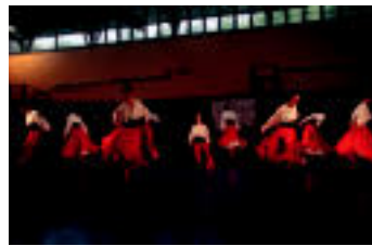
Ibarra ◉ Ibarako kaleetatik kirodegira pasa behama izan zuten euriaren eruz Alurr Eguna. Goizean gaztetxoak aritu ziren dantzan, eta arratsaldean gazteak. it