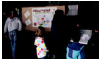
Leitza ◉ Golen, Maxurenea enakaren ondok igarotzen. Behain, plazan, sinadurak bitzen. it