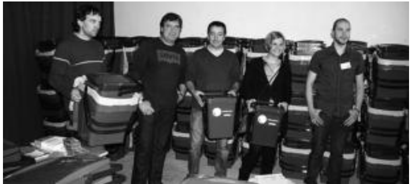
Zizurkil, Anoeta, Irura eta Alegiako udal ordezkariak atez atekoaren aurkezpen ekitaldian. A. IMAZ

Zizurkilgo Udalak bere webgunean www.zizurkil.eu -n azaldu duenez, zintzilikarioen legezko-tasunaz herrian banatzen ari diren oharrak dioena «erabat okerra» da. Webgunean jartzen duenaren arabera, Zizurkilgo Udalak argi utzi nahi du eskumena duela herri altzariak horretan ezartzeko, horrela jasotzen duelako Zizurkilgo plan orokorraren testu laburtuak.