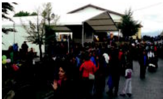
Jende asko gerturatu zen egun osoko festara. HITZA

Datorren urtekoa, Gipuzkoako Eskola Txikien 27. Festa izango da. Bidania-Goiatzen ospatuko da. Bigarren aldiz antolatuko dute jaiak, bertan ospatu baitzen lehenengo festa orain dela 26 urte ere.