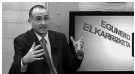
Krisia herritarrei hurbilduko die Barandiaranek. HITZA

tzatzen dituela diozu. Hala ez balitz gaur egun egoera hobean al geundekete?