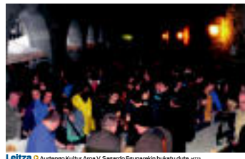
Leitza ◉ Aurtengo Kultur Aroa V. Sagardo Eguna irudirik bukatu du. it