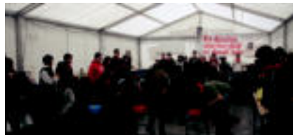
Tolosa ◉ Plaza Berria ospatu zuen Emaik Independentzia Eguna. Irudian, bazkaloetan, jolasen. it