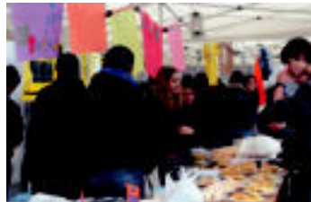
Tolosa | Kirikibo aisialdi taldeak postua jarri zuten, Sahararen alde. | IZAZKUZ