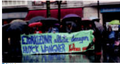
Tolosa | Huyck Wagner Perot-eko langileek ere beste asteburu batez hartu zuten plaza. | IZAZKUZ