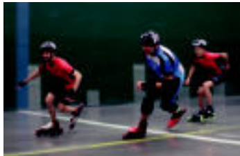
Tolosa | Ahoari patin festa Uzturpe frontoian egin zuten, eguraldiagatik. | IZAZKUZ