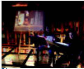
Tolosa | Zuzeneko musika izan zen Tolosako bi museoetan. | IZAZKUZ