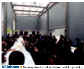
Villabona | Berdura plazan baskaldu zuten Aitzondoko gazteek. | IZAZKUZ