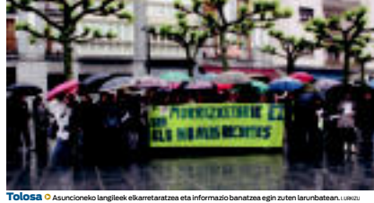
Tolosa | Asuncioneko langileek ekarretaratzea eta informazio banatzea egin zuten larunbatean. | IZAZKUZ