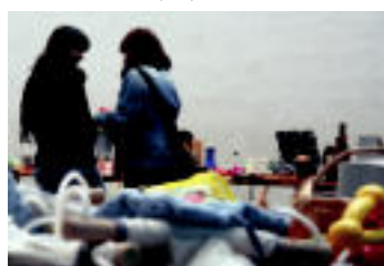
Alkiza | Denbora bankuak truke azoka antolatu zuten igandekoan. | IZAZKUZ