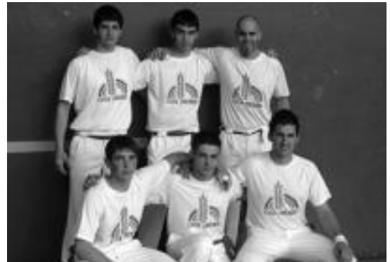
Zizurkilgo taldeak aurrera egin du Gipuzkoako herriartekoan. HITZA

Gipuzkoako Herriarteko Txapelketan eskualdeko hiru taldeek aurrera egin dute