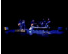
Tolosa | Anje Duhalderen Berriaren aldeko emanaldia.