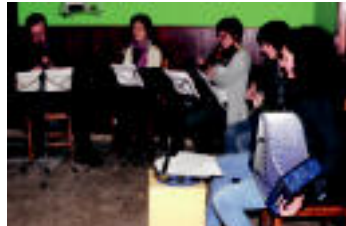
Leitza | Hirutxulo folk taldea artu zen Leitzaiko kultur-astean, Gaztaganan. | IZAZKUZ