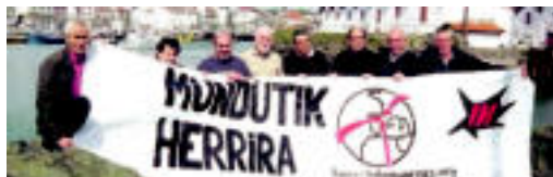
Anoeta, Villabona eta Asteasuz gain, Tolosaldeko hainbat iheslarik ere bat egin dute Herrira-k deitutako ekimenarekin. HITZA