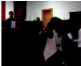
Leitza | Casting-a egin zuten hainbat herritarrak. | IZAZKUZ

kari legea, eta perranda giroan jarraitu zuten. Barrako Izaskun auzoan ere, asteburua seinatuta izan da igarotakoan. Larunbatean, hala ere, bertin behe-geratu behar izan zuten zaldi lasterketak, eguraldi medio, baldintza kaskarrak zirelako proba hasteko. Atzo, hala ere, aterrupei esker, Potagorriko noren eta Lizasoren bertso aleaz gozatu ahal izan zuten hainbat herritarrak, gizaan. Igandean, azkenik, azokak izan ziren protagonista. Alkizan, denbora bankuak antolatutako truke azoka antolatu zuten frontoian, eta Berrobi bigarren ospatu zuten, Udaberriko merkaturak. Tolosan, Ahoari! Astoko patin festa ez zen nahi bezala irten eurragatik, eta Uzturpe frontoian egin zituzten jarduerak. Leiztan, berriz, kultur-aste jendetsuaren barruan, Hirutxulo folk taldea artu zen Gaztaganan, eta jende asko bertaratu zen ikustera.