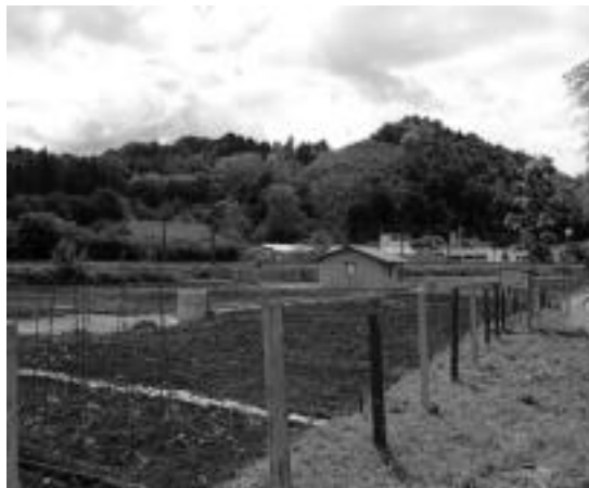
Belostegi auzoan kokatzen den parkeak 44 baratze ditu. M. IRAOLA

Martxoan prestatu zuten eremu hau, eta apirilaren zehar, nekazaritzaren oinarrien inguruko ikastaro bat eskaini zieten. Hemendik aurrera, lanean jarduteko aukera izango dute izena eman duten 36 erabiltzaileek. Hilabetean behin, gainera, aholkularitza zerbitzu bat izango dute Ekoguneko langileen eskutik. Horrez gain, urtean bizpahiru ikastaro eskainiko dira. «Hasieran, oina-