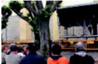
Ibarra | Peñagarikano eta Lizaso artu ziren, atzo, bertsoetan. | IZAZKUZ