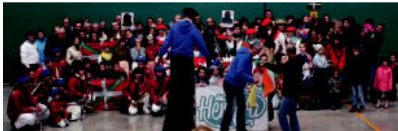
Zizurkil, Ibarra, Leaburu-Txaraman eta Lizartza herritar ugari elkartu zen.