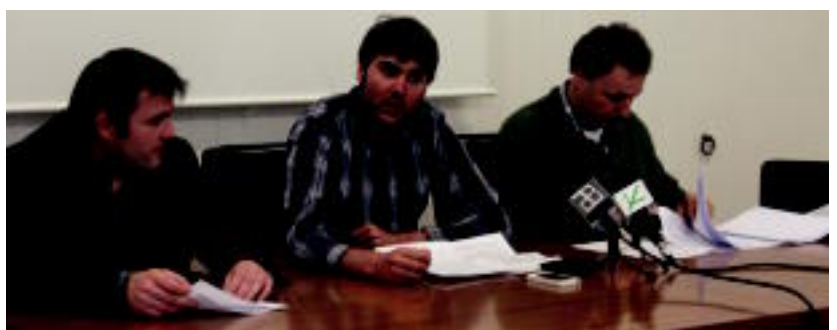
Eguzkitza, Iriarte eta Sagarzazu, atzo, Paper Eskolan.

Kimikagintza eta Kimika industrialak izango dira eskainiko dituen araututako bi zikloak; ate irekien jardunaldia egingo dute, gaur 07