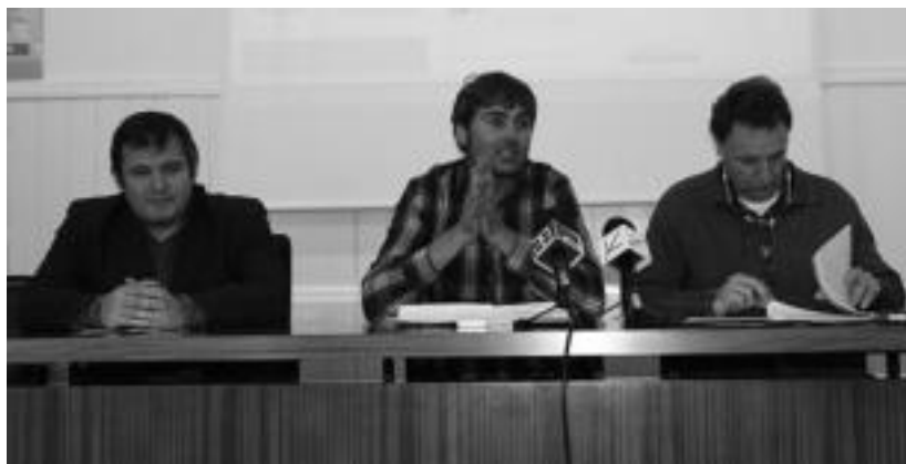
Eguzkitza zentroaren dinamizatzailea, Iriarte Tolosako alkatea eta Sagarazu Don Boscoko zuzendaria. I.T.

Astelehenean, diana izango da Loatzo Musika Eskolako eskutik, eta mezaren ondoren hamaitaketa egingo dute. Ondoren, arratsaldean bertso saioa izango da, Peñagarikano eta Lizasorekin, eta Alurr dantza taldearen emanaldiaz ere gozatu ahalako da.