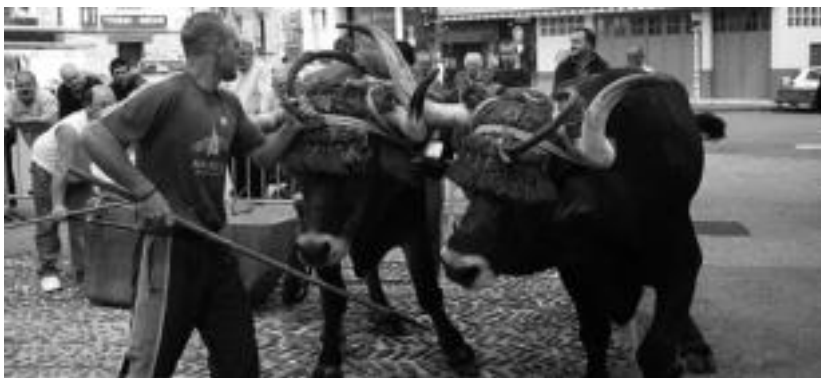
Asteasun iaz ere idiak desafioan ikusteko aukera egon zen, San Isidro Egunean.