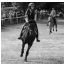
Iazko zaldi lasterketa. I.T.