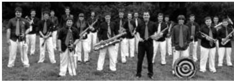
Sakramentinoetako patioan eskainiko du emanaldia, Bonberenea Txaranga, kolaboratzaileekin. HITZA