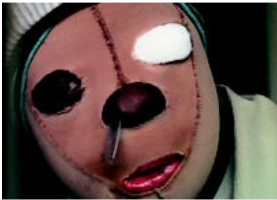
Consuelok maskara bat behar du aurpegiko giharrak mantentzeko. HITZA