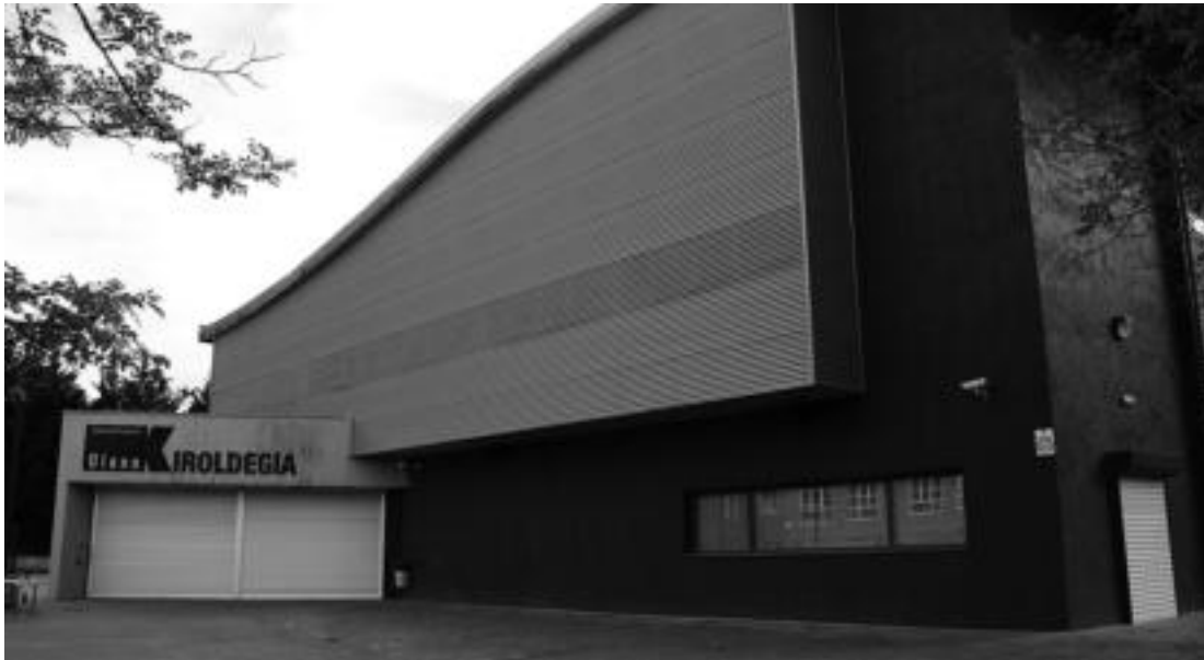
Hilabete eman du itxita Anoetako Abraham Olano kiroldegia. M.I.