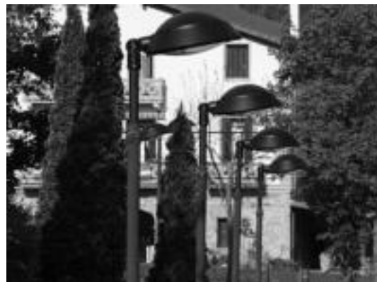
LED bonbilladun farolak jarri dituzte plaza inguruko kaleetan. M.I.

Pello Estangaren esanetan, «lehentasunezko» inbertsioa izan