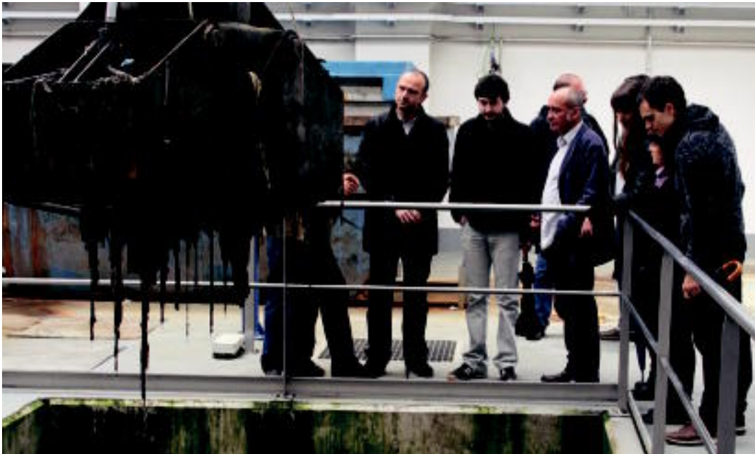
Erakundeetako ordezkariak izan ziren atzo, teknikariek in batera, Adunako hondakin uren araztegia. I. TERRADILLOS

Ostirala, 2013ko maiatzaren 3a. IX. urtea. 2.588. zenbakia. tolosaldea.hitza.info