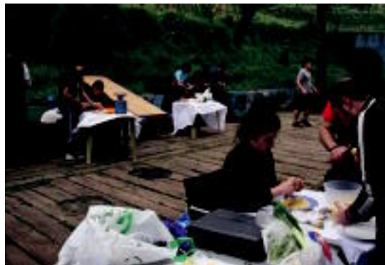
Pasa den urteko tortilla lehiaketa Anoetako Gaztetxean. REBEKA CALVO

te Asanbladak, hilabeteko asteburu guztietarako ekintzak antolatu ditu. Aurtengo ezberdintasuna, Onddorock bezala ezagutua zen festivalari beste formatu bat ematea izan da, talde ezezagunei aukera bat emanaz.