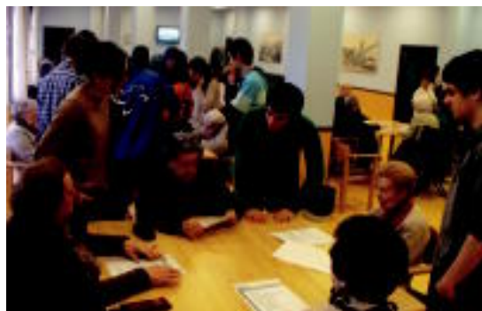
Batxilergoko ikasleak Uzturre zentroan, adinekoekin solasean.