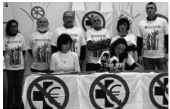
Tolosaldeko osasun mahaia osatzeko deia egin du TOPAK. I.URKIZU

Arrangoitzetik (Lapurdi) iritsiko da Tolosara, Berriaren 10. urteurrenaren oihartzuna, Anje Duhalderen eskutik. Datorren maiatzaren 17an, 20:30etik aurrera, Leidor aretoan kontzertua eskainiko du euskal rockaren erreferentziatiko bat denak. Emanaldiak sarrerak, gainera, TOLOSALDEKO ETA LEITZALDEKO HITZA (Araba etorbidea, 5, Tolosa) egunkariaren egoitzan salgai izango dira.