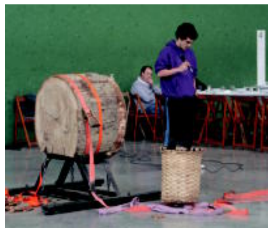
Garaiko landare eta loreak erakusgai izan ziren goiz osoan zehar, eta herri kirol saioa Irarustabarrenaren bertsoek zabaldu zuten. E. MAIZ