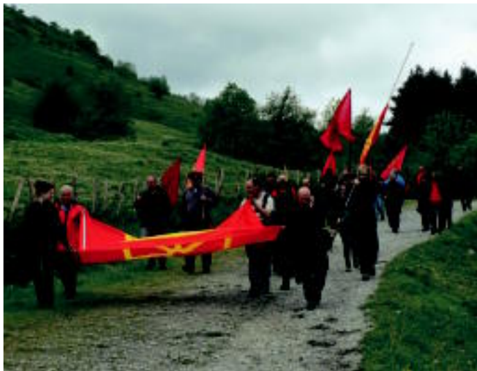
Gipuzkoako mendiko behor eta zaldien lehiaketa izan zen goizean, eta Aritza kultur elkartekok Ausa Gaztelu eguna ere atzo ospatu zuten. IÑAKI GURRUTXAGA / GOTZON ARANBURU