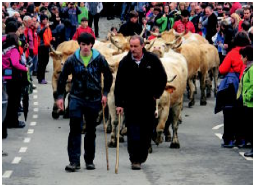
Abereen aitzakian antolatutako festa egunak, milaka bisitari bildu zituen Txindokiren magalean. I. GURRUTXAGA

Era berean, Nafarroa eta Gipuzkoa lotzen dituen Ausa Gaztelu mendiaren eguna ere ospatu zuten Aritza kultur elkartekok, eta festarekin bat egin zuten ibilaldiaren ondoren.