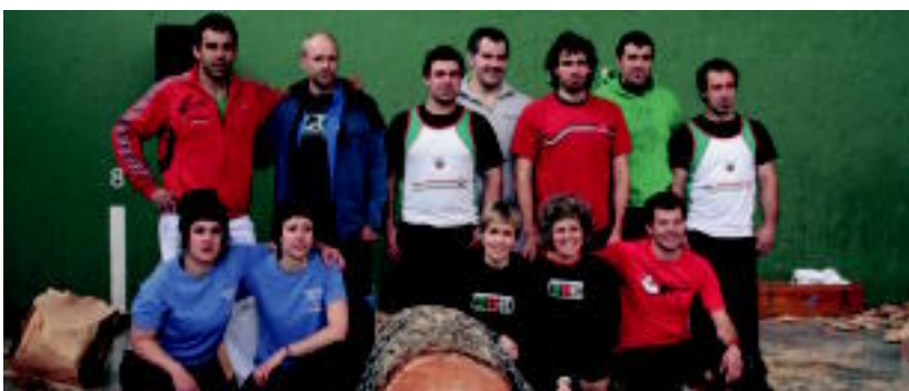
Bazkariaren aurretik, herri kirol saioa izan zen pilotalekuan. Bi taldetan banatuta aritu ziren lehian. E. MAIZ

→ Jendetza elkartu da larreen irekieran. Urteroko erretratua errepikatu da Abaltzisketan maiatzaren lehen egunean. Larraitzen festa giroa nagusi izan da, Aralarko larre irekieraren harira. Abereek hutsik egin ez duten moduan, artisauak eta jakiek ere milaka bisitari erakarri dituzte Txindokiren magalera. 04