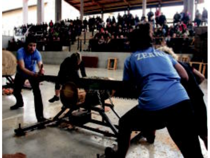
Herri kirolek giro aparta sortu zuten Baliarraingo Atari Soro pilotalekuan. Irudietan, lokotx biltze saioa, eta emakumezkoen trontza norgehiagoka. ENERITZ MAIZ