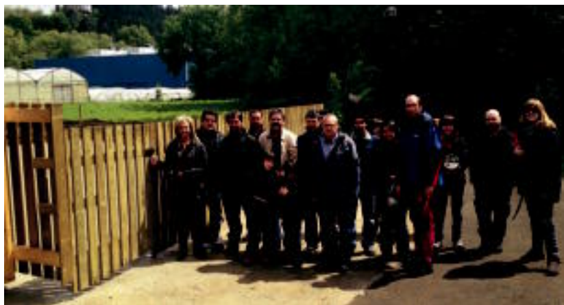
Udal ordezkariak, eta baratzea izango duten herritarrak, lehen aldiz baratzeetara sartzen. HITZA

Hitza-ko bezeroen arreta zerbitzua (zalantzak argitzeako, harpidedun egiteko): 902 82 02 01