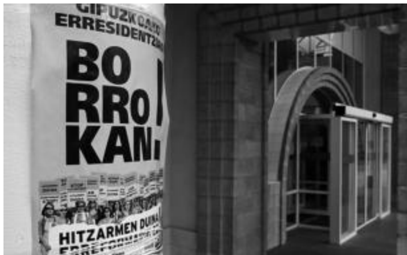
Grebako kartelak Iurreamendiko egoitzaren sarreran.

Iurreamendi eta Uzturreko langileak greban dira. Villabonako Santiago egoitzan aldiz ez daude greban, baina mobilizazioekin