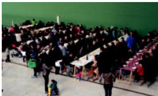
185 pertsona inguru elkartu ziren bazkarian. E. MAIZ