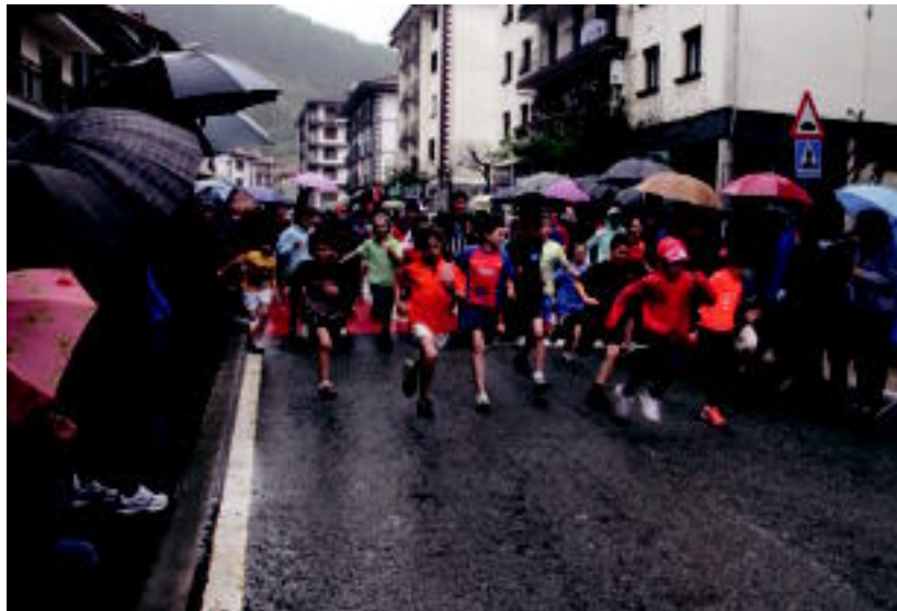
Pasa den urteko herri krosean gaztetxoak korrika. ASIER IMAZ

Nahi duen herritar orok parte hartu ahalko du proba honetan. Aurrez eman ahalko da izena, www.kirolprobak.com webgunean, gaur delarik azken eguna, edo bestela, lasterketaren egunean bertan, izen emate orria beteta, Aurrera kirol elkartearen, 15:30etik