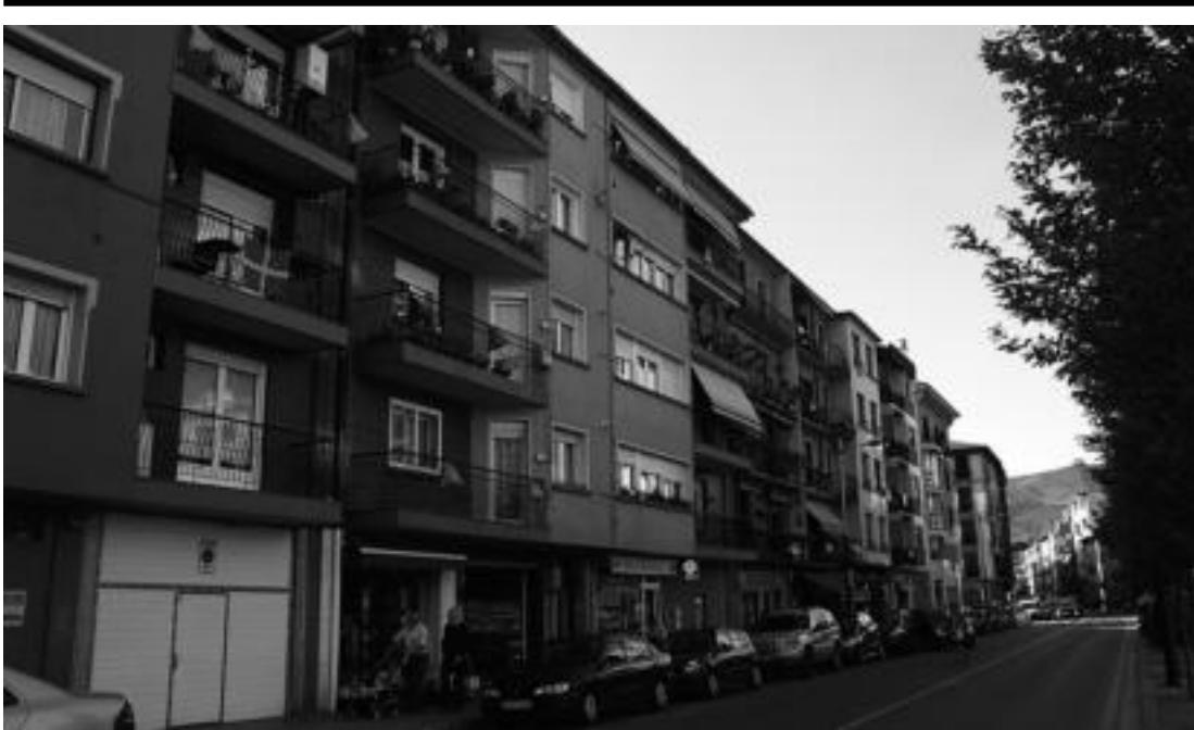
Hondakinen gaiaren inguruan, eskualdeko herritar ugari atez atekoaren aurka daudela azaltzeko, zabor poltsak jarri dituzte balkoietan. A. IMAZ