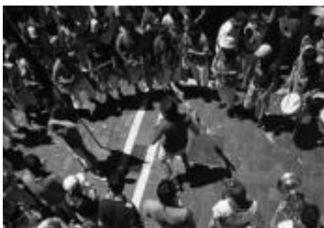
2009: Bigarren diskaren ondoren, Euskal Herri osoko zenbait lekutan aritu dira, Iruñea, Gasteiz, Donostia, Bilbo, Hondarribia, Irun, Arrasate... Irudian, San Ferminetako une bat.