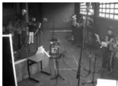
2008: Bigarren diskoa, 'Rocka eta urrezko komona', grabatu zuten. Denbora luzea eman zuten hau prestatu eta grabatzen, baina Euskal Herri mailan arrakasta izan zuen.