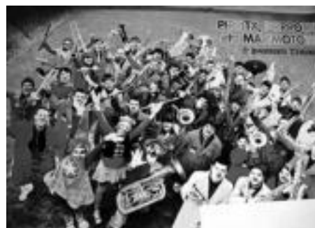
2011: Pirritx eta Porrotzekin batera hirugarren diska egin zuten, eta Euskal Herriko areto asko bate dituzte pailazoekin batera. Poster honen bidez, ume askoren 'lagun' egin dira.