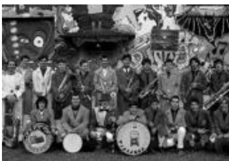
2006: Herriari harrera ona izan zuen diskak, eta herriz herri ibili ziren. Gainera, pixkanaka taldea handitzen joan zen, txarangako kideen familiarterako gazteak eta lagunak sartuz.