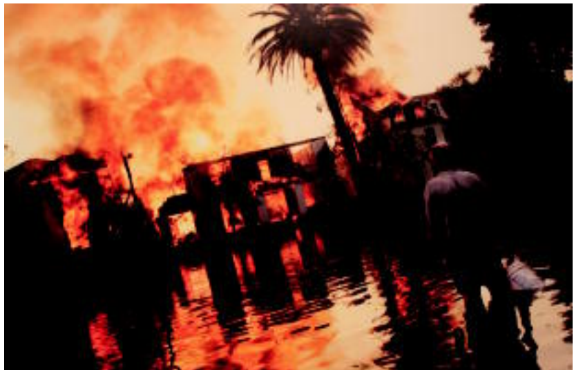
Katrina katastrofe naturala nola bizi izan zuten ikus daiteke zenbait argazkitan.