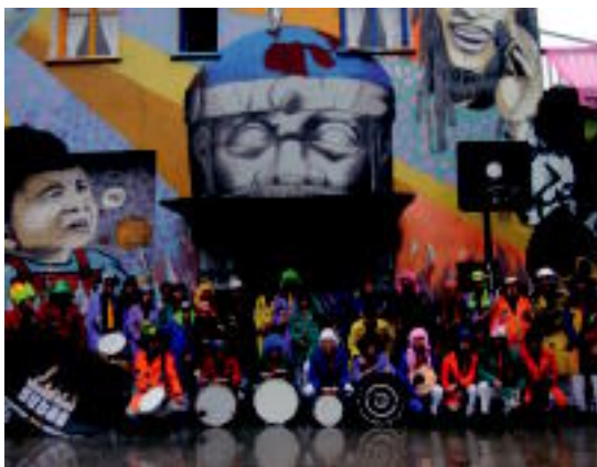
Bonberenea txarangako kideak, Bonberenean. HITZA

Hamar lagunek helburu finkorik gabe hasi zuten txarangaren ibilbidea o6-7