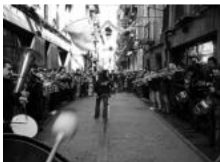
2007: Bonberenearen urteurrena ospatzeko geroz eta herriko jende gehiago biltzen zen. Txarangak, herritarrei gaztetxeko ateak ireki zizkien.