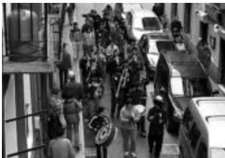
2003: Bonberenearen urteurrena ospatzeko musika eskolako hainbat gazte batu ziren. Txaranga kalera irten zen lehen aldia izan zen hura, eta hasieran, gehiagorako asmorik ez zuten.