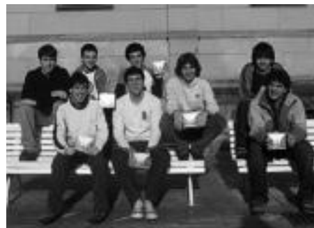
2005: Bonberenea Txaranga izeneko zazpi kantuz osatutako diska argitaratu zuten. Irudian, Txarangako kideak aurkezpen egunean, Donostiako Koldo Mitxelena kulturgunean.