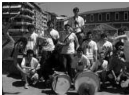
2004: San Joanetan, ordea, ederki pasa zutela ikusita, irteera errepikatzea erabaki zuten, eta ordurako, jada, kamisetak egin zituzten.