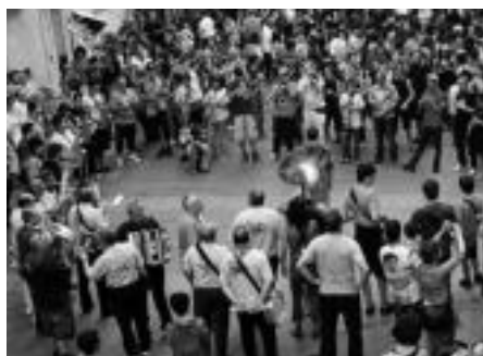
2010: Bonberenea ez botatzeko eskatuz, kalejira erraldoia egin zen SUTAN lelopean. Txaranga ere bertan izan zen, inguruko hainbat lagun bilduz. Ia 100 musikari bildu ziren.