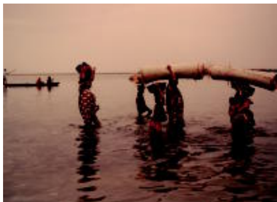
Presak handiek eragindako lekualdatzak eta erretratatu dituzte.

Aurtengo Naturaldia amaitzeko, azkenik, amaiera hitzaldia maiatzaren 16an izango da, Donostiako Aquariumean, Miguel Delibes de Castroren eskutik; Ura, baliabide baliotsu eta mugatua izenburupean ariko da, 19:30etik aurrera.