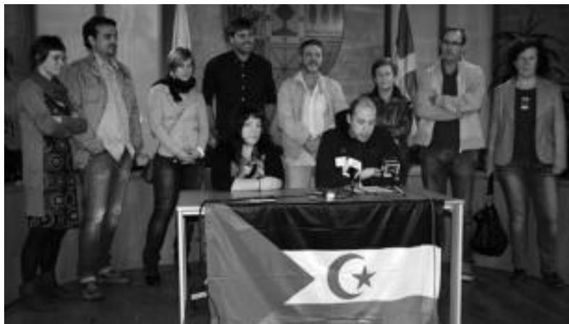
Tolosaldeko udal ordezkariak prentsaurrekoa eskaini zuten atzo, Tolosaldeko udaletxean.

Urtero bezala, neska-mutil hauek ekaina amaieran edo uztaile hasieran etorriko dira, eta iraila bitarte eskualdean egongo dira. Horretarako, ordea, Tolosaldeko familia desberdinak behar dira, beraien etxeetan gazte