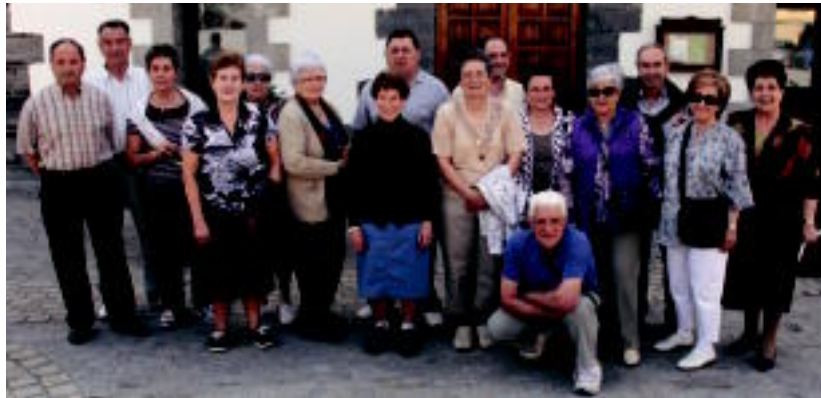
Erretirodunen ibilaldi neurtuan parte hartu zutenak, proba hasi aurretik, herriko plazan. I. GARCIA LANDA

Hitza-ko bezeroen arreta zerbitzua (zalantzak argitzeko, harpidedun egiteko): 902 82 02 01