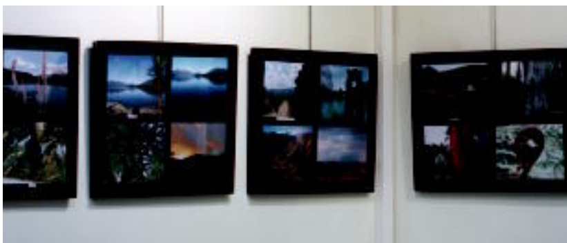
Argazki gehienak naturarekin loturikoak dira.