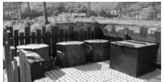
Pasa den apirilaren 12an jaso zituzten giltzak Alliri auzoan. HITZA

Hau guztia prebentzio neurri bat dela azaldu dute, «materia organikoak baita bai errauste plantetan, bai zabortegeietan, arazo gehien sortzen dituen frakzioa: «Zabortegeian usain txarra eta isurkinak sortzen ditu, eta errauste plantan, berriz, materia organikoak izaten da, erretzean dioxina gehien sortzen dituen hondakina».