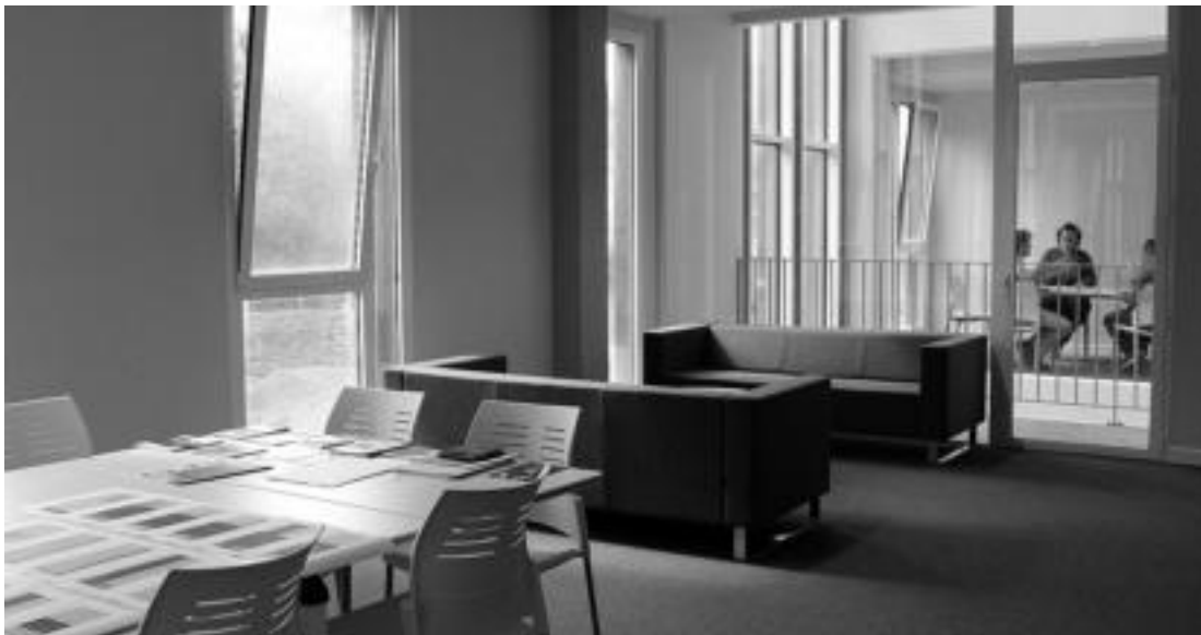
Eraikineko lehen solairuan ariko dira lanean, aurrerantzean, Lehiberri foro kideak. I. URKIZU

Martxoan zabaldu zuten Lehiberri zentroa, eta Tolosaldeko enplegua eta enpresagintza dinamizatuko dute, 3.000 metro karratu dituen zentrotik; ate irekiak antolatu dituzte.