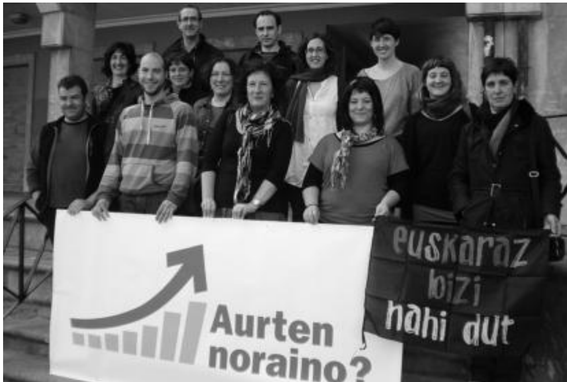
Errenta aitortpena euskaraz egiteko kanpainaren sustapen taldeko kideek deklarazioa euskaraz egitea eskatu dute. HITZA

Ez da lehendabiziko urtea. Aurteaz, helburu berarekin, kanpaina gehiago egin dituzte elkarlanean, eta emaitzak hor daude. Iaz, urrutira joan gabe, 5.200 herritarrek egin zuten deklarazioa euskaraz; aurreko urtean baino 681 lagun gehiago. Euskaraz errenta aitortpena egitea oso erraza dela azaldu dute sustapen taldeko kideek: «Ez dago inongo zailtasunik». Datuak gizentzen jarraritu nahi dute, eta horretarako, aurten ere kanpaina egitea erabaki dute. Leloak herritarrei galdera bat luzatzen die: Aurten noraino? Errenta aitortpena euskaraz egiteko kanpainaren sustapen taldeak erantzuna argi du: «Helburua