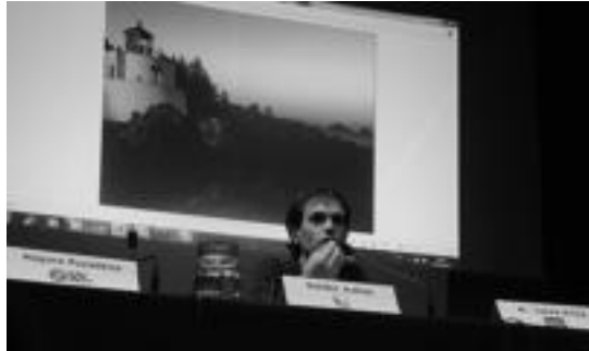
Villabonako Udalak bileretako «hutsunea» nabarmendu du.

Besteak beste, «etorkizunearn zabortegeiek orain arteko sistemen jarraituz gero izango luketen eragina, gaur egun udalarentzat defizitarioa den eredu honekin jarraitzeak dakarrena, eta hondakinak ongi sailkatzeak ingurumenearn eta ekonomian izan ditzakeen onurak», azaldu dituz-