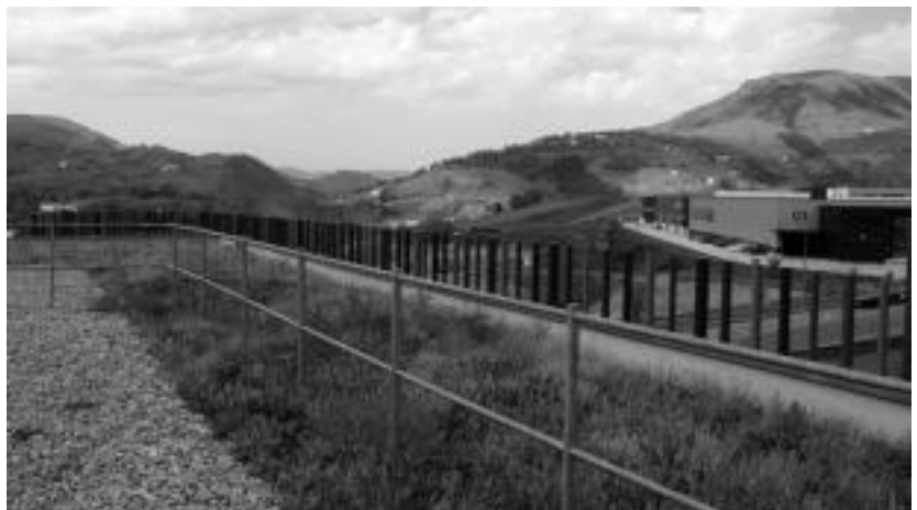
Apatta industrigunean dago Lehiberri, eta guztira 3.000 metro karratu ditu eraikina. I. URKIZU