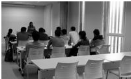
Bi formakuntza gela ditu zentroak, eta ikasleak lanean ari dira jada. I. U.

Tolosaldea Garatzen agentziaren bulegoak ikusiko ditu bisitariak, Lehiberri zentrorako sartutakoan;