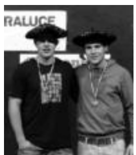
Tolosa eta Jaka. HITZA