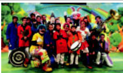
Tolosa Pirritx, Porrotx eta Marimotots pailazoek Tolosan ospatu dute 25. urteurrena Kilometroak 2013 ekimenarekin batera. Pailazoek Leizor aretoan bi emandakid eskaini zituzten. »

luzi asteburuko argazki, bideo eta albiste guztiak sarean: tolosaldea.hitza.info