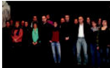
Tolosa Tolosako Udala, larunbatez geratzik Udalerri Euskararen Mankomunitateko kide da. Uemak Orion egin zuten batzarian izan zen onartu Tolosa. »