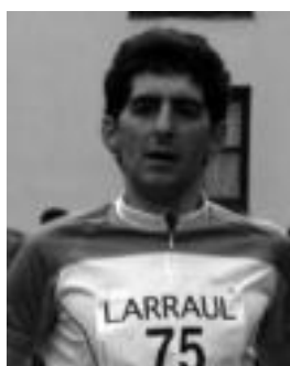
Letamendia oñatiarra eta Ibarbia zizurkildarra, helmugan. JONE AMONARRIZ

Larunbatean lortutako garaipenarekin, Ibarrako gizonak denboraldiko bigarren txapela lortu zuten 8x8ko modalitatean.