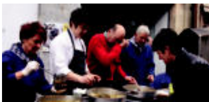
Tolosa Sukaldea egitasmoaren barnean, bertako barazkiekin prestatutako berdea banatu zuten. »