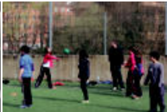
Tolosa Eskola txikien kirol tokapetak izan ziren, Usabal. Hamabost eskola txikiakoko neska-umeak elkartu ziren kirolen bidez elkar ezagutzeko. »