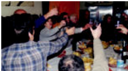
Tolosa Mintzalagunako partaideek eskaria egin zuten Oargi elkartearen. Egitasmoak euskaraz praktikatzeko beharra dutenak elkartzen ditu, eta 55 pertsonak emana dute izena. Astero elkartzen dira euskaraz hitz egiteko. »