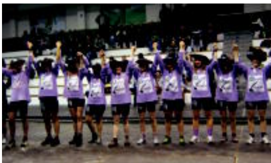
Ibarako sokatira taldeko neskek, txapelarekin. HITZA

Euskal Herriko Txapelketan, neskek 500 kiloko mailan eta mutilek 560 kilokoan lortu dute 06