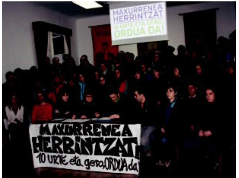
Iragan ostiralean elkartu ziren eragileak eta norbanakoak Maxurrenea itzultzeko eskaera eginez. I.T.

Leitzako eragile gehienek eta norbanako ugari Maxurrenea herrira itzultzeko emango diren urrats guztietan udalari babes osoa emateko borondatea adierazi dute. Halaber, Nafarroako Parlamentura zabalduko dute asmoa, eta talde desberdinekin elkartzeko nahia adierazi dute,