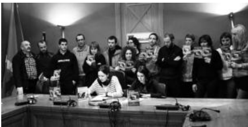
Ibarrako udal ordezkariak hainbat herritarren babesa izan zuten agerraldian. I. TERRADILLOS