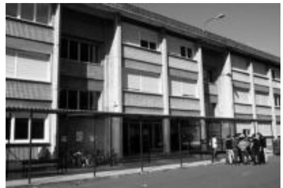
Ikastetxearen instalazioak eta baliabideak erakutsiko dituzte. HITZA

ikastetxeko zuzendaritzaren aurkezpena egingo dute. Jarraian, ikastetxearen informazioa eta ekimenak jorratuko dituzte, eta 19:00etan, instalazioak eta ekipa-