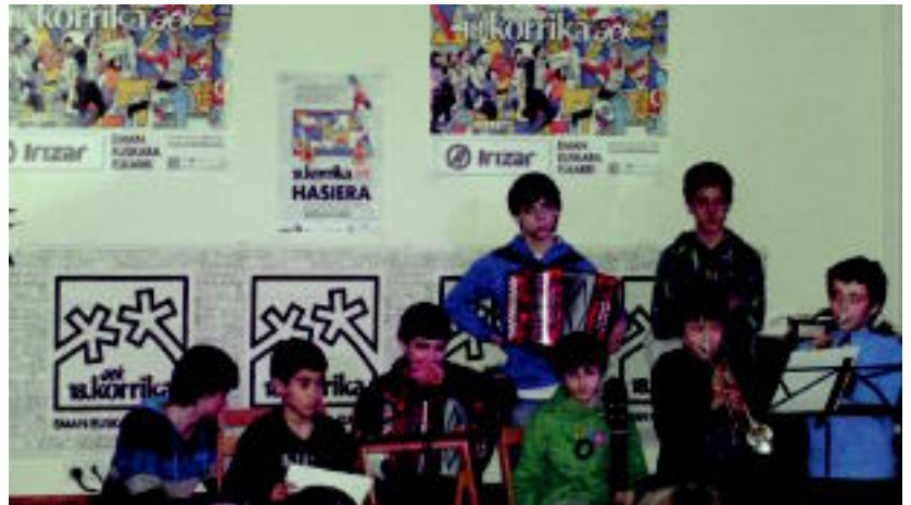
Korrika 18ren aldeko kontzertua eskaini zuten Adunako Loatzo Musika Eskolako ikasleek, herenegun.

tarekin batera, euskararen aldeko jaia lehertuko da eskualdeetako herrietara. Hainbat ikastetxeek Korrika Txikiak antolatu dituzte, lasterketa nagusira ongi berotuta iristeko. Tartean meriendarentzat ere lekua egongo da.