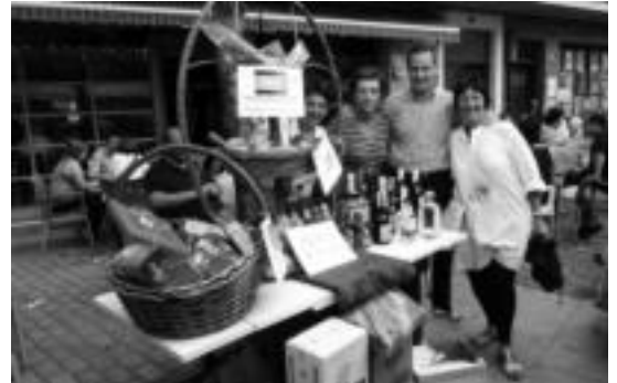
Ibarratik Misio Taldea Ibarrako azoka berezian. HITZA

Larunbatean jarraituko dute ekintzek. Egun horretan, elizbarrutiko haur misiolarien topaketa egingo dute. Igandean, hilaren 17an, berriz, San Bartolome Parrokiko Elizan, misio giroko eu-