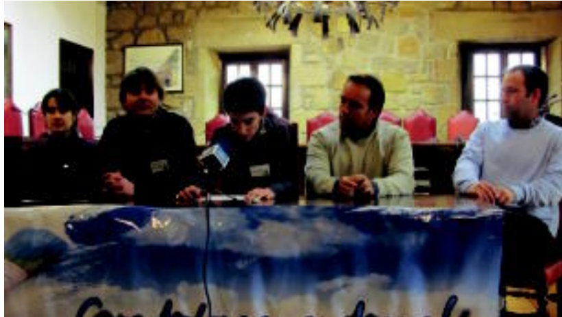
Uemak eskerrak eman zizkien bost herriek hartutako konpromisoagatik. HITZA

Larunbatetik aurrera, 69 izango dira Uema osatuko duten uda-