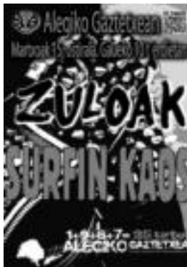
Kontzertuaren kartela. HITZA

25. urteurrenaren jarraipena Alegiako gaztetxeak 2012ko abenduan 25 urte bete zituen. Ospakizun gehienak azaroan, abenduan eta urtarrilean egin zituzten, baina ez zen dena hor amaitu, filoso-