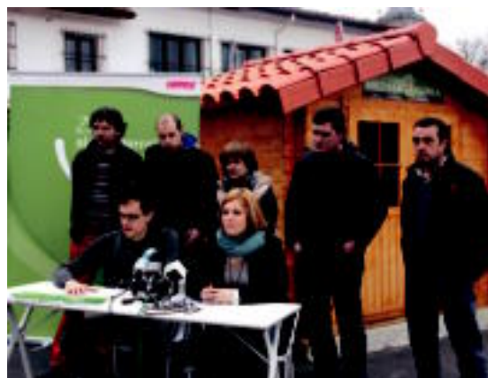
Bost udaletako ordezkariak Orendainen egin zuten agerraldia.

Zizurkil, Amasa-Villabona, Irura, Anoeta eta Alegian atez ateko bilketa sistema jarriko dute martxan; martxoan zehar bilketa modua azaldu eta herritarren ekarpenak jasotzen hasiko dira 03