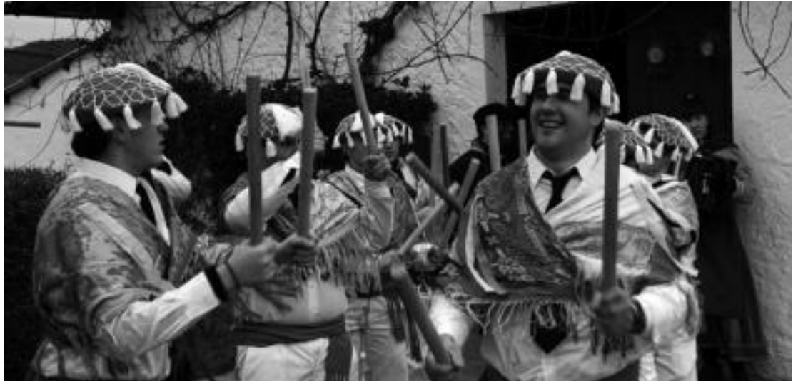
Goiz osoan zehar umore ona izan zen nagusi baserri baserri eskean aritu zen taldeko kideen artean. I.T.

■ Bideoa. Ikusi hemen, txantxoan makil dantzaren bideoa.