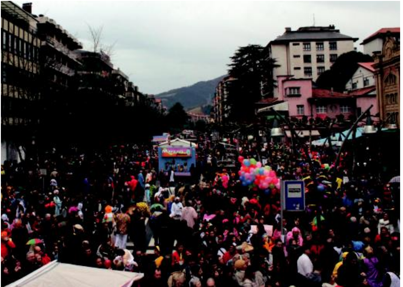
Euririk gabeko goizak kaleak txiki utzi zituen atzokoan. Irudian, San Frantzisko pasealekua jendez, konpartsez eta karrozez gainezka.

Astelehena, 2013ko otsailaren 11. IX. urtea. 2.543. zenbakia. tolosaldea.hitza.info