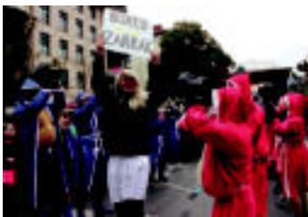
Indiana eta arrano erraldoia, hondakin bilketarekin parodia eginez, animatzaileak, boxeolariak edota trasteak soinean zeramatzatzenak. IZTALDEKO