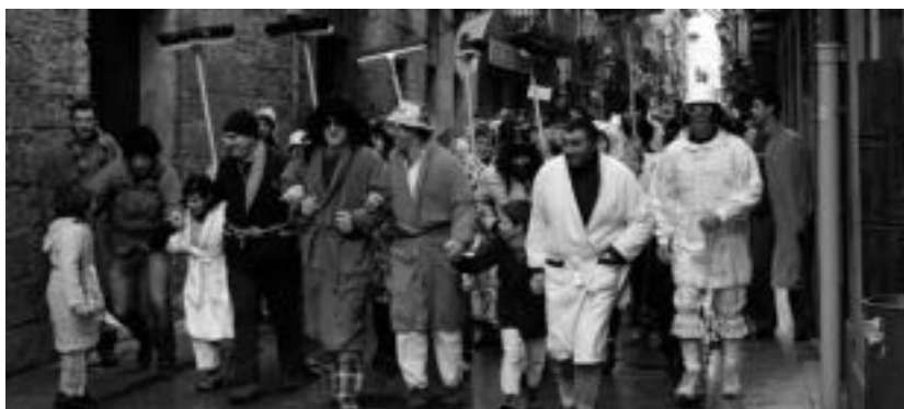
Haurrak, gurasoak, gazteak nahiz helduak elkartzen dira, tolosarrentzat hain berezia den Dianan. I. URKIZU