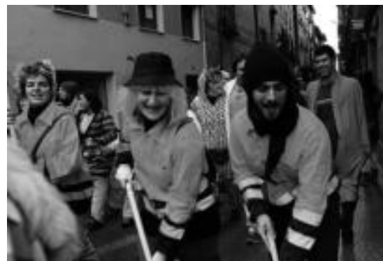
Goizean goiz jeikitzeak ez die umorerik kentzen inauterizaleei. I. URKIZU