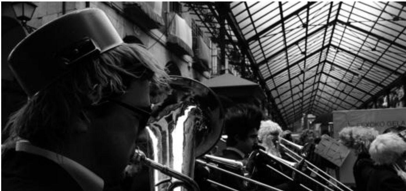
Tolosako Musika Bandak eman zion hasiera, atzo, Zaldunita egunari. ITZEA URKIZU