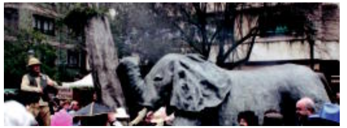
Marilynren soinekoa, 'Goenkale'-ren grabadoa, piratak eta Espainiako erregeak Afrikan ehizatutako elefantearekin eginko parodia, etzo San Frantzisko pasealekuan. IZTALDEKO