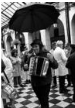
Euriaz babestu nahi izan zuten. I.U.