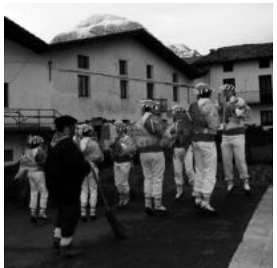
Abaltzisketako ia baserri guztietan eskaini zuten makil dantza txantxoek, soinu jolearen doinuak lagunduta. I.T.