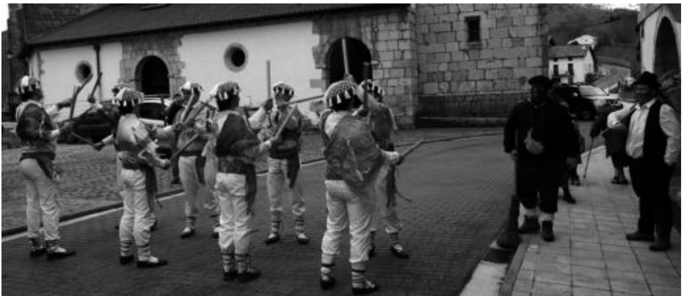
Abaltzisketako plazan dantza saioa eskani zuten unea. Herriko gaztetxoaren artean ikusmina piztu zuen emanaldia. I.T.