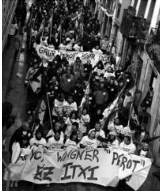
Tolosako kaleetan egindako manifestazioa. A. IMAZ

Enpleguaren inguruan baino ez zuten hitz egin enpresa burue-