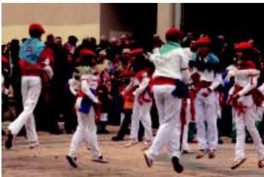
Lizartzan Otsolar dantza taldeak emanaldia eskaini zuen. JONE AMONARRIZ

Areson, Berastegin eta Lizartzan mozorroak jantzita ibili dira azken egun hauetan 05