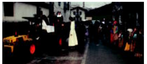
Aresoko gazteek, haurrekin eta gurusekin batera, herrian zehar itzulia eman zuten larunbatean, konpartsa eta gutxi. A.M.A.Z.

Areso, Berastegi eta Lizartza inauteriak ospatu dituzte asteburuan. Imajinarioa nagusitu da hiru herri hauean, diruaren gaitetik, eta giroa ere ederra izan da. Larunbatean, eguraldiak jaiarekin bat egin zuen, moztorio desberdinak jantzi zuten. Fuzkia, faltsa, euris, kezka, tximistak, tximistak, armairuan ehura bakarrik utzi zuten. Berastegin haurren jaialdia hauek zegoenent, tximistak frontoiko argia itzali zuten, haurren dantzei emozioa gehituz. Areson herrian barrena ibili ziren traktore eta guri haur, gorte eta gurusoak, larunbatean. Herri-tarrek prestatutako antzerkia ikusiko aukera ere izan zuten. Igardian, azken egunean, bertsio bazkaria egin zuten anesoarrek.