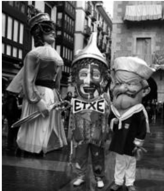
Aurkezpenaren ondoren kalejira egin zuten. A. IMAZ

Bide beretik, Aiz Orratz elkarteak lehendakariari txapela bat oparitu zion udalak, iaz mende erdia bete baitzuen, elkarteak antolatzen duen haur danborradak. Azkenik, bi elkarteei argazki