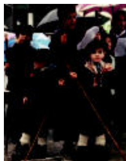
Ikasle eta gurasoak, Albizturren.

Eskualdeko herri askotan ohitura zaharrei tinko eusten diete, eta Agate Deunak eskatu bezala kantuan atera ziren bazkal ostetik iluntzera 03