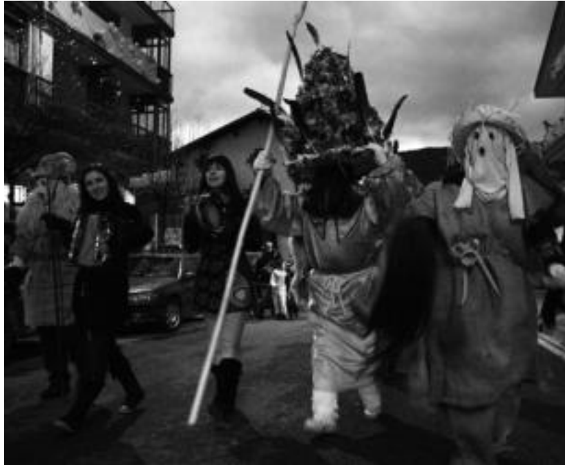
Pasa den urteko ihoteetako atsaureen kalejirako une bat.

Eskean, herrian eta auzoetan Herri kutsuko inauterietan izan ohi den moduan, Leitzakoetan ere eskean aritzea izaten da egitarauan nabarmentzen den ekitaldietako bat. Lehenengo egunean,