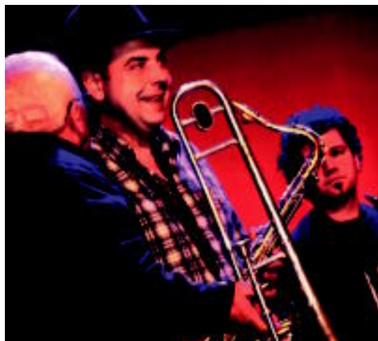
1978tik hona hainbat aldaketa jasan ditu jaialdiak. HITZA