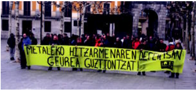
LAB sindikatuko metalgintzako ordezkariak elkarretaratzea egin zuten, atzo, Tolosako Trianguloa plazan. I.&L.