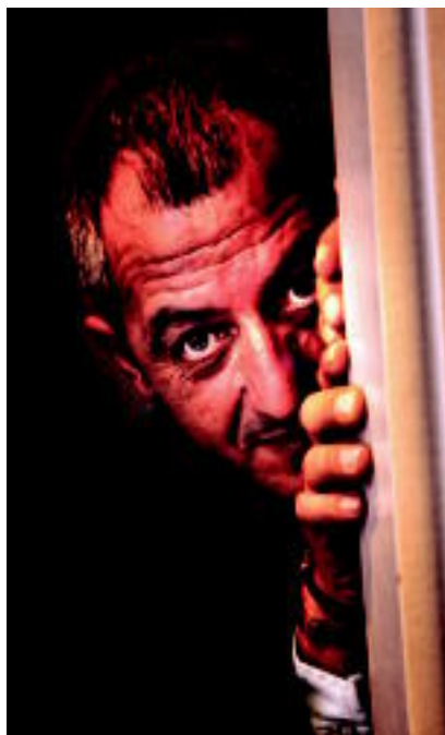
Argazkien artean, lehen plano edo erretratu asko daude; guztiak Arpegiko kideenak dira.