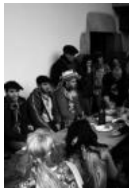
Baserrietan, eskean, iaz. IT.