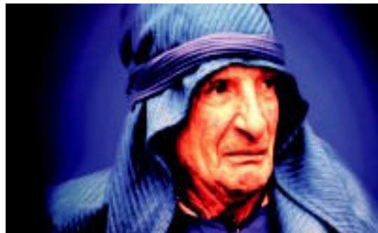
Erakusketan dagoen berrogeita bederatzigarazkietako bat. HITZA

Tolosako Arpegi taldeak egin duen erakusketa otsailaren 1a bitarte egongo da ikusgai; Iñaki Elola da argazkien egilea 05