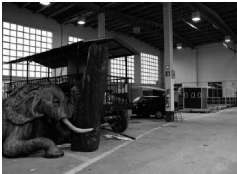
300 parte hartzaile inguruk eman dute izena, aurtengo lehiaketan. I. URKIZU

TOLOSA › Lara Arruabarrena tenislari tolosarra Australiako Openetik kanpo geratu da lehenengo errondan. Taiwango Su-Wei Hsieh tenislariaren aurka galdu du 7-6(5) eta 6-2 emaitzarekin, ordu eta 40 minutuko norgehiagokan. Bigarren seta ondo hasi duen arren, ezin izan du taiwandarrarekin.