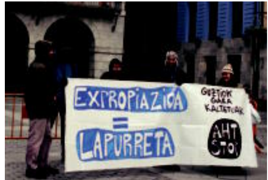
Desjabetzen aurkako protesta Tolosako udaletxe atarian. ESTI EZBIZA

Anoetan desjabetzen aurkako elkarretaratzea egingo du AHT Gelditu! Elkarlanetik, bihar, 08:30ean