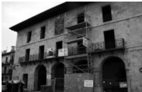
Hamar hilabete inguru iraun dute obrek. I.T.

Hala, otsailaren zehar egingo dute leku aldatzea, eta martxo alderako udal bulegoak bertan martxan izatea espero dute. Lehen fase horretan altzariak aurreikusitako gabe zeuden, baina, azkenean, Eusko Jaurlaritzatik nahiz