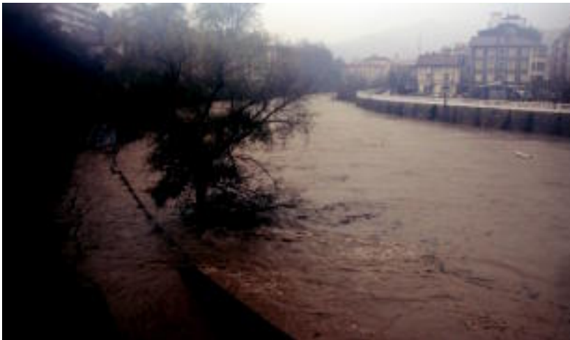
Tolosan Oria ibaia gainezka egin zuen puntua.

Bada, iragarpenen eta larrialdi zerbitzuen arabera, «okerrena» igaro den arren, oraindik ere zeruari begira igaro beharko da, ostera lasaitasunera heldu bitarte.