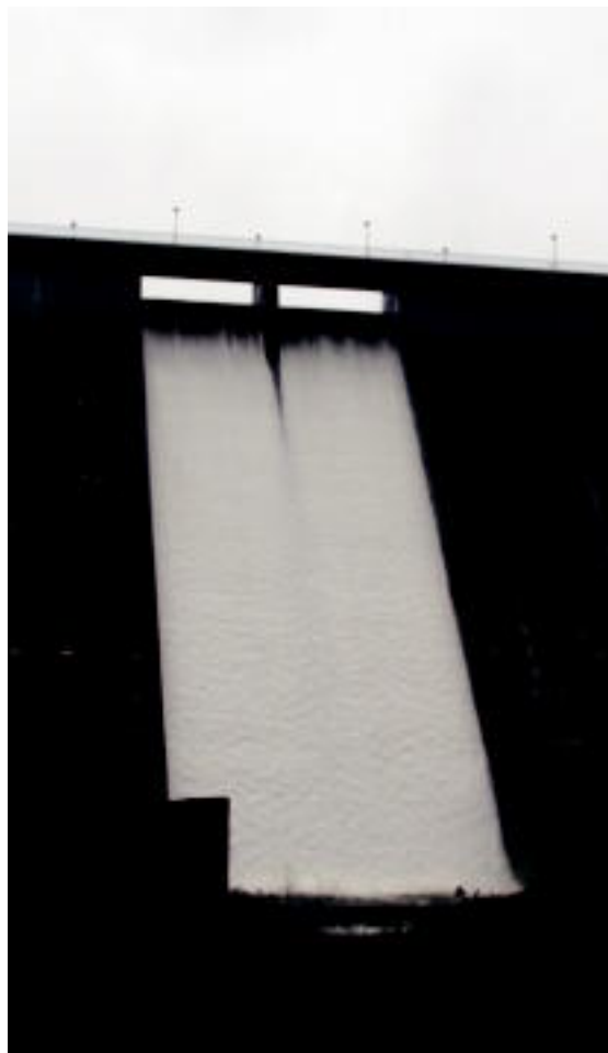
Alegian Oria ibaiak eta Amezketaren erreka bat egiten duten tokian ura ateratzen; Baliarraingo Ibiur urtegia goiko ur zuloetatik ateratzen da, atzo, ur-jauzi baten itxura hartuz. E.MAIZ