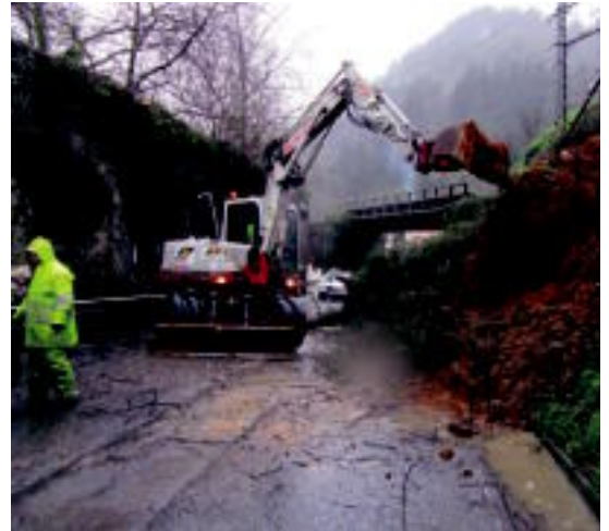
Tolosako Olarrain auzoan luizi bat eragin zuen urak. A. IMAZ