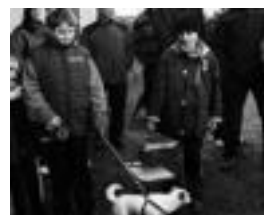
Animaliak bedeinkatzen, iaz. I.T.

Bada, animaliak bedeinkatzeaz gain, hamaiketako egiteko aukera izango dute gerturatzeko direnak, elizkizuna amaitzean prest egongo baita elizaren atarian jatekoa eta edatekoa.