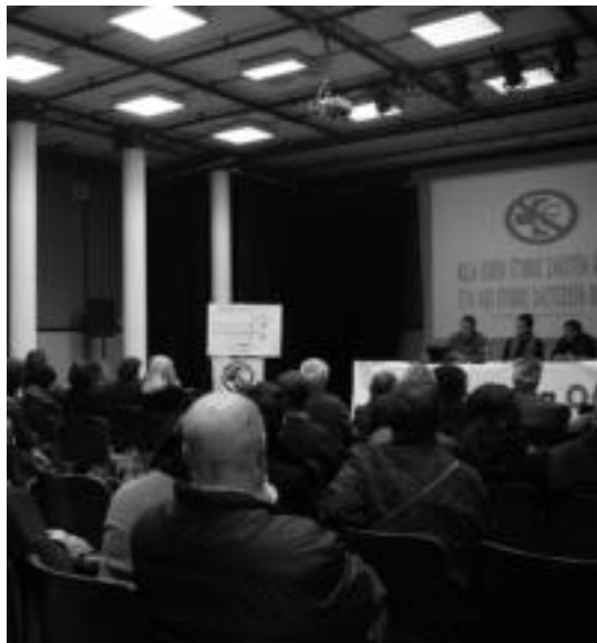
Pasa den abenduan Tolosako kultur etxean batzarra egin zuten. E. MAIZ

Zentzu honetan koordinatzaileak kideak, Osakidetzak egindako azterketa bat ekarri du gogora,