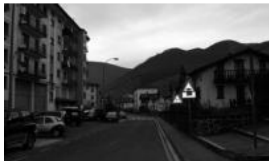
La auzo guztian egingo dituzte urbanizazio lanak. I.T.

Leitzako Udalak lehiaketara ateratu zuten obra hauek esleitzeko prozesua, eta azkenean Arian enpresa izan da lehiaketa irabazi eta lanak egitearen ardura hartu duena.