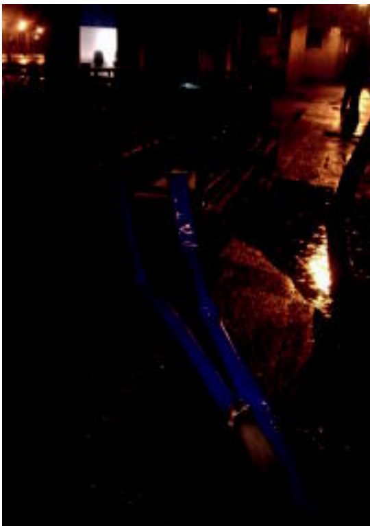
Tolosako Iurre auzoan garajeetatik ura ateratzen. R.C.